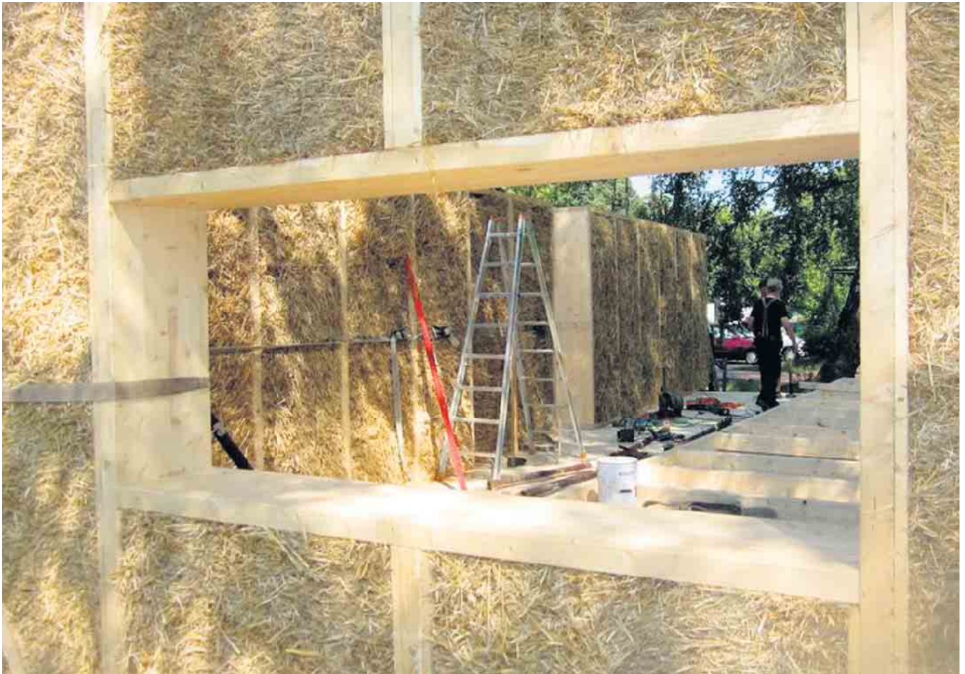
Natürliche Dämmstoffe schaffen ein gesundes Wohnklima