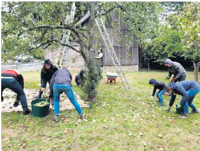
Es hieß: Es ist Apfelernte in Freckhausen

Am Samstag, 17. September, war in Freckhausen der alljährliche Termin, um mit den Dorfkinder die dorfeigenen Äpfel und Birnen on den Streuobstwiesen zu ernten. Es ist mittlerweile eine gute Tradition, das Obst in eine Fruchtsaftkelterei zu bringen, um dafür leckeren Apfelsaft zu erhalten, der dann an die fleißigen Helfer verteilt wird. Leider meinte es Petrus nicht gut mit uns. Pünktlich gegen 14 Uhr goss es wie aus Kübeln. Trotzdem ließen sich viele nicht abhalten, sie kamen mit Gummistiefeln, Regenhosen und -jacken und machten sich in strömendem Regen an die Arbeit. Belohnt wurden sie im Anschluss mit leckeren Waffeln und heißen Getränken. Groß wird die Freude der Freckhausener Kinder sein, wenn die