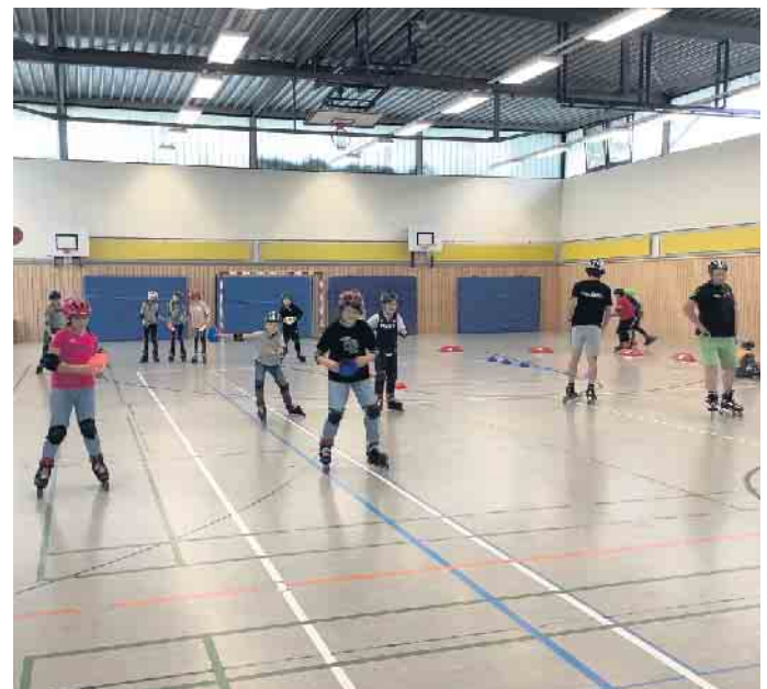
Das DSV-Mobil zu Besuch an der Gesamtschule Reichshof