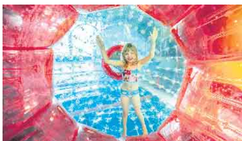
Freienspaß im monte mare

Wettkämpfen rund ums nasse Element. Voraussetzung für die Teilnahme am vierstündigen Programm ist das Seepferdchen. Als Bonus für alle Eltern genießen diese währenddessen ihre Wellnesszeit in der Sauna ohne Kids – sie zahlen 2 Stunden und bleiben 4 Stunden. Buchung der Wasserspiele im monte mare Onlineshop: www.monte-mare.de/reichshof .