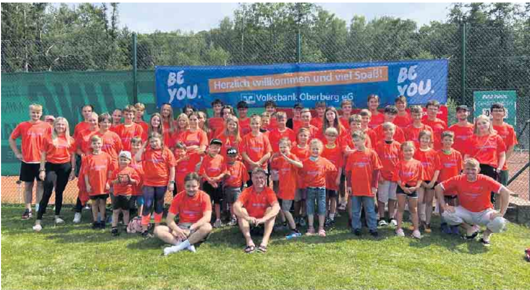
Das Tenniscamp war auch im Jahr 2022 ein voller Erfolg.

Auch in diesem Jahr fand wieder das beliebte „Tenniscamp“ des TC Wiehltal auf der Anlage in Reichshof-Brüchermühle statt. In diesem Jahr stand das Camp unter dem Motto „Olympia“ statt und insgesamt hatten sich 48 Kids im Alter von 4 bis 18 Jahren und 18 Betreuer zusammengefunden, um sich wiederzusehen, neu kennenzulernen und um gemeinsam Spass zu haben. Nachdem alle Zelte mühsam aufgebaut wurden, geht es für die einen direkt zu einer Runde Rundlauf an die Tischtennisplatte, während die anderen schon die Badehose anhatten. Auch auf dem Tennisplatz wurde es spannend. Nachdem sich viele Kids spannende Duelle lieferten hieß es Spiel, Satz und Sieg, bevor sie sich leckere Würstchen oder vegetarische Alternativen im Brötchen genossen. Wie auch letztes Jahr wurden die T-Shirts, die jeder Teilnehmer nach Ankunft bekam, von Sport-Küpper gesponsert. Leider musste das Betreuersteam auf unseren verletzten Trainer Thomas Disselmeyer verzichten, der nur bedingt am Camp teilnehmen konnte. Zum Ausklang des ersten Abends trafen sich die Kinder und Betreuer am Lagerfeuer zu leckerem Stockbrot, bevor es dann ins Zelt ging. Nicht wirklich ausgeschlafen, aber mit einem Frühstück gestärkt, ging es am Samstag sportlichen weiter. Traditionell gibt es auch für alle eine Abkühlung im Pool, für manche mehr oder weniger unfreiwillig. Da auch das Wetter perfekt war, hat allen eine erfrischende Kugel Eis, von unserem Sponsor Till Idelberger und