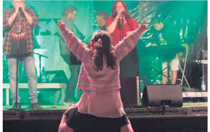
Auch das ganz junge Publikum fand's gut.

auf dem Dorfplatz. Rund 1.500 Gäste waren diesmal gekommen, um den Sommerabend mit Live-Musik zu genießen. „Kommt nach vorne und rockt mit uns“, rief