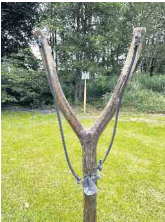
Mit der mannshohen Fletsche wird der König ermittelt.

Unterhaltung sorgen wieder die DJs Kevin und Marco. Der Sonntag, 31. August , beginnt um 11 Uhr mit der Eröffnung des Bierstandes. Im Anschluss startet um 12 Uhr der bekannte Fletschen-Team-Wettbewerb, der zum 40.-jährigen Vereinsjubiläum etwas Besonderes bieten wird. Wie gehabt, bilden fünf Schützen eine Mannschaft und versuchen, so viele Treffer wie möglich auf dem Blechvogel zu landen. Die ersten drei Plätze werden mit Preisen belohnt. Teilnehmen darf hierbei jeder. Während die Eltern und Großeltern bei Kaffee und Kuchen den Nachmittag genießen, können sich die jüngsten Festbesucher bei der Kinderbelustigung mit Hüpfburg auf dem Spielplatz austoben. Veranstaltungsort: Dorfplatz in