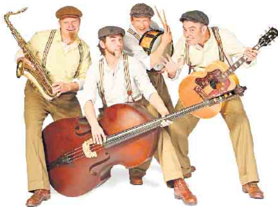
Die „Speedos“ spielen am Abend am Kunstkabinett in Hespert.

Gezeigt werden rund 60 Exponate von Schülerinnen und Schülern im Alter von 11 bis 18 Jahren. Ziel der Ausstellung ist es nicht nur, die kreativen Arbeiten zu präsentieren, sondern auch den individuellen