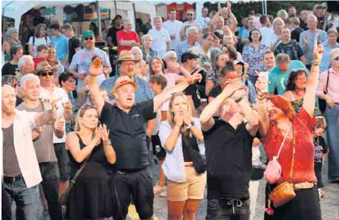
Die Zuhörer gingen begeistert mit.

Das Konzert unter freiem Himmel lockte eine Rekordzahl von Besuchern