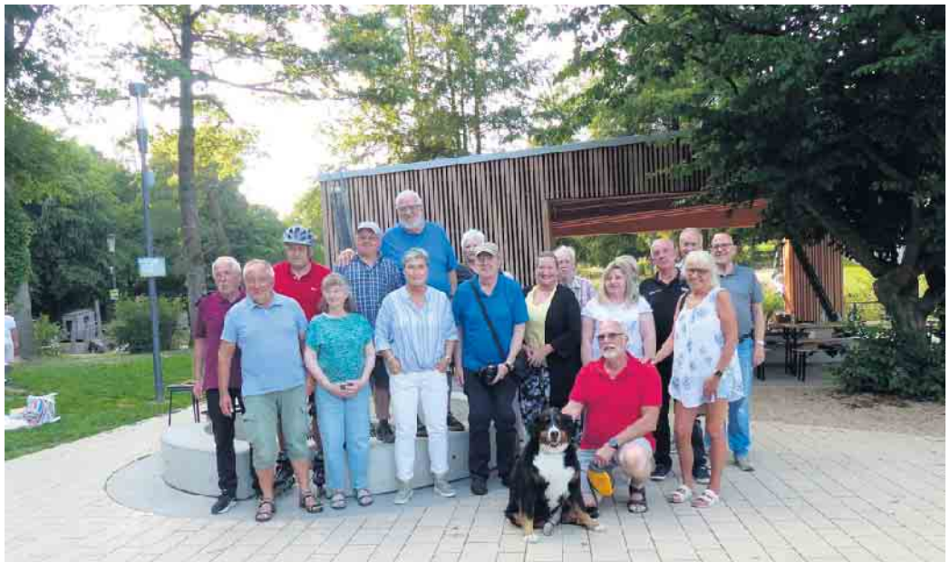
Zum Sommerfest traf sich der Bürgerbus Verein Reichshof im Wiehlpark.

Das gemeinsame Anliegen, die Mobilität im eigenen Ort zu verbessern, schafft Verbindung. Da wurde die Einladung von 30 Teilnehmenden gerne zum Anlass für einen lebendigen Austausch genommen. Neben Anekdoten aus dem täglichen Fahrdienst war auch genügend Zeit für neue Ideen, vielleicht wurde auch der eine oder andere neue Fahrer gewonnen.