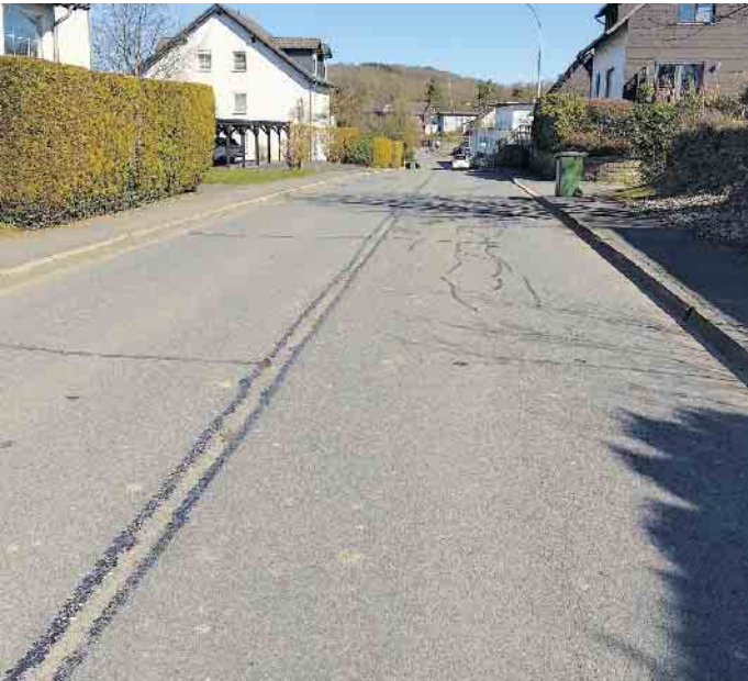
Der erste Bauabschnitt der Sanierungsarbeiten der K 16 beginnt oberhalb der Talsperrenstraße in Brüchermühle und endet am Ortseingang Heischeid.

Große Maßnahme zwischen Brüchermühle und Schemmerhausen