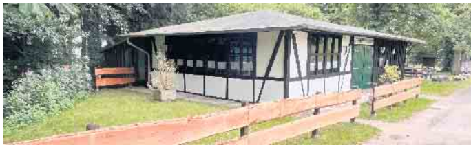
Das Dorfhaus in Sterzenbach kann auch tagsüber gemietet werden.

Viele helfende Hände und ein paar Spenden waren notwendig für die Renovierung der Außenfassade und der Umlagen des Dorfhause in Sterzenbach.