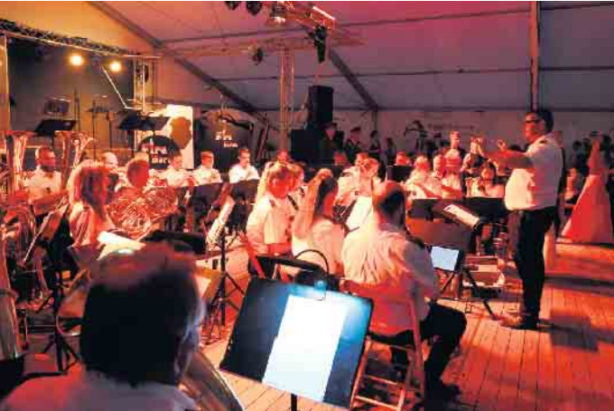
Der Musikzug Bergerhof spielt auf dem Schützenfest.

Durch eine neue Vogelkonstruktion wurde das Königsschießen zu einem Blitzwettbewerb