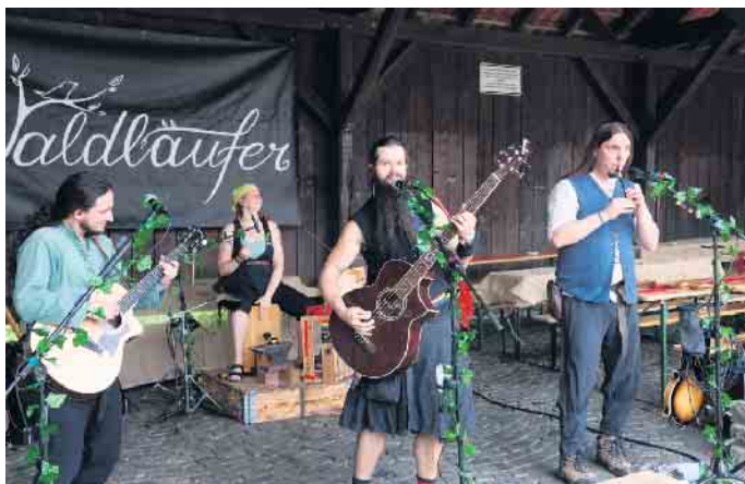
Die Band „Waldläufer“ begeisterte mit flotten Rhythmen.

von den „Waldläufern“ aus dem Siegerland beim „Mittelalterspectaculum zu Denklingen anno 2025“.