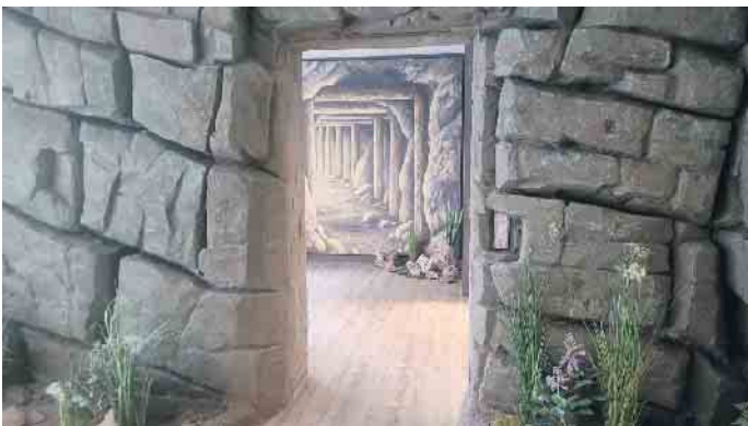
Die Grubenausstellung wurde neu gestaltet.