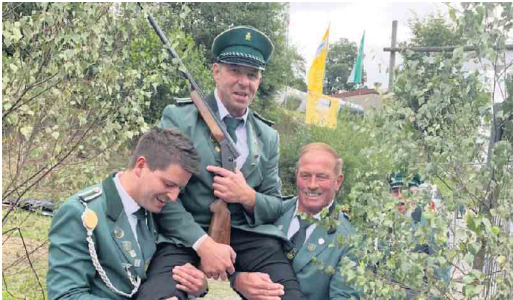
Die Spannung ist groß, wer wohl in diesem Jahr den Vogel von der Stange holt.

Der Schützenfestsonntag beginnt um 10 Uhr mit einem Festgottesdienst und um 15 Uhr ist alles auf den Beinen beim großen Festumzug durch Heidberg, mit dem Musikzug Bergerhof der Freiwilligen Feuerwehr Reichshof, mit an-