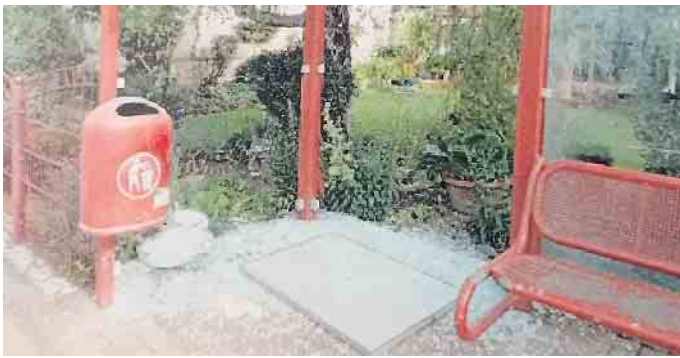
Neben Schemmerhausen wurde auch die Buswartehalle in Mittelagger zerstört.