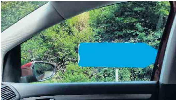
Nahe Kalbortal wurden beide Hinweisschilder besprüht.

In den letzten Tagen und Wochen häufen sich die Beschwerden über zerstörte Hinweisschilder und Buswartehallen. Die beschädigten Güter müssen kostenaufwändig ersetzt oder zeitintensiv gereinigt werden. Ein Zustand, der gar nicht sein müsste.