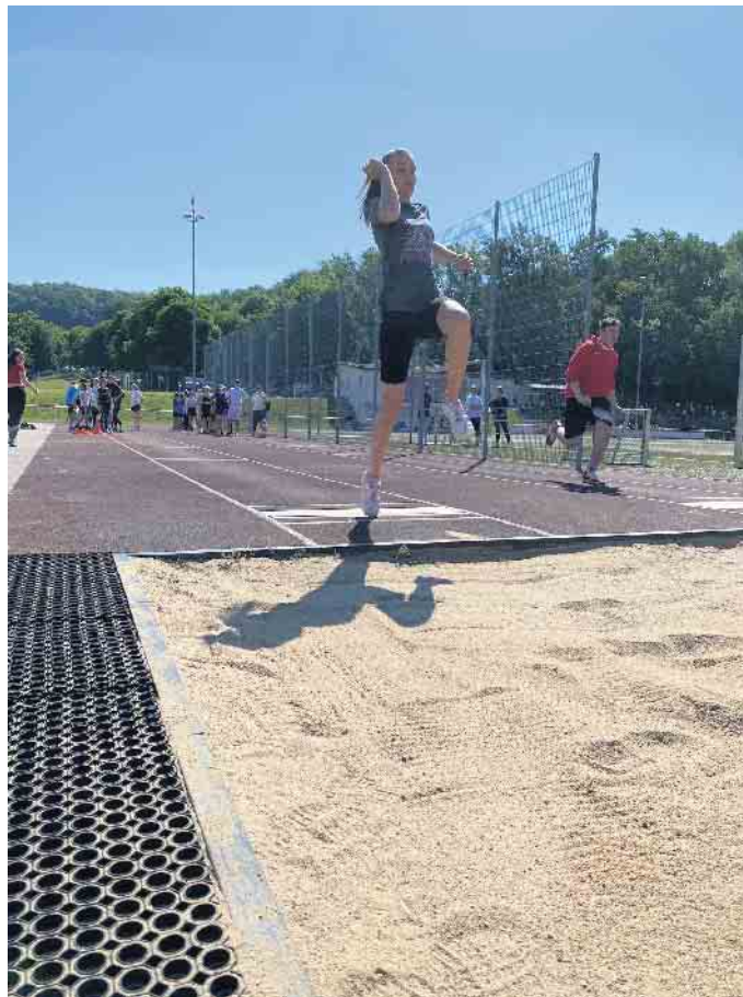
Auch im Weitsprung wurde genau gemessen, um die Besten zu ermitteln