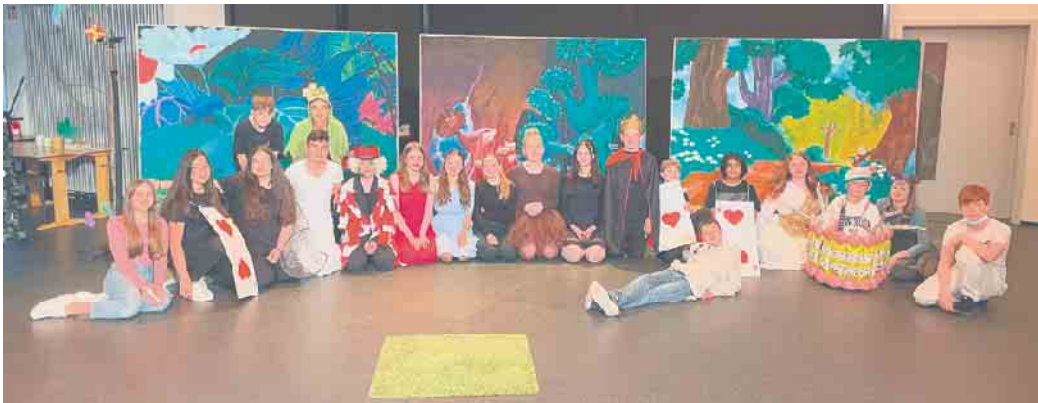
Das Ensemble von „Alice im Wunderland“ der Gesamtschule

In ein zauberhaftes Wunderland der Imagination entführte die Theaterklasse 7c der Gesamtschule Eckenhagen am 8. Juni ihr Publikum. Unterstützt von der Kreativklasse 7d präsentierte das Ensemble Lewis Carrolls „Alice im Wunderland“ vor den Abschlussklassen der Grundschule und den Theaterklassen 5c, 6c und 9c der Gesamtschule. Für die Eltern präsentierte die Klasse 7 c eine Aufführung am Abend des gleichen Tages. Nach einem Jahr Probe, vielen Entwürfen zur Gestaltung des Bühnenbildes, den Planungen