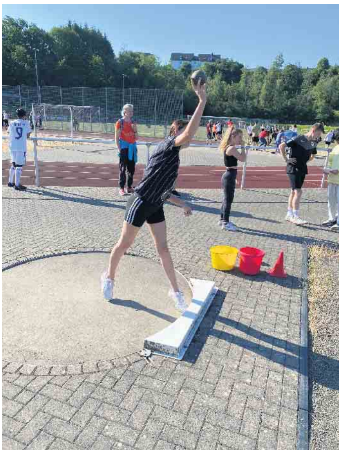
Eine der Disziplinen: Kugelstoßen