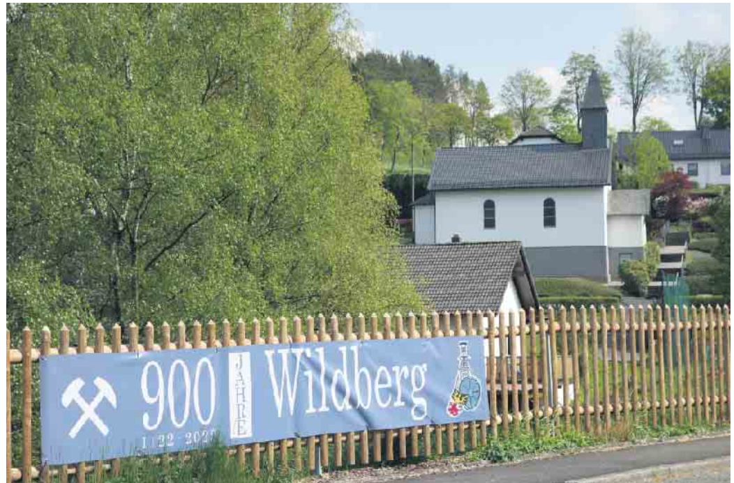
Wildberg feiert den 900. Geburtstag. Die Kapelle ist täglich geöffnet.