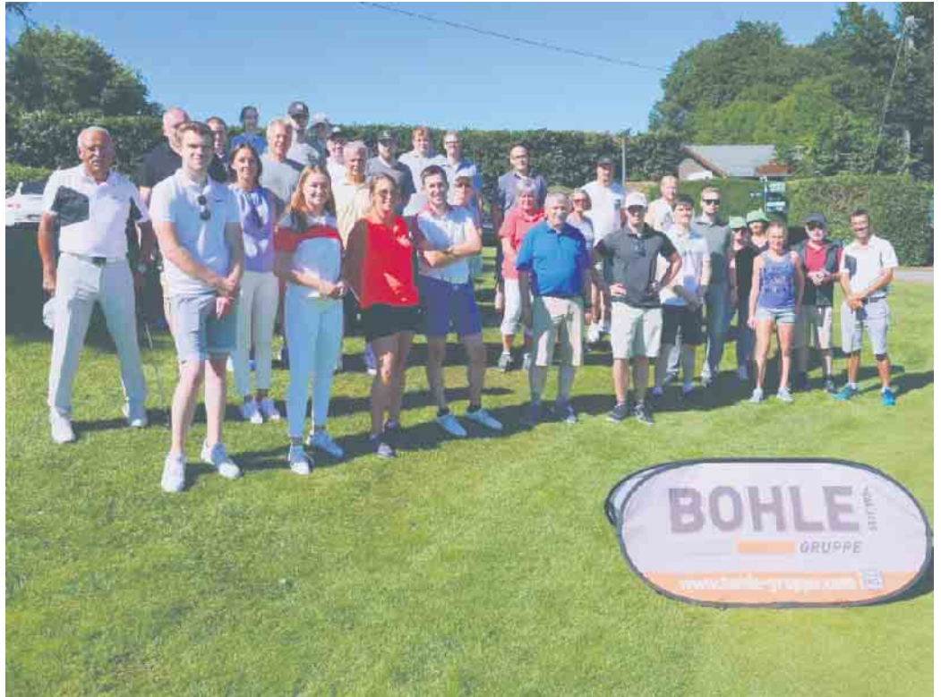
15 Teams meldeten sich in diesem Jahr zur Player Challenge an