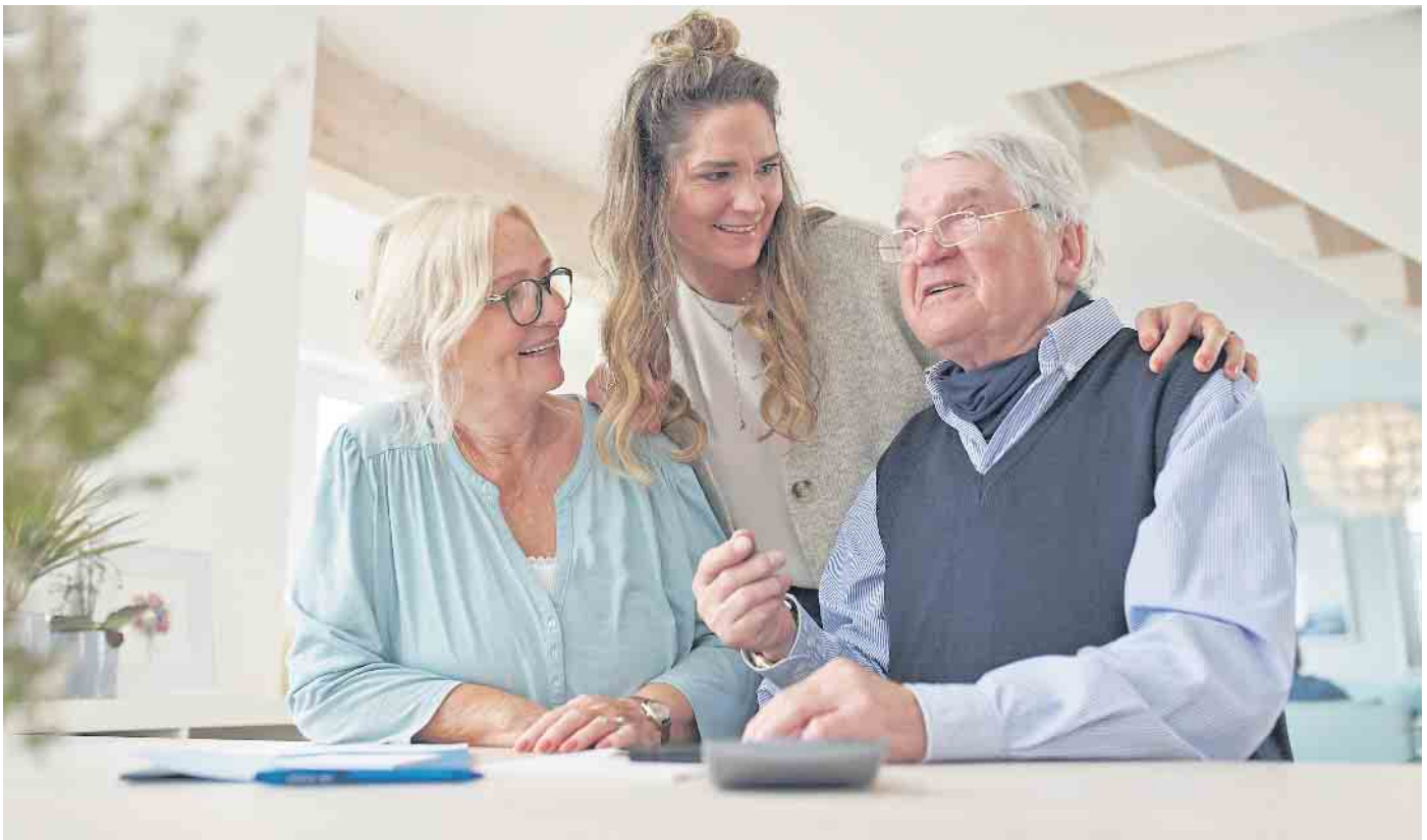
Eine Eigentumswohnung für die Kinder kaufen: Dieses Finanzierungsmodell ist bei Immobilienbesitzern und Banken gleichermaßen beliebt.