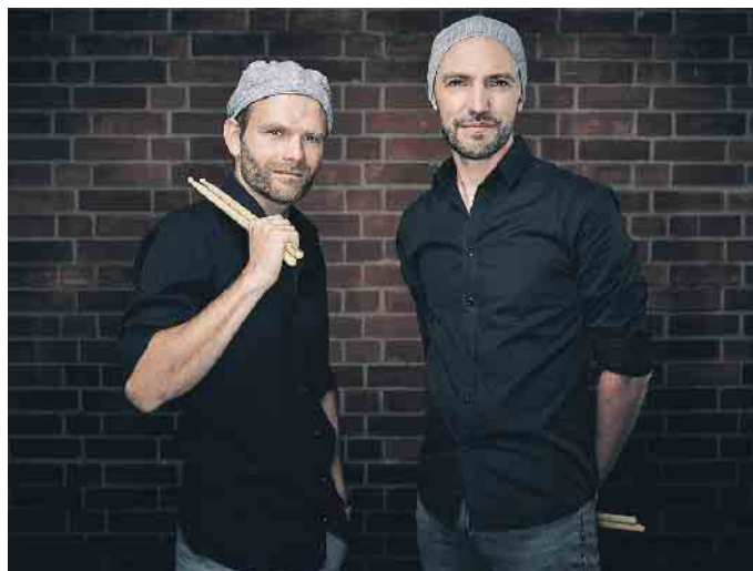
Double Drums kommt nach Eckenhausen.

Das preisgekrönte Percussion-Duo Double Drums gastiert mit seinem Programm „Beat Rhapsody“ am 12. August im Kulturforum in Eckenhausen. Ein musikalisches Sommerspektakel der besonderen Art. Die beiden Multi-Percussionisten zaubern aus einer Bühne voll mit Trommeln, Mülltonnen, Glockenspiel, Marimba, Kartons und Töpfen ein Gesamtkunstwerk, das einen immer wieder staunen lässt. Eine perfekte Choreografie leuchtender Sticks, faszinierende Sound-Loops oder eine humorvolle Luftschlagzeug-Einlage ganz ohne Instrumente: die Perfektion und Symbiose der beiden Meisterklassen-Schlagzeuger ist verblüffend - auch dann, wenn