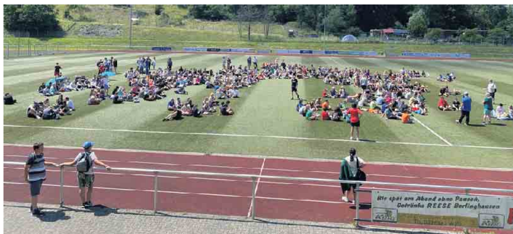
Unmittelbar vor den Ferien nahmen bei idealen Wetterverhältnissen die Jahrgänge 5 - 9 an den Spielen teil

Verpflegung für alle Aktiven stellte der Mensverein bereit und trug mit Grillwürstchen und Getränken ebenfalls zur guten Wettkampfatmosphäre bei. Ideales Wetter motivierte zusätzlich zu tollen Leistungen. Nach deren Auswertung steht eine beachtliche Urkundenbilanz zu erwarten. Die Ergebnisse werden demnächst ebenso mitgeteilt wie diejenigen des Sponsorenlaufs, den die Gesamtschule Reichshof am 14. Juni durchgeführt hat.