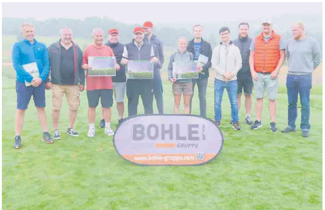
Die drei Erstplatzierten freuten sich über die Geldpreise