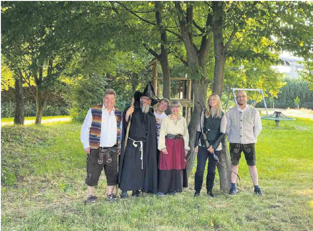
Voller Vorfreude sind die Mittelaggerer, wenn aus ihrem Heimatort „Mittelerde“ wird.

Ab 22 Uhr steht ein Feuerwerk an. In „Mittelerde“ liebt man das Feuerwerk und das darf auch in Mit-