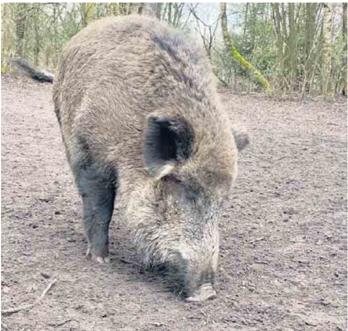
Die Afrikanische Schweinepest ist im Nachbarkreis Olpe ausgebrochen.

chenmarkt in Mittelagger vertreten. Von 09:30 - 13:00 Uhr informieren und beraten die Mitarbeiterinnen auf dem Dorfplatz zu Unterstützungsangeboten, Finanzierung von Pflege und anderen Hilfen. Mit von der Partie ist OBERBERG_FAIRsorgt.