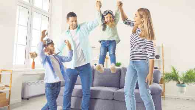
Mehr Lebensluft mit gesunder Raumluft: Lüftungsanlagen führen Schadstoffe zuverlässig ab und halten dank Filtertechnik Pollen und Feinstaub draußen.

Systeme für Wohnungslüftung sorgen dank Feinfilter für allergenfreie Raumluft