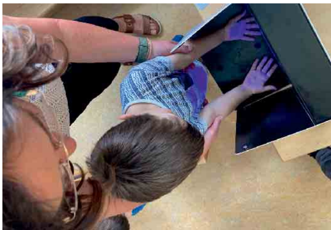
Das farbige Licht zeigt, dass die Hände noch nicht sauber sind.