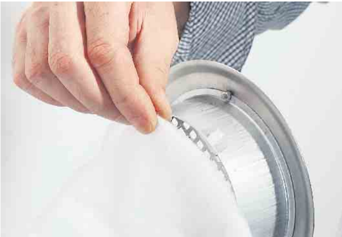
Damit das Lüftungssystem effizient arbeitet, sollten die Filter mindestens einmal im Jahr überprüft und ausgetauscht werden.