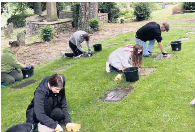
Der 10er-Jahrgang der Gesamtschule reinigte alle Gedenkplatten auf dem Friedhof in Denklingen.