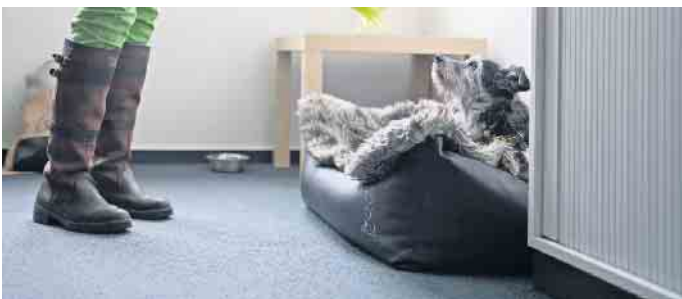
Kollege auf vier Pfoten: Hunde im Büro werden von vielen Unternehmen akzeptiert. Wichtig sind jedoch klare Regeln.