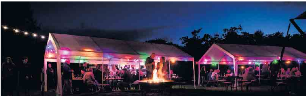
Am 19. Juli kann jeder beim Kantinenquiz mitmachen.

Seid dabei, wenn wir am 19. Juli eure Gehirnzellen glühen lassen! Meldet euch jetzt an für unser spannendes Kantinenquiz und taucht ein in eine Welt voller kniffliger