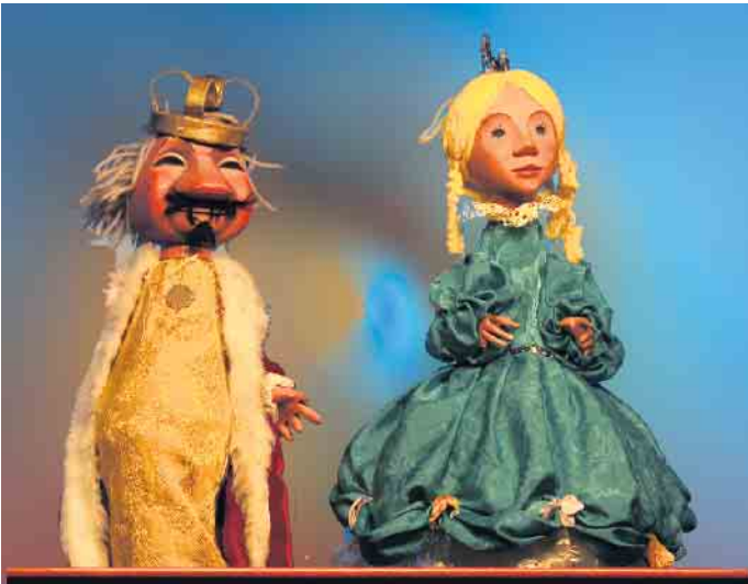
„Der gestiefelte Kater“ wird im Kurpark gezeigt. Bild: © Andreas Blaschke, Figurentheater Köln

Die Sommerferien starten in diesem Jahr mit einem besonderen kulturellen Highlight für Groß und