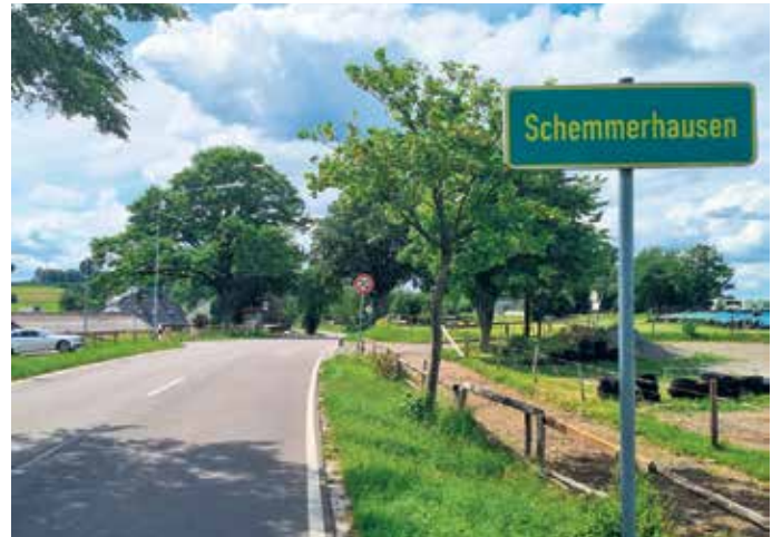
Ab sofort gilt Tempo 70.

Die neuen Verkehrszeichen wurden kurzfristig installiert. Die Gemeinde Reichshof bittet alle Verkehrsteilnehmerinnen und Verkehrsteilnehmer, die neue Regelung zu beachten und weiterhin mit besonderer Aufmerksamkeit und Rücksicht unterwegs zu sein.