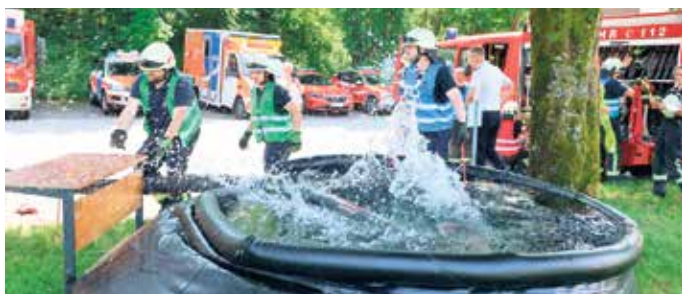
Das Wasser spritzte hoch auf, als der Saugschlauch in das Becken tauchte.

Die Feuerwehren aus dem Kreis zeigten, was sie können