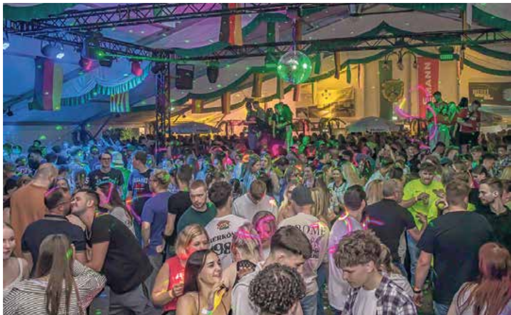
Die Mallorca-Party steigt am 3. Juli im Festzelt in Sinspert.

Der traditionelle Höhepunkt des Schützenfestwochenendes folgt am Samstag, 4. Juli. Nach dem Anreten der Schützen, der Kranzniederlegung am Ehrenmal und dem Abholen der Majestäten beginnt das Königsvogelschießen. Am Abend zieht der große Festumzug durch den Ort, bevor im Festzelt der Festkommers mit Krönungszeremonie stattfindet. Im Anschluss sorgt die Band "UN-ART" bei der großen Königsparty für beste Stimmung bis tief in die Nacht. Auch der Sonntag steht ganz im Zeichen der Gemeinschaft. Nach dem Frühstück der Schützenfrauen und dem traditionellen Anreten folgt das Abholen des Königs. Den Abschluss