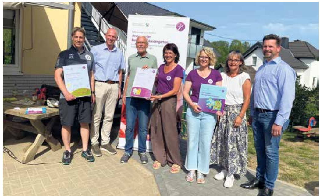
Die Akteure trafen sich auf Panabora zur Übergabe der Zertifikate.