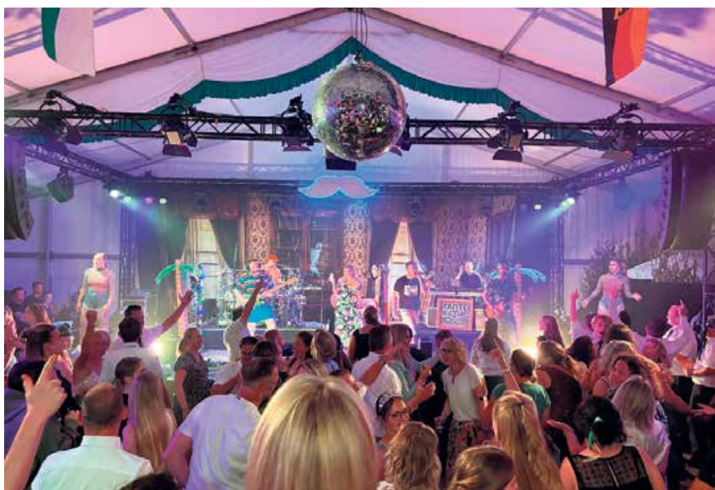
Am Schützenfest-Samstag spielt die Gruppe UNART.

bildet der musikalische Frühschoppen und der traditionelle Festausklang "nach Siesperter Art".