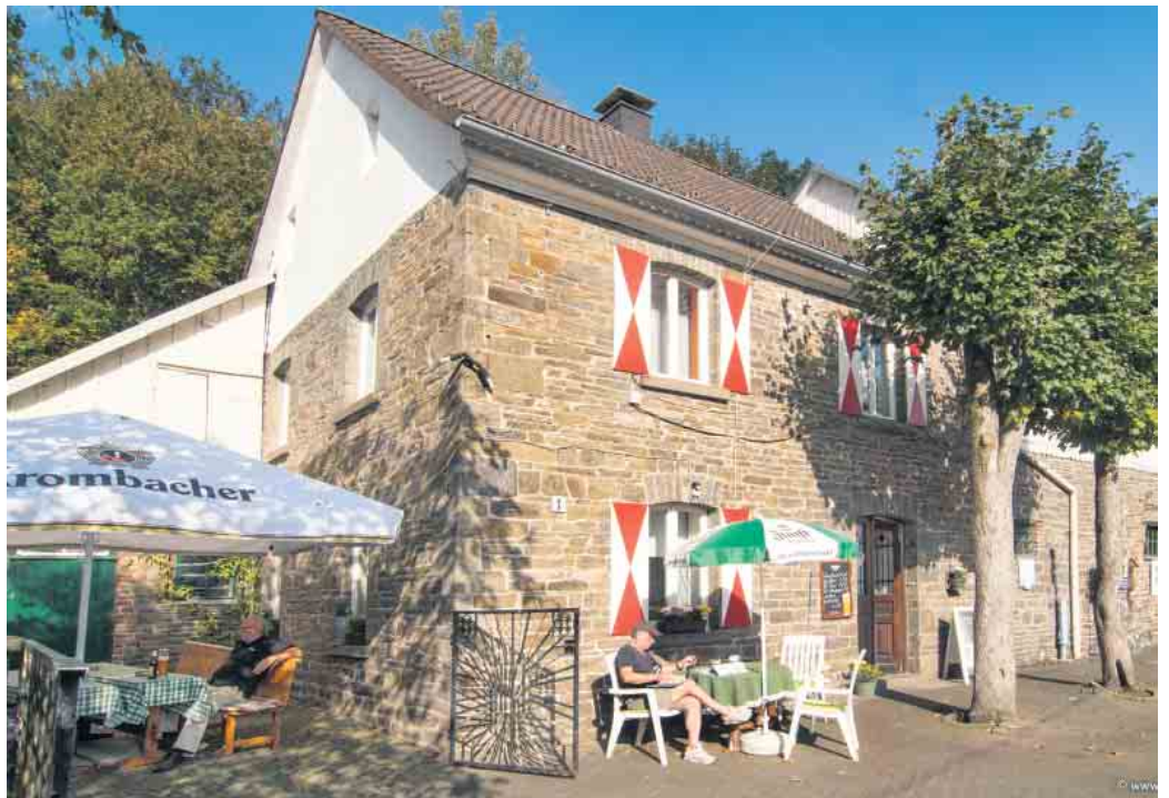
Pfingstmontag ist bundesweiter Mühlentag. Die Mühle in Nespen öffnet Türen und Tore.

Auch in diesem Jahr findet wieder das beliebte Mühlenfest an der Historischen Mühle in Nespen statt. Im Rahmen des deutschen Mühlentags öffnen die Mühle und das angrenzende Mühlencafé am Pfingstmontag, 9. Juni, ab 11 Uhr die Pforten. Musikalisch begleitet wird das Fest mit Oberkrainer Blasmusik durch „Die Geininger“. Frisch gebackenes Mühlenbrot, ein kleiner Handwerksmarkt und leckere Grillspezialitäten runden das Angebot ab. Die Mühle in Nespen steht im südlichen Teil des Oberbergischen Kreises bei uns in der Gemeinde, oberhalb der Wiehltalsperre. Es handelt sich um eine halbautomatische Mühle, die bis zum Schluss von einer Turbine angetrieben wurde. Im Jahre 2009 wechselte der Besitzer und Markus Jaeger hat die Mühle von der Tochter des Müllers Wilhelm Braun gekauft und nach 53 Jahren aus ihrem Dörrschlaf geweckt. Weitere Infos: www.muehlenfreunde-nespen.de