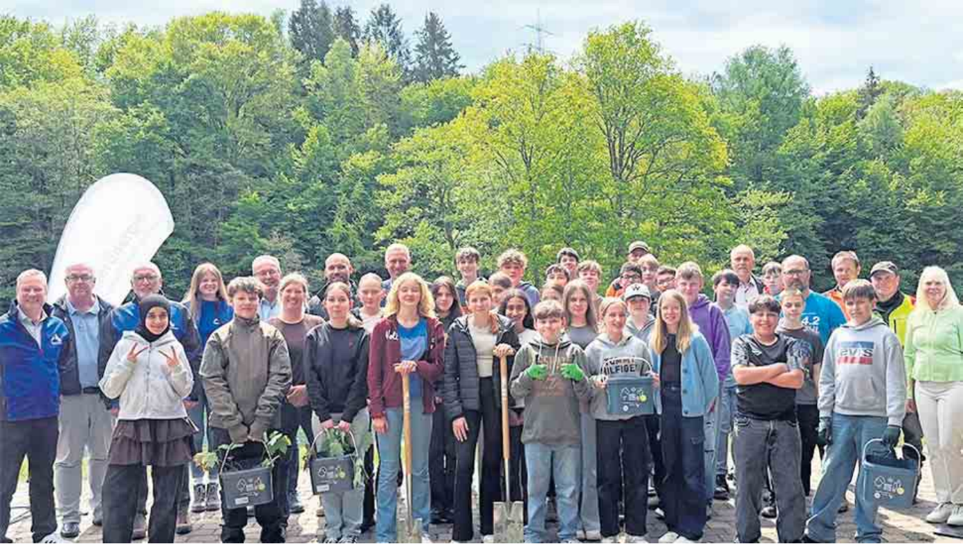
Vom Klassenzimmer raus auf die Pflanzflächen - seit 2021 wurden rund 6.000 Bäume gepflanzt.

Reichshofer Schüler zeigen vollen Einsatz für den Klimaschutz