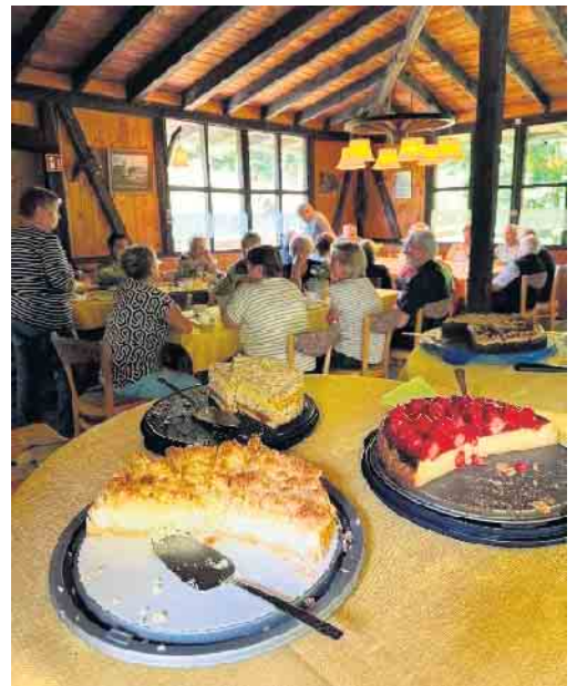
Und natürlich wird im Dorf fleißig gebacken, damit sich die Senioren wohl fühlen.

Wunsch ernst genommen wird.“ sind beispielhafte Rückmeldungen. Für die Termine wird auch ein Fahrservice angeboten, damit auch Seniorinnen und Senioren teilnehmen