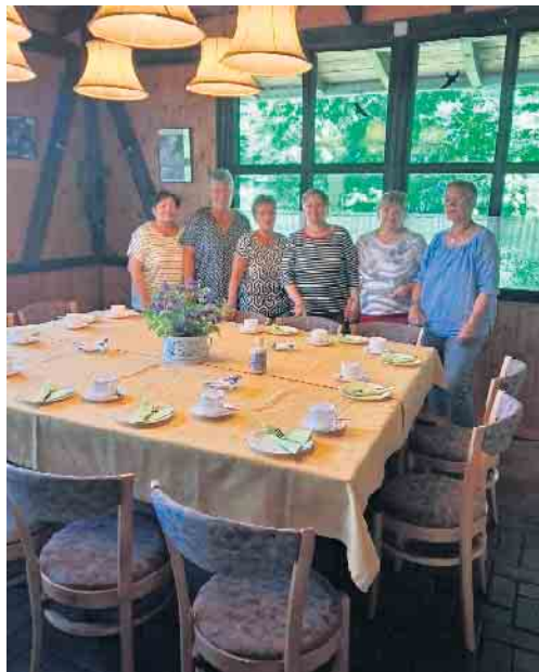
Viele helfende Hände im Hintergrund sorgen für einen reibungslosen Ablauf beim Seniorenkaffee.

Das erste Seniorentreffen in diesem Jahr hat viel Anklang gefunden. Seit dem letzten Jahr ist das Angebot ein fester Bestandteil der Veranstaltungen des Bürger- und Gartenfreunde Vereins Sterzenbach und Schneppenhuth. Das engagierte Helferteam bietet Seniorinnen und Senioren eine Möglichkeit in den Austausch zu kommen und die Geselligkeit bei einem Stück Kuchen zu genießen. In diesem Jahr wird es im Dorfhaus Sterzenbach noch zwei weitere Termine in lockerer Atmosphäre geben. Das Seniorenkaffee wird am 16. Juli und 17. September jeweils ab 15 Uhr stattfinden. Die Rückmeldung der Teilnehmenden ist durchweg positiv und spiegelt den Wunsch wieder, neben den traditionellen Festen auch mal in kleiner Runde Gespräche zu führen, sich über Sorgen auszutauschen und den Rückhalt in der dörflichen Gemeinschaft zu finden. „Schön, sich regelmäßig zu sehen“, „Ich bin froh über die aktive Dorfgemeinschaft.“ und „Ich freu mich, dass hier unser