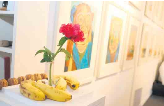
Installation vor den Bildern