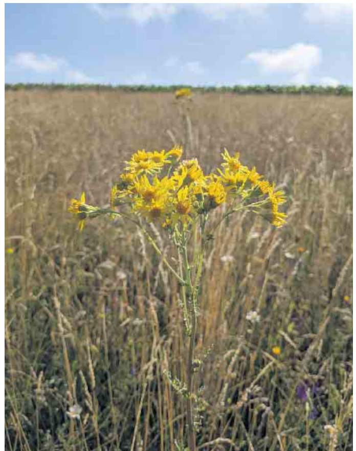
Das Jakobskreuzkraut ist für Nutztiere schädlich.