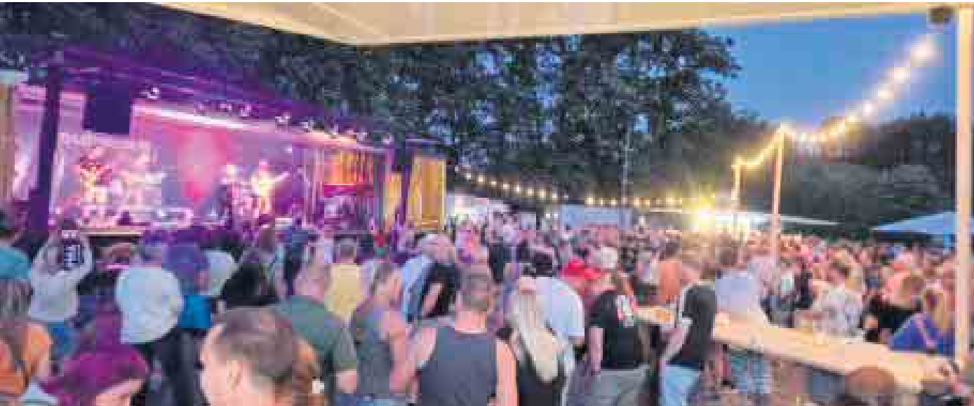
Volles Haus - auch in diesem Jahr werden wieder viele Gäste erwartet.

Am 21. Juni ist es wieder soweit - Wir rocken die Waldbühne