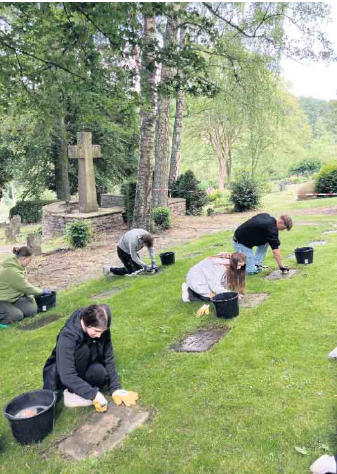
Im letzten Jahr reinigten die Gesamtschüler die Grabplatten auf dem Friedhof in Denklingen.

haus. Der Text auf den Tafeln wurde von Schülerinnen und Schülern der Gesamtschule Reichshof erarbeitet. Von den Überlebenden gibt es wenig Informationen - bis auf einen Auschwitz-Überlebenden, der Dank der Pflege auf dem Burgberg wieder genesen ist und seine Erlebnisse geschildert hat. Das Schicksal der Verstorbenen lässt sich anhand der Namen auf den Gräbern über die Archive teilweise rekonstruieren. Die Ergebnisse der Recherchen werden am 8. Mai 2025 um 19 Uhr im Ratssaal in Denklingen vorgestellt. Das Datum ist bewusst gewählt - es ist der 80. Jahrestag des Endes der Nazi-Barbarei - ein guter Anlass, der Opfer zu gedenken und auch an die Hilfe zu erinnern, die es in Denklingen gab. Die Teilnahme ist kostenlos. Ausreichend Parkplätze stehen am Rathaus und auf dem Dorfplatz zur Verfügung.