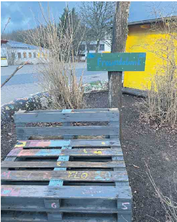
Die „Freundebank“ erhält im Sommer noch einen neuen Anstrich.

zufunktionieren. Fühlt sich ein Kind einsam, kann es sich dort hinsetzen, damit andere Schülerinnen und Schüler darauf aufmerksam werden und entweder dabei helfen, Spielpartnerinnen und Spielpartner zu suchen, oder direkt selbst zum gemeinsamen Spiel einladen. Zuerst schrieb das Kinderparlament einen Brief an alle Klassen, um zu erklären, was es mit der „Freundebank“ auf sich hat. Im Anschluss wurde noch ein wunderschönes Holzschild gestaltet,