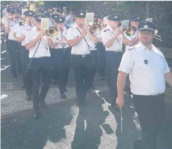
Vor dem Platzkonzert am 30. April um 19 Uhr zieht der Musikzug Bergerhof musizierend durch den Ort

Am Maifeiertag beginnt um 11 Uhr der Frühschoppen nach „Bergerhöfer Art“ . Der Musikzug sorgt mit einem vielfältigen musikalischen Programm für beste Stimmung. Neben klassischen Märschen und Polkas sind auch moderne Medleys und schwungvolle Rhythmen zu hören - für jeden Musikgeschmack ist etwas dabei. Auch das kulinarische Angebot lässt keine Wünsche offen. Besu-