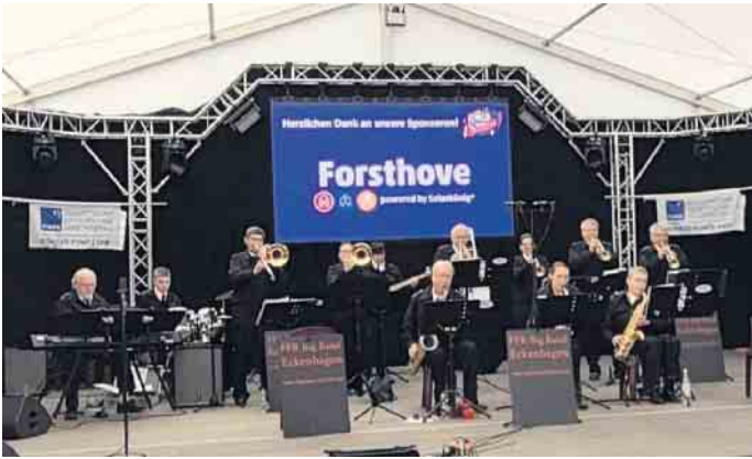
Mit Big Band Eckenhagen spielte beim „Tag der Feuerwehrmusik“ in Sendenhorst.

sucher anschließend ein buntes Programm für Jung und Alt. Im Festzelt präsentierten sich über den Tag hinweg verschiedenste Musikzüge aus ganz NRW - vom Spielmannszug über das Orchester bis hin zur Bigband. Auch NRW-Innenminister Herbert Reul war vor Ort und betonte in seiner Ansprache die wichtige Rolle der Feuerwehrmusik für den gesellschaftlichen Zusammenhalt. Im Anschluss ließ er es sich nicht nehmen, selbst den Taktstock zu schwingen und einen Marsch am Schlagzeug zu begleiten. Am Mittag war es dann Zeit für den großen Auftritt der FFR Bigband Eckenhagen. Die Musikerinnen und Musiker sorgten für völlig neue Klänge im Festzelt. Als einzige Bigband vor Ort - und eine von nur vier Bigbands in der Feuerwehr NRW - boten sie eine erfrischende Abwechslung zum bisherigen Programm. Mit ihrem