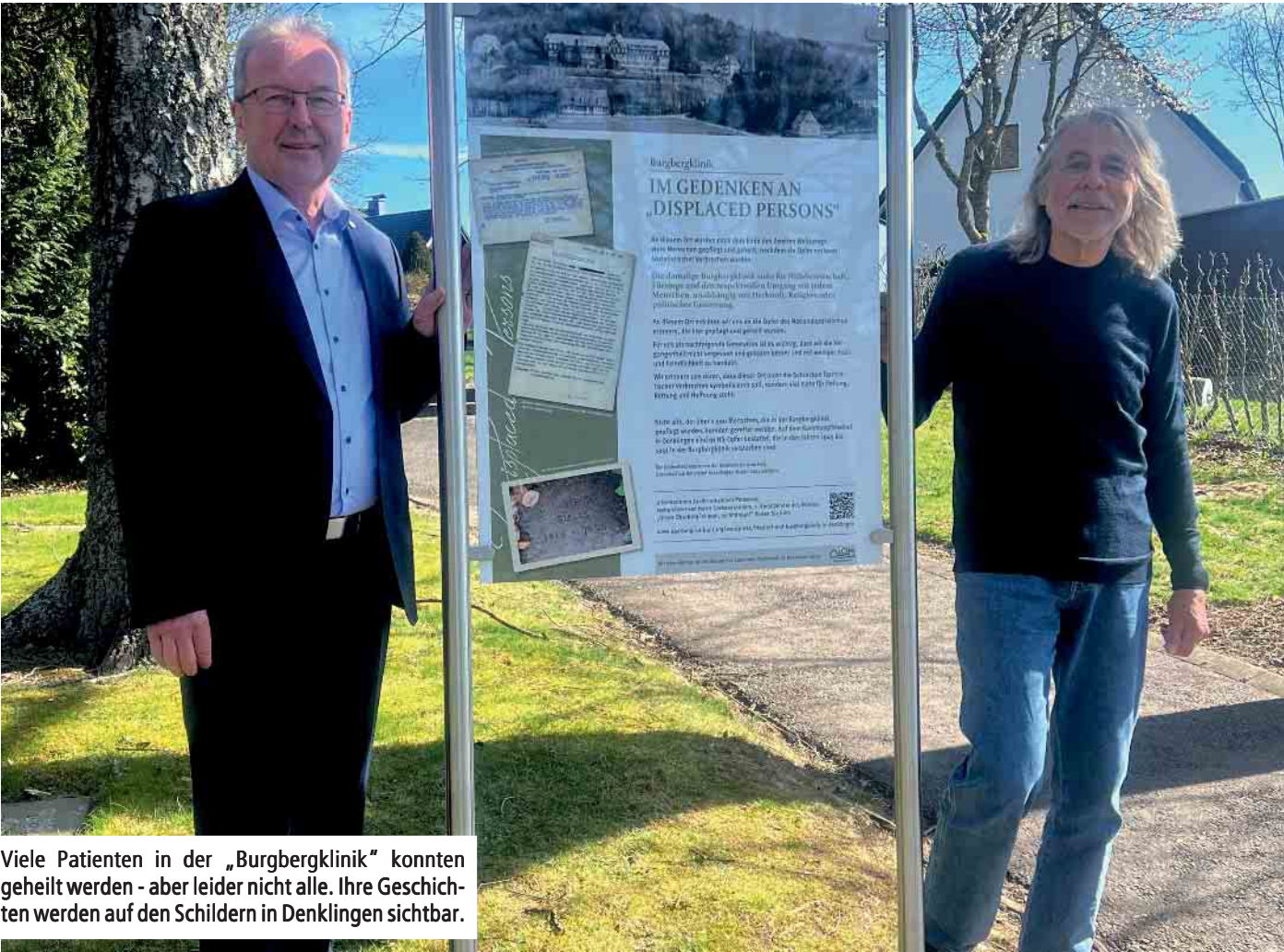
Viele Patienten in der „Burgbergklinik“ konnten geheilt werden - aber leider nicht alle. Ihre Geschichten werden auf den Schildern in Denklingen sichtbar.

49. Jahrgang Freitag, den 25. April 2025 Nummer 8 / Woche 17 Alle 14 Tage in Ihrem Briefkasten