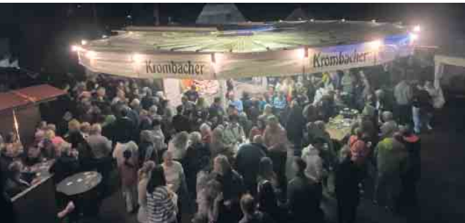
Im Anschluss wird unter der alten Schule gefeiert.

cher können sich auf kühle Getränke, herzhafte Grillspezialitäten, eine Candybar und das beliebte Kuchenbuffet mit frischen Waffeln freuen.