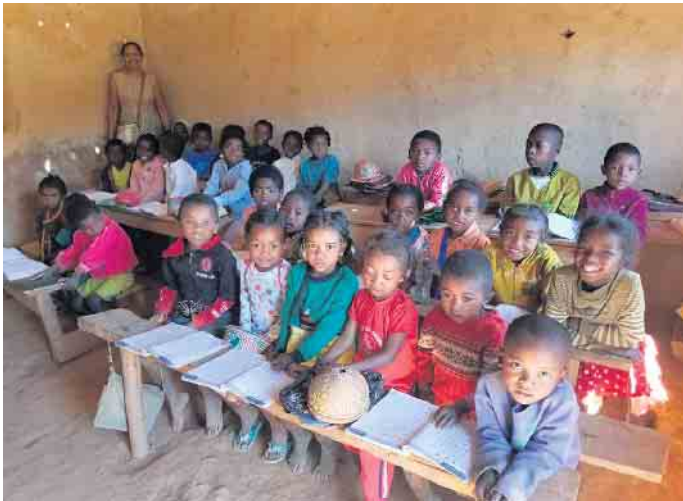
Schulbildung ist keine Selbstverständlichkeit in Madagaskar - dementsprechend sehen auch die Klassenzimmer aus.

Um auf das Spendenprojekt aufmerksam zu machen, haben sich Reichshofer Schülerinnen und Schüler mit Madagaskar beschäftigt - von der Kultur und Sprache bis hin zu den Herausforderungen, mit denen Kinder dort konfrontiert sind. Gemeinsam wurde überlegt, wie man helfen kann, und kreative Ideen wurden entwickelt, um Spenden zu sammeln. Dank vieler großzügiger Menschen konnten wir bei einer Spendenaktion fast 1.500 Euro sammeln. Dieses Geld wird direkt für Schulmaterialien und dringend benötigte Unterstützung an die Partnerschule weitergeleitet. Den Kindern der Eckenhagener Schule lag es am Herzen, den Kindern in Madagaskar nicht nur Geld, sondern auch ein paar schöne und nützliche Dinge zu schicken. Daher hat das Kinderparlament ein großes Pa-