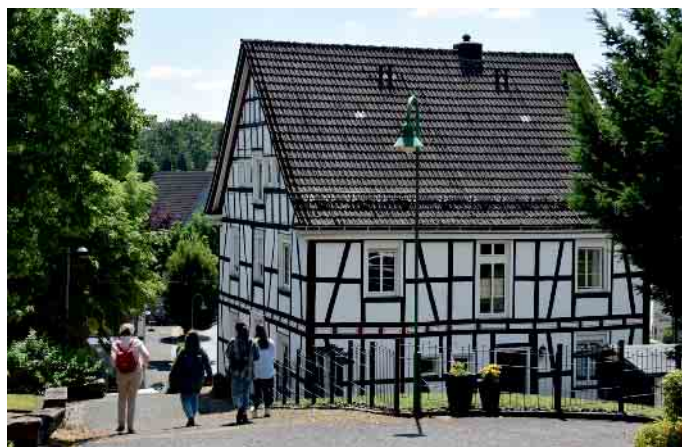
Alleine oder in der Gruppe: die digitalen Räsel Touren machen einfach Spaß

Seither haben über 6.500 Personen an den Touren teilgenommen. In Reichshof begeben sich die Teilnehmenden auf die Spuren eines legendären Münzhändlers. Des-