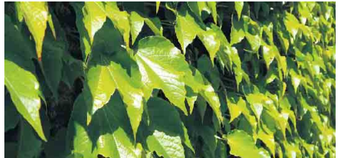
Die klassische Art der Fassadenbegrünung: Wilder Wein wächst an einer Hauswand.

nachweislich viele positive Effekte für Mensch und Umwelt. Wo Pflanzen an der Gebäudehülle wachsen, kann ein angenehmeres Mikroklima im unmittelbaren Gebäudeumfeld entstehen. Die Blätter spenden Schatten und lassen Wasser verdunsten, was die Aufheizung der Fassade reduziert. Insbesondere an heißen Sommertagen kann sich das positiv auf die Innenraumtemperaturen auswirken.