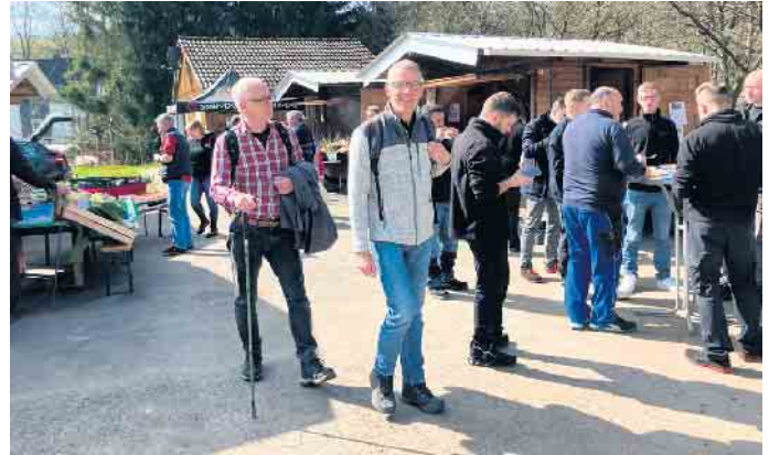
Viele Besucher warteten auf den ersten Markttag in diesem Jahr.

dann werden auch die Kontaktträger nach Italien für Käse und Pasta wieder zum glühen gebracht“, freut sich der Händler. Mittelagger ist froh, auch im 12. Jahr nacheinander einen Frischemarkt zu etablieren. Selbst die schwierigen Jahre der Pandemie, konnten mit viel Einsatz überbrückt werden. Jetzt brauchen sich nur noch die Bewohner des Steinaggertals ein Herz zu nehmen und die persönlichste Form des Einkaufens, direkt vor der Haustüre, wahrzunehmen. Barrierefrei einkaufen und den Hol- und Bringdienst über den vereinseigenen Elektro-Bus nutzen. Einfacher kann einkaufen nicht sein. Die nächsten Dorfmärkte finden am Gründonnerstag, 2. April und am 16. April, ab 9:30 Uhr statt. Dem Dorfmarkt ging ein Aufräumtag voraus. Vieles hatte sich über den Winter angehäuft, das dringend geputzt werden musste. Die Liste gerade auch im Hinblick auf