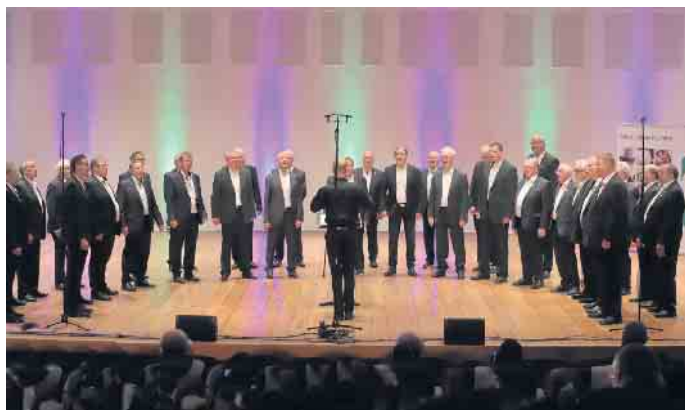
Der musikalische Höhepunkt des Jahres: Das Leistungssingen in Dortmund.

Bei der Programmgestaltung für das Jahr richtet sich bei der Chorgemeinschaft alles nach dem