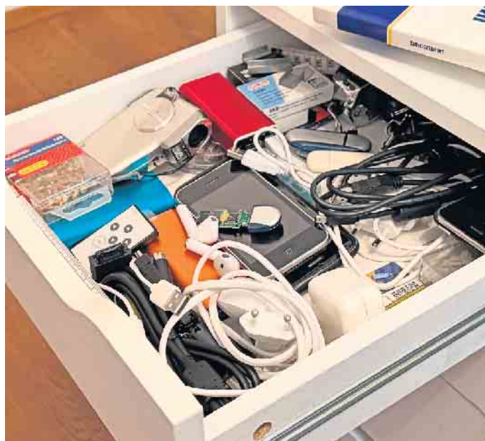
Oft sammeln sich in unseren Schubladen kleine „Technik-Friedhöfe“ an. Sie enthalten wertvolle Rohstoffe, die sich zurückgewinnen und wiederverwerten lassen.

tischer Blick in Schränke und Kisten: Wird das alte Handy wirklich noch gebraucht? Hat der MP3-Player aus Studienzeiten einen praktischen Nutzen - oder liegt er seit Jahren unberührt herum? Natürlich dürfen besondere Erinnerungsstücke bleiben. Doch viele Geräte haben ihren Zweck längst erfüllt. Kommunale Wertstoffhöfe, Recyclinghöfe oder spezielle Rücknahmesysteme des Handels nehmen ausgediente Elektronikgeräte kostenlos an und sorgen für die fachgerechte Verwertung. Wichtiger Tipp: persönliche Daten löschen oder das Gerät auf Werkseinstellungen zurücksetzen. So wird aus verstaubter Technik wieder ein wertvoller Rohstofflieferant. Ein Frühjahrs- oder Herbstputz bietet die Chance, verborgene Ressourcen zu aktivieren - und zu Hause Platz für Neues zu schaffen. (DJD)