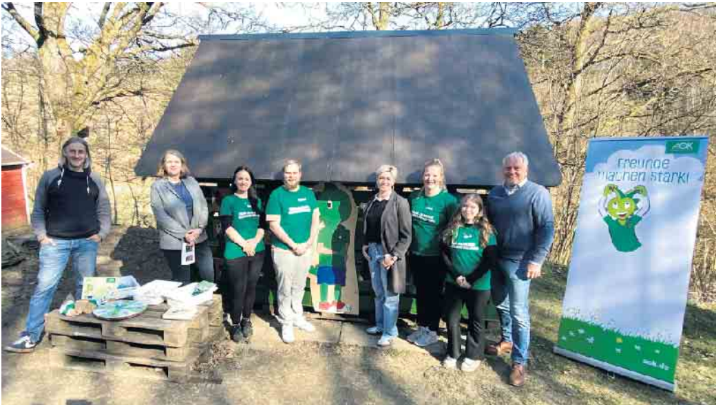
Der „Tobe-Dschungel“ wurde eingeweiht.

neugieriges, empathisches und gesundheitsbewusstes Drachenkind, das voller Ideen steckt. So gelingt eine leichte Identifikation. Ziel ist es, die Kinder für das Thema Gesundheit zu begeistern und hier an dieser Stelle einen Grundstein zu legen. Anfang des Jahres, als die Kinder des Kinderparlaments sich dafür aussprachen, doch einen Jolinchen-Spielplatz zu bauen, waren wir dann in der glücklichen Lage, von der Projektgruppe ausgewählt zu werden. Mit herausragendem Engagement wurden zunächst mit der Plattform „gofundme“ Spendengelder gesammelt. Die AOK, mit unserer Sachbearbeiterin Joanna Schrey, war ebenfalls von Anfang an involviert und hatte prompt ihre Unterstützung zugesichert. In Eigenleistung wurde dann sehr motiviert organisiert und auf Hoch-