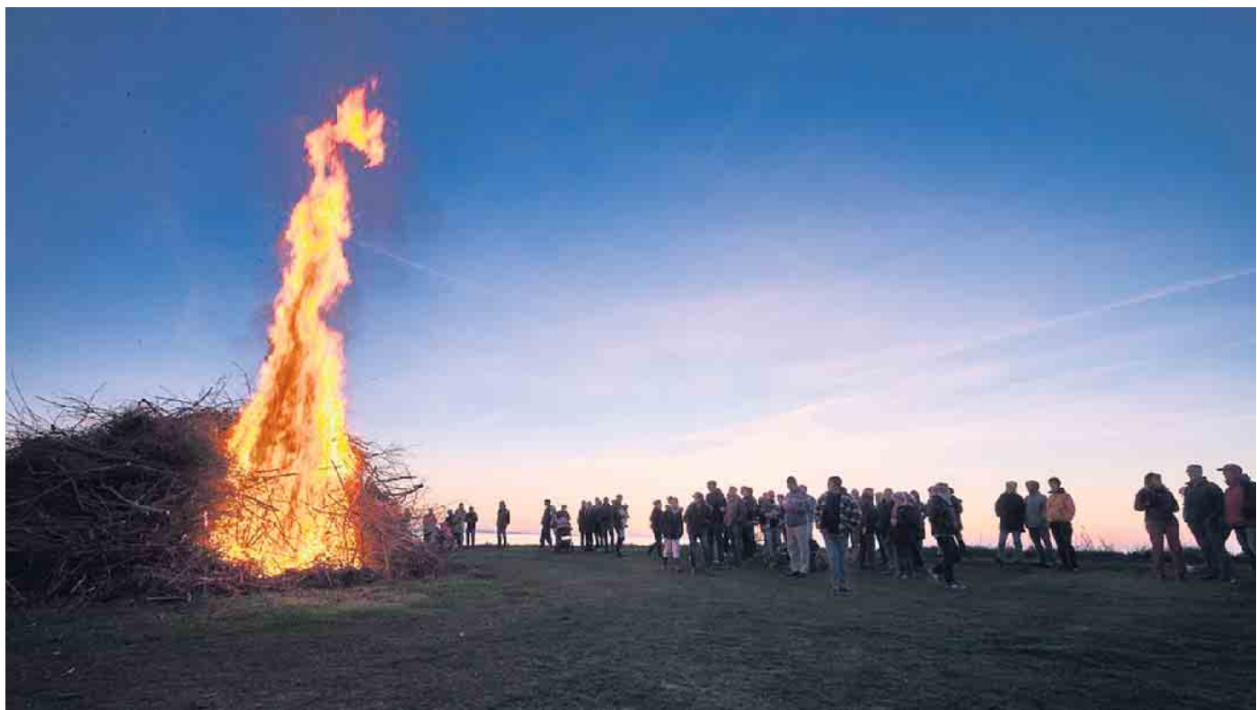
An zahlreichen Orten versammeln sich Reichshoferinnen und Reichshofer an den Osterfeuern. Eine Auflistung finden Sie im Innenteil.