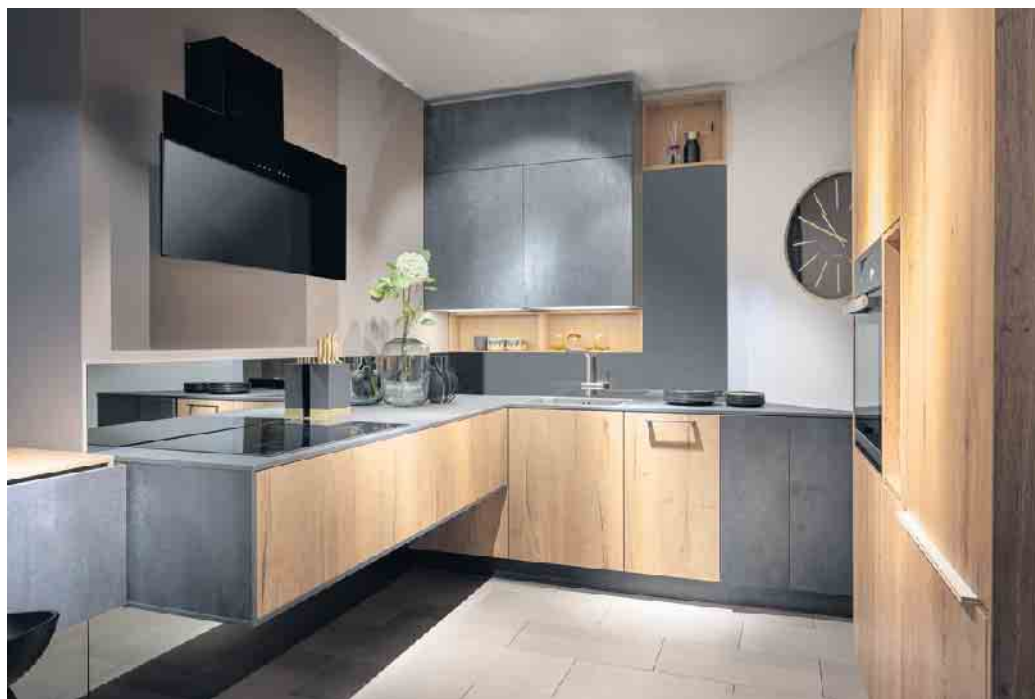
Viel Raum zum Verstauen bietet diese kleinere Lifestyle-Küche in trendiger Spachtelbeton-Optik kombiniert mit Alteiche (Dekor). Durch die raffinierte Planung entsteht eine Atmosphäre von Weite und Großzügigkeit.

Komfort an diesen Spülen noch steigern. Abgerundet wird das Ganze dann noch mit einem Abfallsammler, der am besten direkt unter der Spüle eingebaut wird. (AMK)