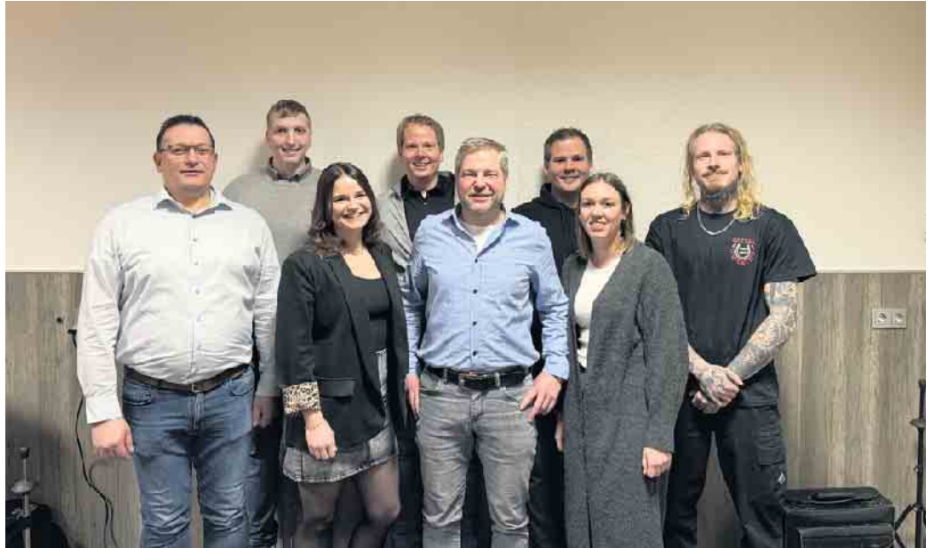
Der Vorstand des Musikzuges Bergerhof.

In seinem Jahresrückblick bedankte sich Hochhard bei allen aktiven Musikerinnen und Musikern sowie den zahlreichen Helferinnen und Helfern, die den Musikzug tatkräftig unterstützt haben. Besonders hervorgehoben wurde die Musiknacht im November, die erneut ausverkauft war und als musikalisches Highlight des Vereinsjahres gilt. Mit 44 offiziellen Auftrittstagen zeigte sich der Terminkalender prall gefüllt - zur Freude der Veranstalter, die durchweg zufrieden mit den Leistungen des Musikzugs waren.