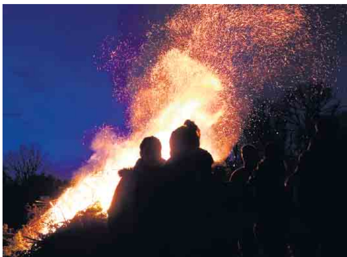
Osterfeuer in der „Blauen Stunde“

aufblühenden Flammen, die aus einem riesigen Berg aus Abfallholz in den tiefblauen Abendhimmel schossen. Für dieses beeindruckende Ereignis hatte