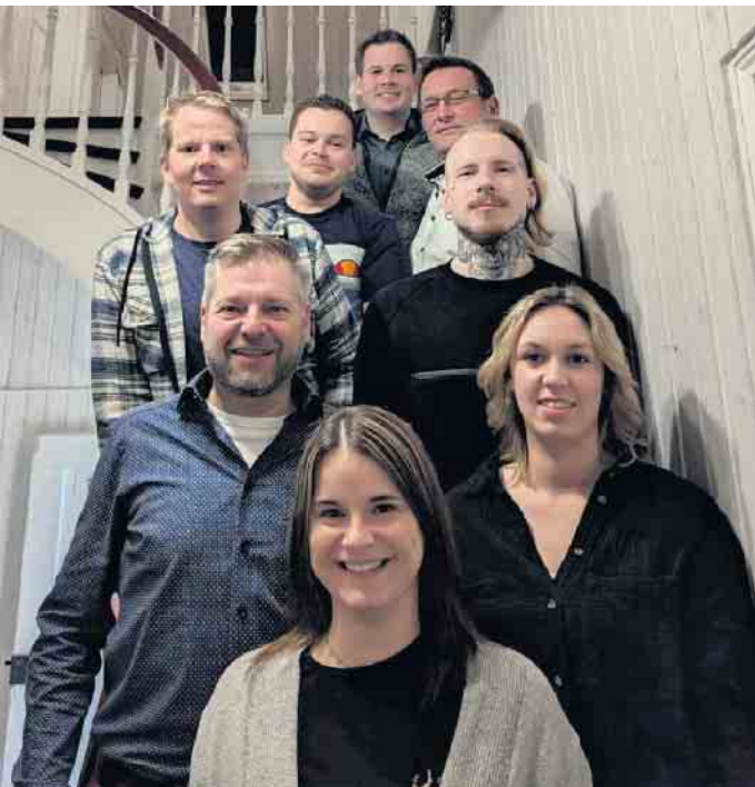
Der Vorstand des Musikzuges Bergerhof.