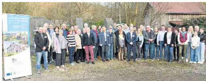
18 Dorfgemeinschaften freuen sich über die bewilligten Fördergelder des Oberbergischen Kreises, mit denen sie ihre insgesamt 24 Projekte jetzt umsetzen können.

„Der Oberbergische Kreis setzt sich auf vielfältige Weise für eine