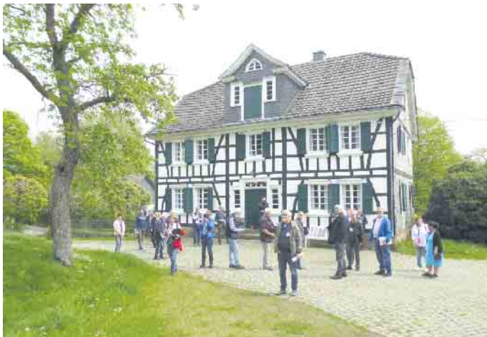
Der Dorf Wettbewerb startet im Sommer: anmelden kann man sich aber schon jetzt.

Der Wettbewerb bietet Dorfgemeinschaften die Chance, weitere Aktivitäten im Dorf anzustoßen und voranzubringen. Zusätzlich gibt es Preisgelder bis zu 1.000 Euro zu gewinnen. Die Geldpreise werden mit Unterstützung der im Oberbergischen Kreis ansässigen Sparkassen zur Verfügung gestellt. Außerdem werden drei Sonderpreise mit jeweils 1.000 Euro vom Oberbergischen Kreis vergeben. Im Wettbewerb werden Ideen und innovative Vorhaben prämiert, die