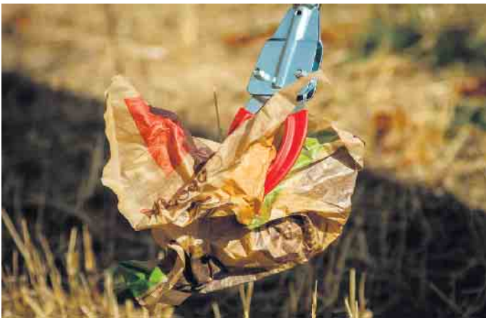
Müll liegt leider überall rum.

Die BAV Abfallberatung wird im Rahmen dieses Aktionstages mit Informationsständen in die Kommunen kommen und wochentags mit ihrem Beratungsangebot für Bürgerinnen und Bürger ansprechbar sein. Sollten Sie hier bereits favorisierte Tage mit