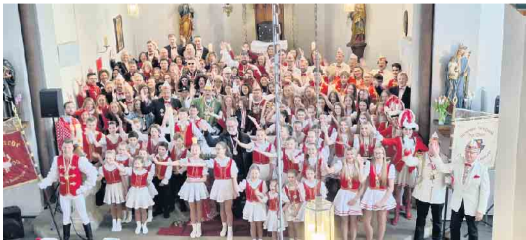
Nach einer fröhlichen Messe zeigten sich alle Beteiligten dem Fotografen.