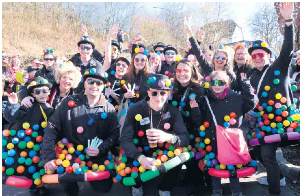
Die „Froschköpfe“ baden in bunten Bällen.