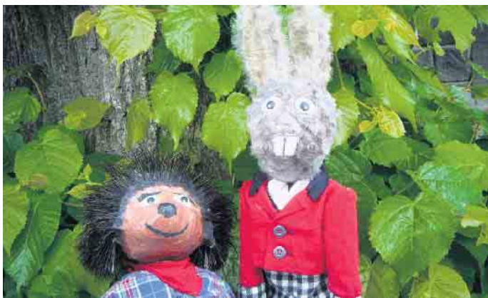
Die Geschichte vom Wettrennen von Hase und Igel wird am 5. April erzählt.

bekannten Märchen basiert, erzählt von einem spannenden Wettrennen zwischen einem schnellen Hasen und einem schlauen Igel. Mit liebevoll gestalteten Handpuppen und einer humorvollen Inszenierung verspricht das Stück großen Spaß für die ganze Familie. Die Veranstaltung richtet sich an alle Altersgruppen und bietet den kleinen und großen Zuschauern eine unterhaltsame und lehrreiche Darbietung. In einer Mischung aus Humor und Spannung lernen die Kinder auf spielerische Weise Werte wie Fairness und Ausdauer.