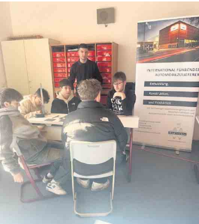
Ganz nah am Berufsbild waren die Neuntklässler.