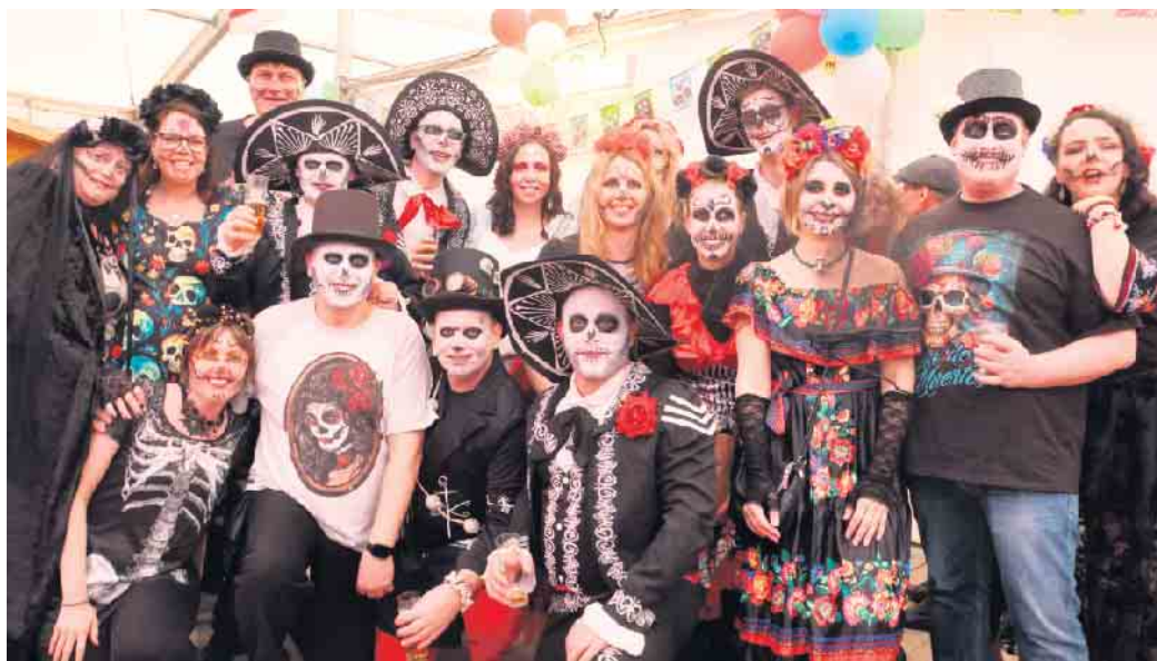
Kostümierte Gruppe auf der Prunksitzung

Einen gigantischen Auftritt lieferten die Paveier mit ihrem Hit „Wo bist du, Amore“, bei „Leev Ma-