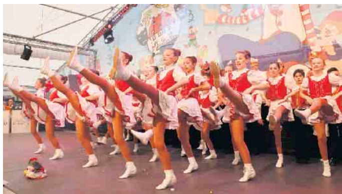
Tanz der „Pänz von der Burg“