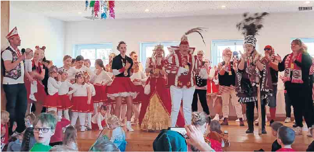
„Volles Haus“ beim Kinderkarneval in Eckenhagen

nerinnen-Team ganz besonders, da sie die drei Tanzgruppen bestens anleiten.