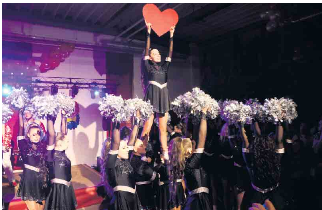
Auftritt der „Raketen“ vom VfR Marienhagen