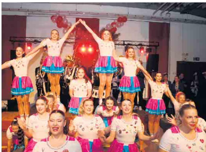
Große Garde der KG Tolle Elf Wildberg mit ihrem Showtanz „Sweet Candy“