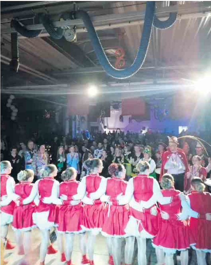
„Volles Haus“ im Gürzenich von Eckenhagen

05.02. – 17.03.2024: Jetzt 4 Wochen gratis testen und bis zu 120 Euro Preisvorteil sichern!*