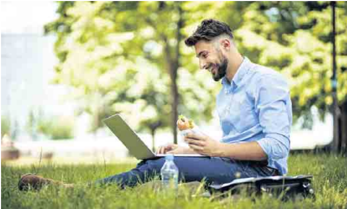
Bei jüngeren Mitarbeitern mit hoher digitaler Affinität hat vor allem das mobile Arbeiten stark an Beliebtheit gewonnen.

Auch im mobilen Office muss ein gewisser Gesundheitsstandard eingehalten werden. „Der Arbeitnehmer darf auch hier weder physischen noch psychischen Gefahren ausgesetzt werden“, so Frank Preidel. Doch dies zu gewährleisten sei nicht immer leicht - etwa wenn das Office auf die Wiese im Park verlegt wurde. (djd)