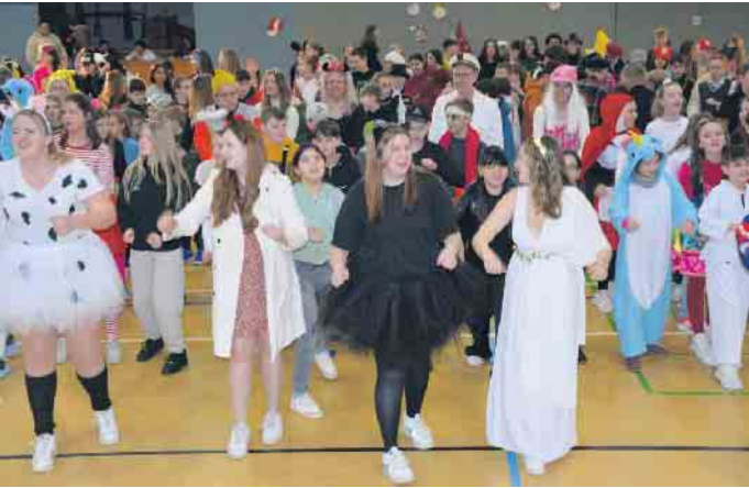
Bunt und froh gelaunt waren die Jahrgänge 5 - 7 dabei.