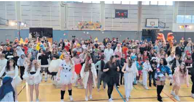
Beim gemeinsamen Tanz hatten Lehrer und Schüler viel Spaß.