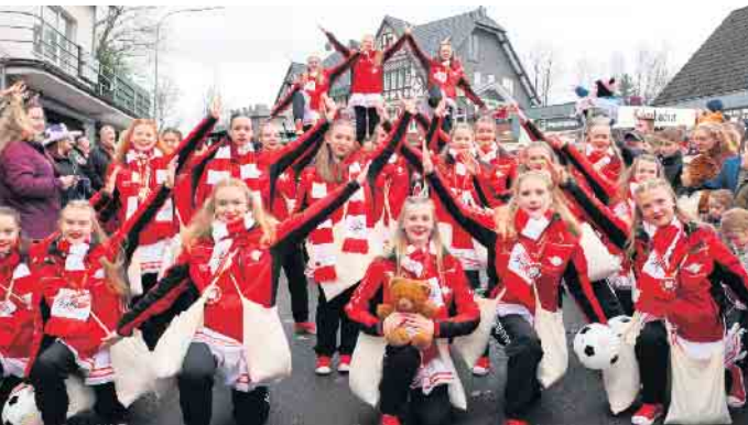
Tolle Formationskunst bei den „Pänz von der Burg“