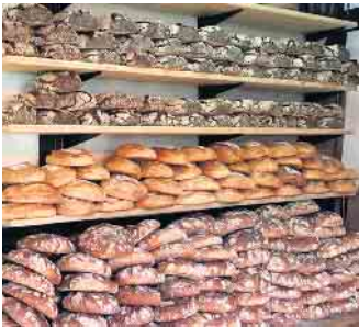
Sieben verschiedene Brotsorten sind beim Backesfest am 16. und 17. März im Angebot.

An beiden Tagen beginnt das Fest jeweils um 11 Uhr. Parkplätze stehen in ausreichender Zahl am Ortseingang und in der Ortsmitte zur Verfügung.