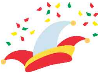
Eigene Kräfte sorgten mit Kreativität für ausgelassene Stimmung

Die Luft stand im Eckenhääner Gürzenich, als die KPG mit ihren Eigengewächsen und mit einem eigenen Programm die Sessions-party unter dem Motto „Bei der KPG läuten die Silberglocken, das werden wir so richtig rocken“ feierten. Anlass war kein geringerer als das 25-jährigen Bestehen der kleinen, aber feinen Karnevalsgesellschaft. Viele Nachbarvereine waren der Einladung nach Eckenhagen gefolgt und sorgten für eine ausgelassene Stimmung. Das Orgateam der KPG freute sich über den gelungenen Abend und grüßt mit einem dreimal von Herzen kommendem Eckenhagen o jor jor jor.