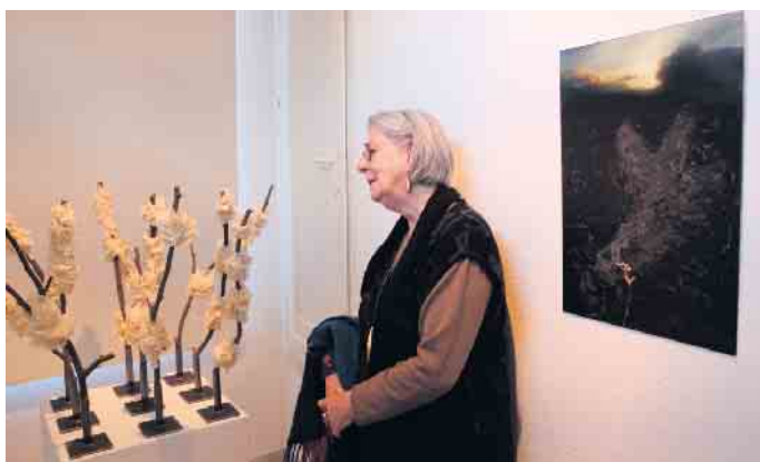
Die Vernissage war sehr gut besucht