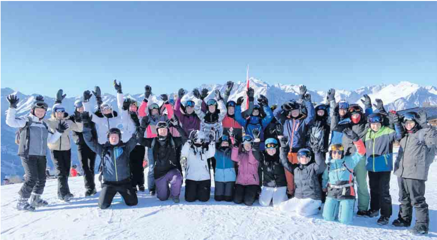
Die Schulschifahrt war auch im 25. Jahr ein voller Erfolg.

Gesamtschule Reichshof zum 25. Mal auf Schulschifahrt