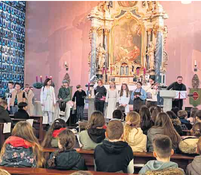
Die Kreativklasse 5 f zeigte im Gottesdienst ein Krippenspiel.