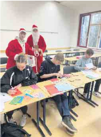
In vielen Klassen und jahrgangsübergreifend wurden liebevolle Briefe geschrieben.

jekt teilnahmen. Daran beteiligt waren letztlich etliche Klassen/Kurse, die durch die Unterstützung und den Ansporn ihrer Tutorinnen und Tutoren eine fantastische Anzahl von insgesamt 235 Briefen zusammenbrachten. Diese wurden an verschiedene Senioren- und Pflegeheime in der Region Reichshof versendet. Einen großen Dank richten die Schülerinnen und Schüler des Religionskurses der Q1 an all diejenigen, die sich dazu entschlossen haben, eine gute Weihnachtstat zu vollbringen. Damit bekommen sie das wohl beste Geschenk, das man bekommen kann: das Gefühl, etwas bewirken und verändern zu können. Denn all jene Menschen, die die Karten und selbstgedichteten Briefe der Kinder und Jugendlichen aus unterschiedlichsten Altersgruppen bekommen, erhal-