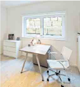
Kellerräume müssen täglich gelüftet werden - dabei gibt es manches zu beachten.

So bekommen Bauherren hohe Luftfeuchtigkeit im Keller gut in den Griff