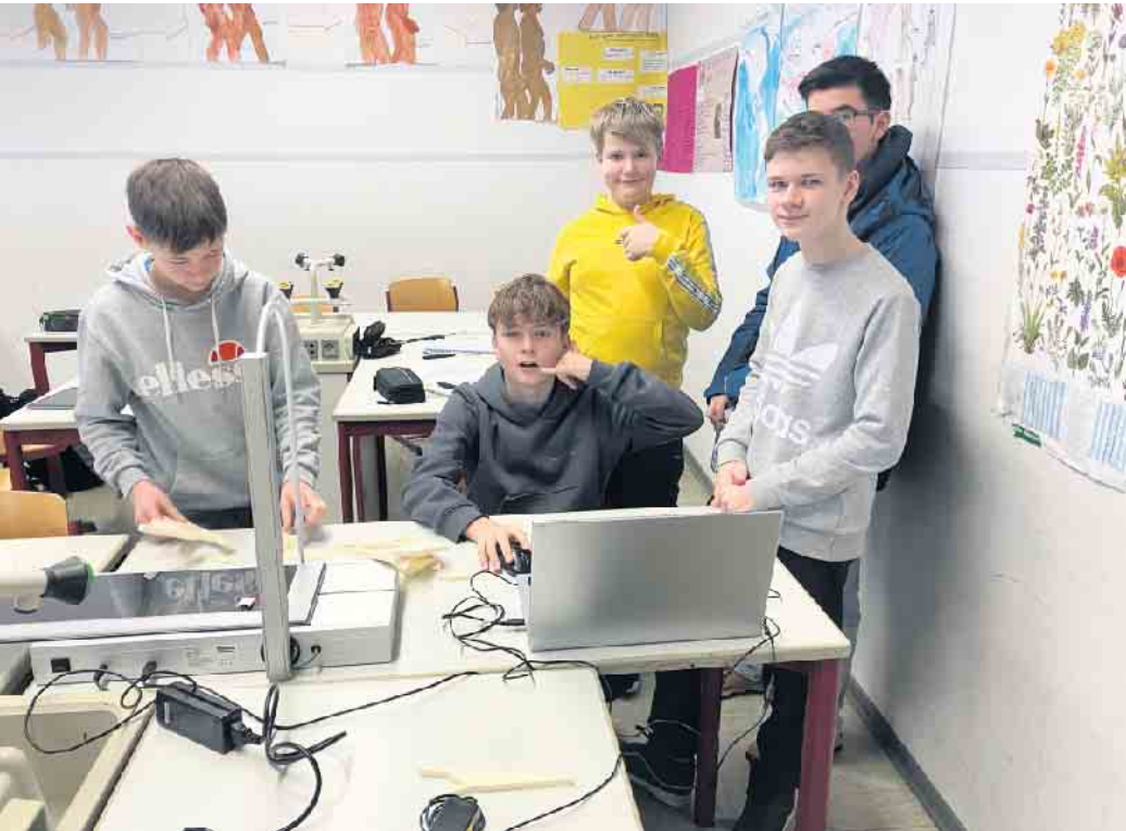
Am Workshop waren alle mit Begeisterung dabei.