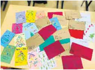
235 Briefe wurden an die Bewohner der Reichshofer Einrichtungen verschickt.

In Anbetracht des sich nahenden Weihnachtsfestes sowie des Jahresendes hatte sich der Kurs Katholische Religion der Q1 mit ihrer Lehrerin ein besonderes Projekt überlegt. Um älteren Menschen bzw. Menschen, die zu einer solch schönen Zeit alleine sind, glücklich zu machen, haben sie sich gemeinsam dazu entschlossen, etwas Gutes zu tun.