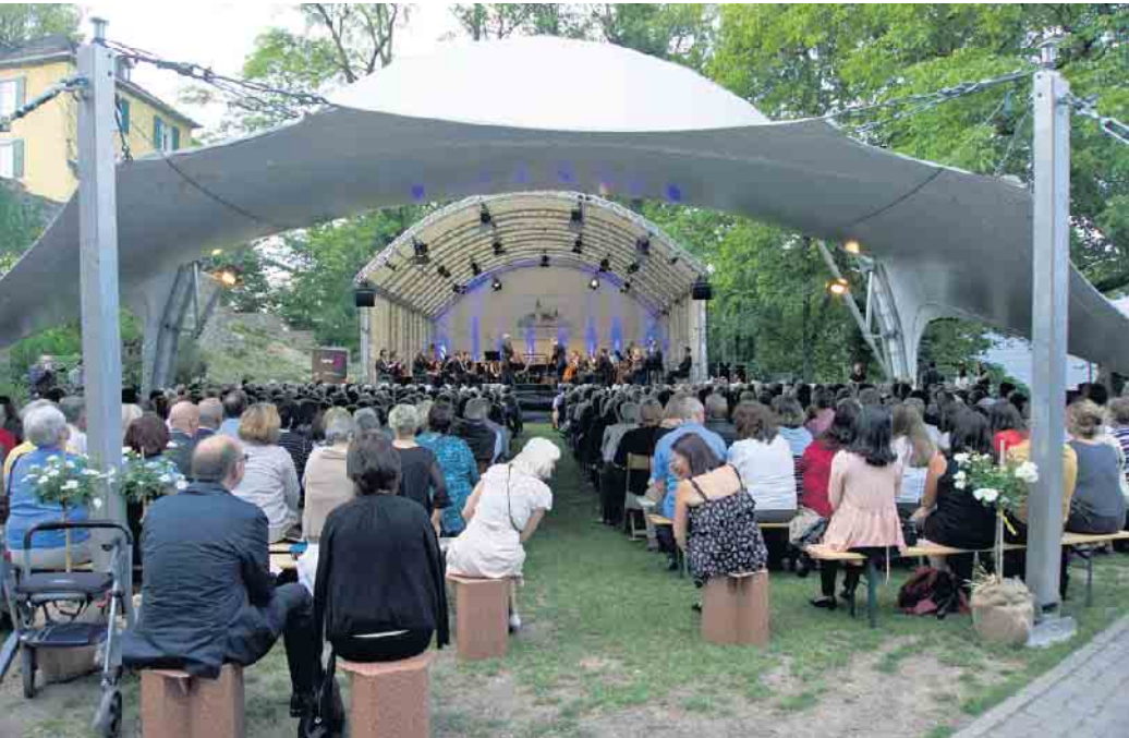
Zum 20. Mal findet das Klassik-Open-Air auf Schloss Homburg statt.

Es ist das Klassik-Festival im Oberbergischen Kreis und steht für hochkarätigen Musikgenuss. Vor der historischen Kulisse von Schloss Homburg findet im nächsten Sommer zum bereits 20. Mal das Open-Air-Konzert statt. Im Jubiläumsjahr präsentiert die Veranstaltergemeinschaft ein be-