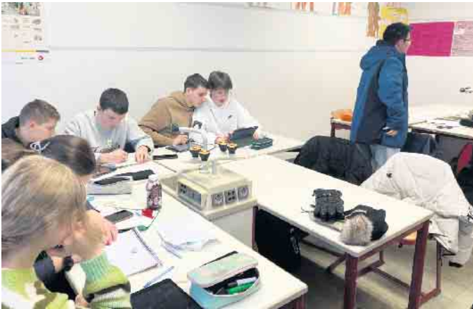
In Gruppen wurden die Projekte entwickelt.