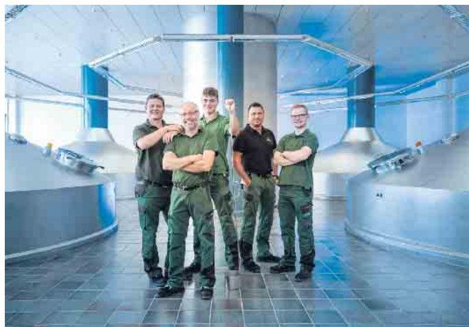
Ein traditionsreicher Beruf setzt heute auf fortschrittliche Technik: Das macht den Reiz der Tätigkeit des Brauers und Mälzers aus.

nannt, war bis vor wenigen Jahrzehnten für die Herstellung, Reinigung und Reparatur der damals üblichen Holzfässer verantwortlich. Besonders das sogenannte Pichen war nicht ungefährlich. Um die Poren und Fugen des Holzes zu schließen und ein Entweichen der Kohlensäure zu verhindern, aber auch um im Fassinneren eine geschmackliche Veränderung durch den Kontakt zwischen Bier und Holz zu vermeiden, mussten Küfer die Holzfässer mit flüssigem und extrem heißem Pech auskleiden. War die dünne Schicht beschädigt, musste mühsam eine neue aufgetragen werden. (djd)