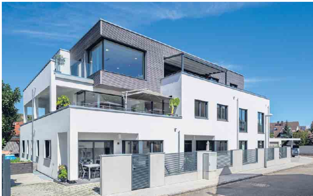
Mehrgenerationenhäuser in Holz-Fertigbauweise sind im Kommen.

Das Mehrgenerationenwohnen unter einem Dach kehrt zurück: Nach Jahrzehnten mit immer mehr Singlewohnungen, zunehmender Urbanisierung und Individualisierung planen wieder mehr private Bauherren ein Eigenheim am Stadtrand oder im Grünen als