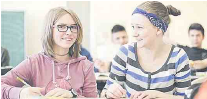
Egal ob schulische oder duale Ausbildung - Unterricht im Klassenzimmer gehört dazu.

Schulisch oder dual - was darf es denn sein?