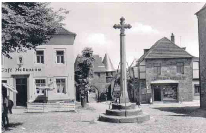
Marktkreuz auf dem Marktplatz

Handelsverkehrs und die Sicherheit der Wege (Marktfrieden). Wochenmärkte hat es in Nideggen wohl nie gegeben, da die Kaufkraft der wenigen Einwohner (300 bis 400), des Umlandes und des schwachen Gewerbes dafür nicht ausreichte. Zudem war die Hanglage des Platzes nicht optimal. Als Zeichen für das Marktrecht, aber auch als Symbol für die Machtstellung des Herzoges, wurde als zentrale Stelle auf dem Marktplatz das gotische Marktkreuz errichtet: Auf einem Sockel steht eine Säule aus heimischem Buntsandstein, die das Kreuz trägt. Es handelt sich hierbei nicht um ein christliches Symbol. Schon früh wurde eine Marktordnung erlassen, die das Tragen von Waffen und das Verunreinigen des Platzes, der schon gepflastert war, verbot. Auch wurden die Preise und Gewichte der