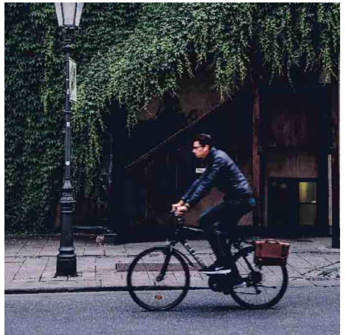
Volle Dröhnung: Auf keinen Fall darf man mit aufgesetzten Kopfhörern und hoher Lautstärke am Straßenverkehr teilnehmen.

Die Gesellschaft für Technische Überwachung (GTÜ) mahnt vor diesem Hintergrund zum eigenverantwortlichen und sicherheits-