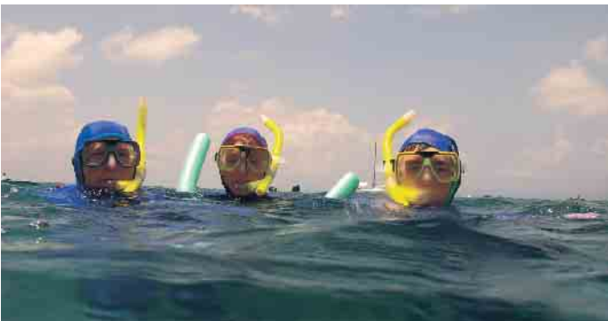
Mitmachen können beim Schnorchelabzeichen kleine und große Schwimmer. Foto: pixabay.com/akz-o

fend allen Mitgliedsverbänden im BFS zur Verfügung. Abzeichen und Urkunden können seit 1. Januar auch direkt über den BDS e.V. (Bundesverband deutscher Schwimmmeister e.V.) angefordert werden. (akz-o)