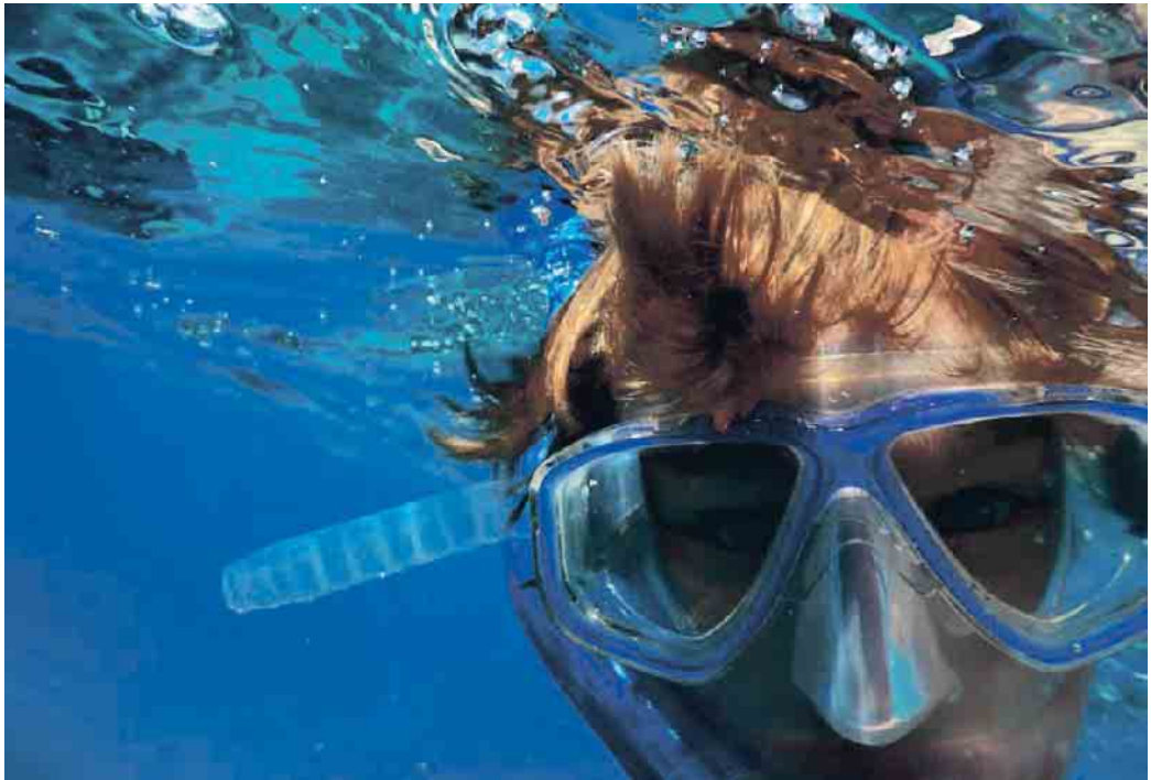
Für den Bereich Schnorcheln liefern die neuen Abzeichen erstmals eine solide Grundausbildung unter Wasser.

Mitmachen können alle Schwimmer, kleine und große (Schwimmabzeichen Bronze/„Freischwimmer“). „Die Abzeichen werden für Kinder, Jugendliche und auch Erwachsene gleichermaßen attraktiv sein“, ist Helmut Stöhr sicher. „Alter und Geschwindigkeit spielen bei den Schnorchelabzeichen keine Rolle“, fasst Tina Hellenkamp, die zwei Jahre lang die BFS-Arbeitsgruppe leitete, zusammen. „Wir bereichern die zertifizierte Ausbildung im Wasser im bekannten Dreiklang und