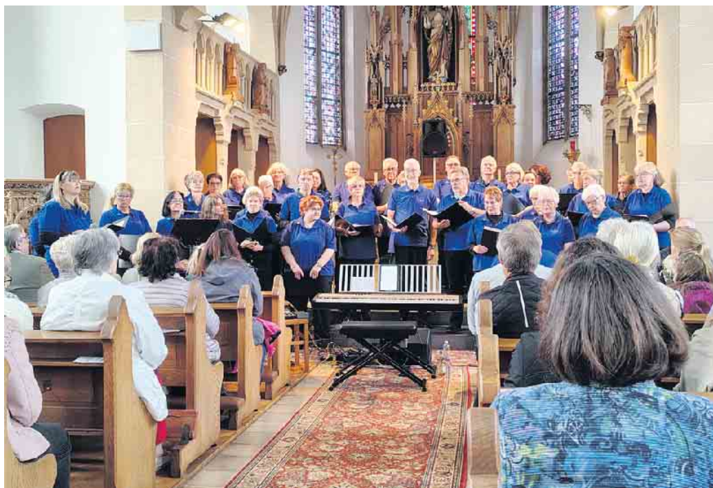
Abschlusskonzert am 28. September