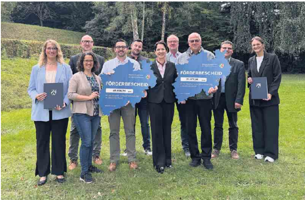
Landwirtschaftsministerin Silke Gorißen (Mitte) überreichte im Schleidener Rathaus Vertretern der Dorfgemeinschaft Mauel e.V. und Vertretern des SV Schöneseeff 1950 e.V. Förderbescheide mit einer Gesamtsumme von rund 67.000 Euro.

Durch 17 Millionen Euro Landes- und Bundesmittel werden Gesamtinvestitionen in Höhe von 32 Millionen Euro angestoßen. Insgesamt 141 Projekte können von Land und Bund gefördert werden. Die Auswahl der Fördermaßnahmen erfolgte nach landesweit einheitlichen Projektauswahlkriterien im Rahmen der verfügbaren Haushaltsmittel. Die vielfältigen geförderten Projekte umfassen modernisierte Dorfgemeinschaftshäuser, neugestaltete Dorfplätze als Begegnungsräume für Jung und Alt, Dorfläden, Multifunktionshäuser oder Kleinspielfelder. Die Vielfalt der Fördermaßnahmen spiegelt insgesamt auch Entwicklungspotentiale und Bedarfe der ländlichen Räume wider. So nehmen die Förderung von dörflichen Infrastrukturen sowie Projekte der Daseinsvorsorge weiterhin einen wichtigen Platz auf der Liste der Maßnahmen ein. Mindestens 90 Prozent der Fördersumme wird für Projekte aufgewendet, die der Dorfgemeinschaft und dem gesellschaftlichen Zusammenleben zugutekommt.