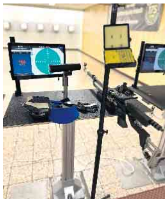
moderner digitaler Schießstand

Liebe Bürgerinnen und Bürger, liebe Kinder, liebe Ortsvereine, wir laden euch herzlich ein zur diesjährigen Schießsportwoche, die vom 6. bis 9. Oktober jeweils von 18:30 bis 21 Uhr in unserer Schützenhalle stattfindet. Egal ob jung oder alt, Anfänger oder geübte Schützen - jeder kann