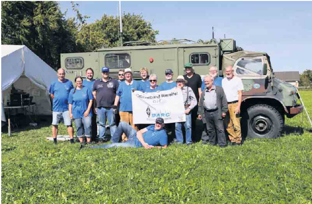
Eine starke Gemeinschaft, der DARC-Ortsverband G26 Rureifel in Aktion.

Der Feldtag der Funkamateure des DARC-Ortsverbandes G26 Rureifel war wieder ein großer Erfolg