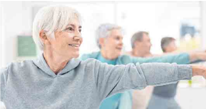
Heilung und Prophylaxe durch Myokine

Der gemeinnützige Verein RehaSport-Nideggen bietet zahlreiche dieser Kurse für die gesamte Rureifel an. Die Trainingsstätte des Vereins befindet sich in Nideggen im Gewerbegebiet, direkt über dem REWE-Markt in den Räumen des ortsansässigen Fitnessclubs. Die Trainingskurse beinhalten ein Gymnastikprogramm, welches in der Gruppe durchgeführt wird. Meistens findet es einmal wöchentlich für 45 Minuten statt.