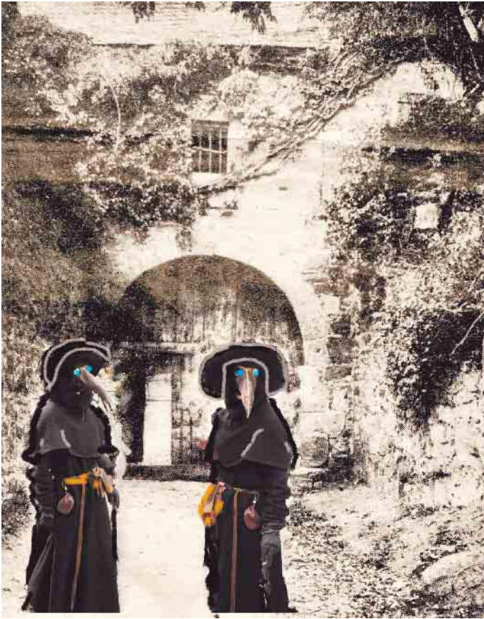
Burg Nideggen, Burghof-Tor, Collage

Der Herzog nahm diese Worte sehr ernst, ließ den Sänger bewirten und rüstete zu einer großen Jagd, um Küche und Keller zu füllen. Diese war so erfolgreich, dass Speise- und Räucherammern der Burg prall gefüllt waren. Wie es der Sänger vorausgesagt hatte, näherte sich die Pest, alles verschlingend, in grausamer Eile, konnte aber den Bewohnern der Burg nichts anhaben, da diese so weise vorgesorgt hatten, dass das Burgtor nicht geöffnet zu werden