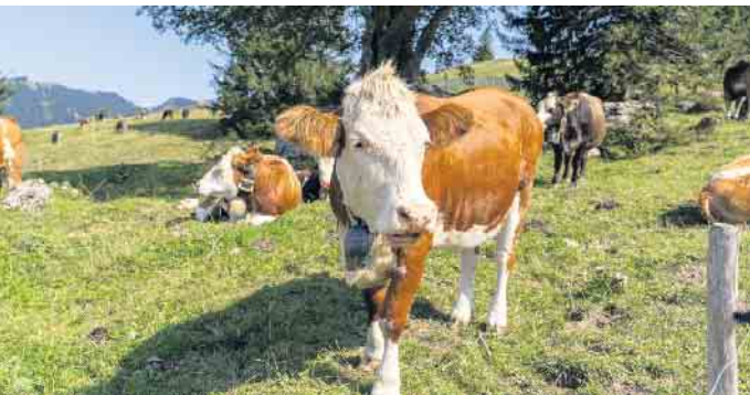
BioWochen NRW bis 14. September

teaktionen, Führungen und Verkostungen. Diese Aktion bietet die perfekte Gelegenheit, regionale und ökologisch erzeugte Produkte direkt zu probieren und mehr über ihre Herstellung zu erfahren. Regionale Küche entdecken Von deftigen Klassikern wie „Himmel und Äd“ oder Reibekuchen im Rheinland bis hin zu rustikalen Spezialitäten wie der Kottenbutter im Bergischen Land: Nord-