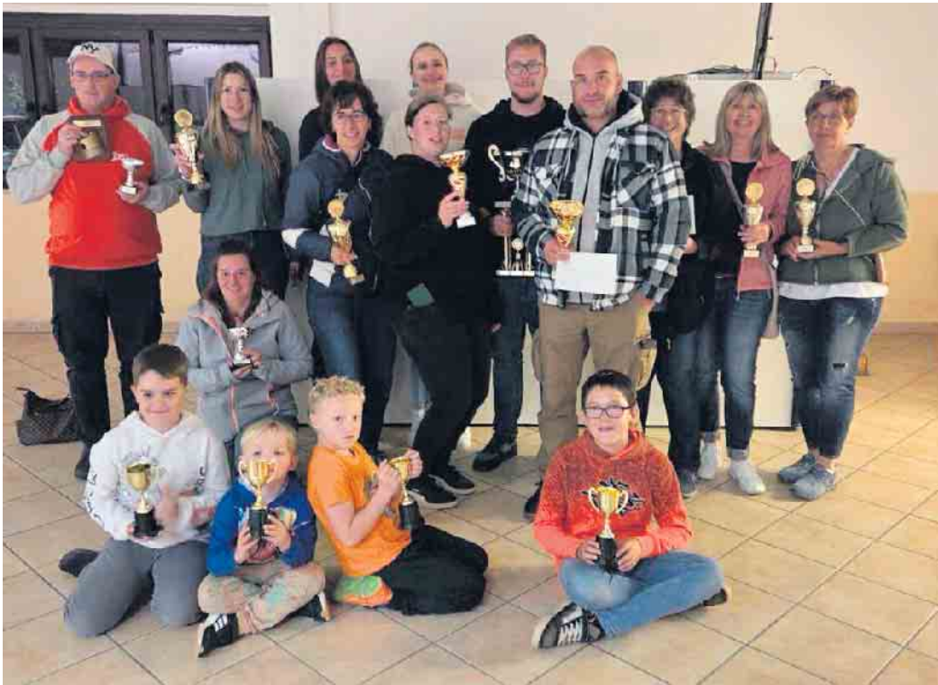
Gute Resonanz garantiert Fortführung: 18. große Orientierungsfahrt des 1. FC Köln Fan-Clubs Neffeltal 98

Am 23. August gingen elf Fahrzeuge mit insgesamt 38 Insassen in Gladbach an den Start, um die vom Fan-Club ausgearbeitete Strecke über 23,5 Kilometer und einer geplanten Fahrtzeit von circa vier Stunden zu meistern. Die Teams erhielten Unterlagen mit 23 Fragen, die während der Fahrt bewältigt werden mussten. Die Antworten fanden sich rechts und links vom Straßenrand. Zudem gab es fünf Zwischenfragen aus dem Bereich des Fanclubs. Außerdem hatte das FC-Team auf der rechten Straßenseite Sichtkontrollen (Symbol-Schilder) aufgehängt und -gestellt, die bei Sichtung in die Bordkarte eingetragen werden mussten. Gleiches galt für 20 Fotos, deren Kopien alle Teilnehmer vor der Fahrt in Farbe erhielten. Des Weiteren galt es eine Durchgangskontrolle zu durchlaufen, bei der es eine neue Fahrweisung und eine neue Bordkarte gab. Als kleine Sonderaufgabe mussten die Teams bis zu dieser Durchgangskontrolle am Pierer Bürgerhaus eine Wäscheklammer besorgen und bis zum Ziel am Indemann eine Folienskarte abgeben.