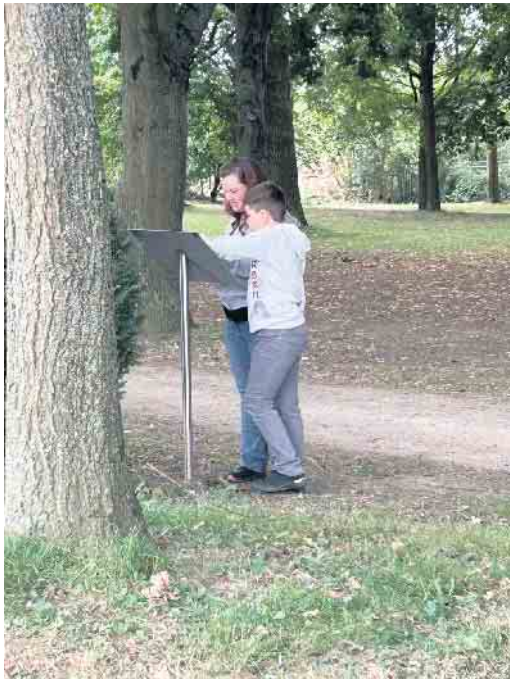
Zudem gab es fünf Zwischenfragen aus dem Bereich des Fanclubs