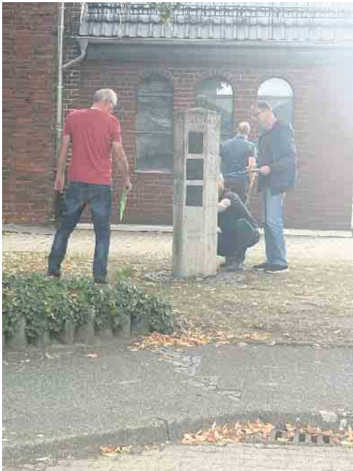
Die Antworten fanden sich rechts und links vom Straßenrand

Pony-Bar, auszutauschen. In dieser Zeit werteten die Neffeltal 98er die Bordkarten aus. Die Strafpunkte reichten von den Erstplatzierten mit 77,5 Punkten bis zum Schlusslicht mit 528,5 Punkten. Das Siegerteam erhielt einen großen Wanderpokal. Ferner erhielten die Platzierungen eins bis drei Pokale und zusätzlich Tankgutscheine im Wert von 175 Euro. Die Auswertung ergab folgende Platzierungen: Platz eins ging an das Team Holstein/Günther, Platz zwei errang das Damen-Team Jung/Pieck und Platz drei sicherte sich das Damen-Team Pieck/Spilles. Das Schlusslicht ging an das Team Reinart sowie der Pokal „km-König“ -für die meist gefahrenen Kilometer- ebenfalls. Zwei Teams fielen wegen Aufgabe aus der Wertung. Fazit: Aufgrund der guten Resonanz wird auch im kommenden Jahr wieder eine Orientierungsfahrt durchgeführt! Zudem versprach Präsident Henning Demke erneut am Ostersonntag 2026 eine Fahrt anzubieten. FH