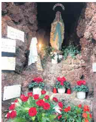
Lourdes-Grotte in Soller