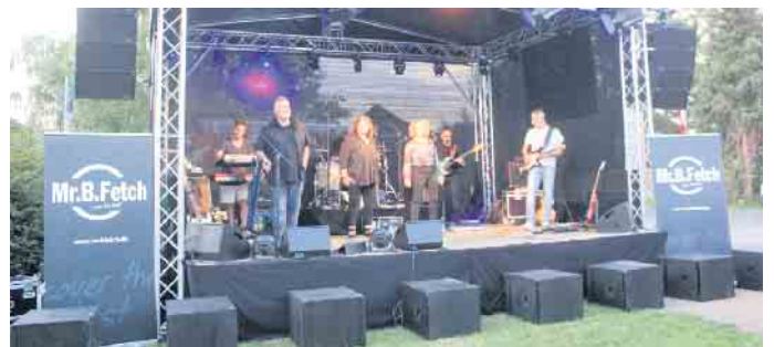
Die Band „Mr.B.Fetch - cover the best“ rockte am Freitagabend