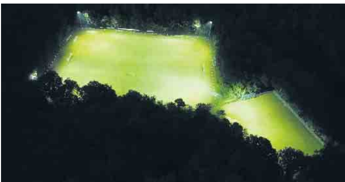
Flutlicht Drove.