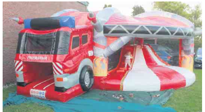
Für die Kinder gab es an beiden Tagen eine imposante Feuerwehr-Hüpfburg