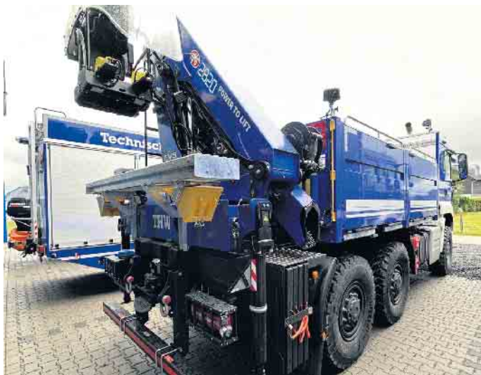
Mit 26 Tonnen zulässiges Gesamtgewicht wahrlich ein Dickschiff

Heute jedenfalls wurde der Neuling erstmal gebührend empfangen und gefeiert. Von den Minis, der Jugend und den Aktiven.