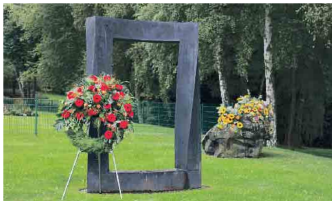
Tor zwischen den Welten.

www.deutschefriedhofsgesellschaft.de/ratgeber.(akz-o)