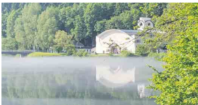
Am Jugendstilkraftwerk findet ein zünftiges Jazzkonzert statt.