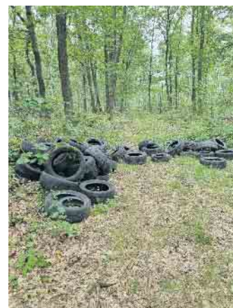
Altreifenentsorgung im Wald

Die finanziellen Folgen dieser Tat trägt mal wieder die Allgemeinheit. Sollte jemand in diesem Fall verdächtige Aktivitäten beobachtet oder anderweitige Kenntnisse über die Herkunft der Altreifen