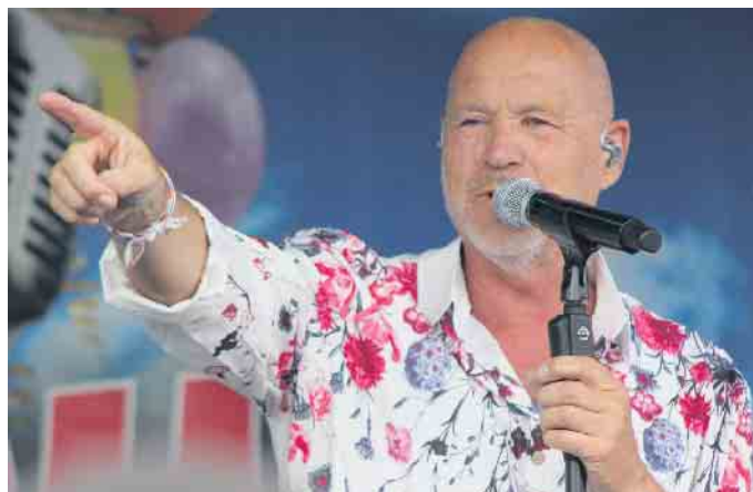
Sänger Olaf Henning durfte an diesem Tag natürlich auch nicht fehlen