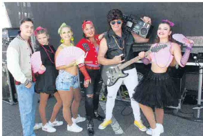
Die Medi Dance Group überzeugte durch ihre Performances