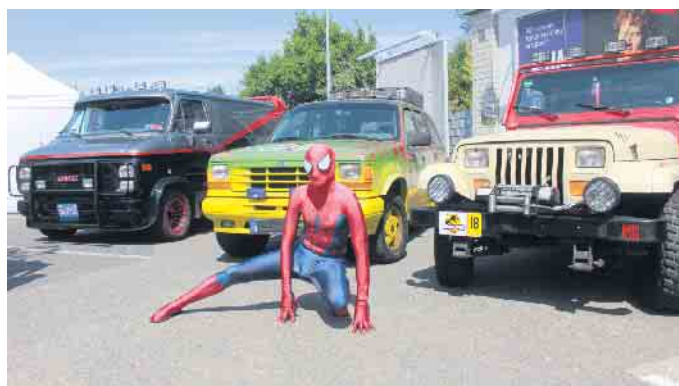
Spider Man vor den Kult TV- und Kino Fahrzeugen