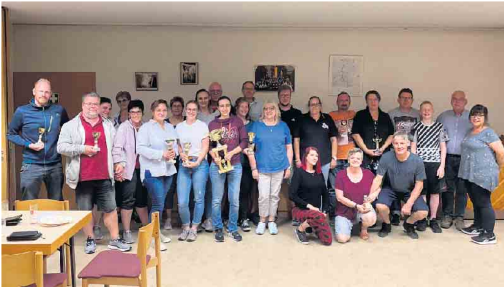
Die Teilnehmerinnen und Teilnehmer der 15. großen Orientierungsfahrt des 1. FC Köln Fan-Clubs Neffeltal 98

15. große Orientierungsfahrt des 1. FC Köln Fan-Clubs Neffeltal 98