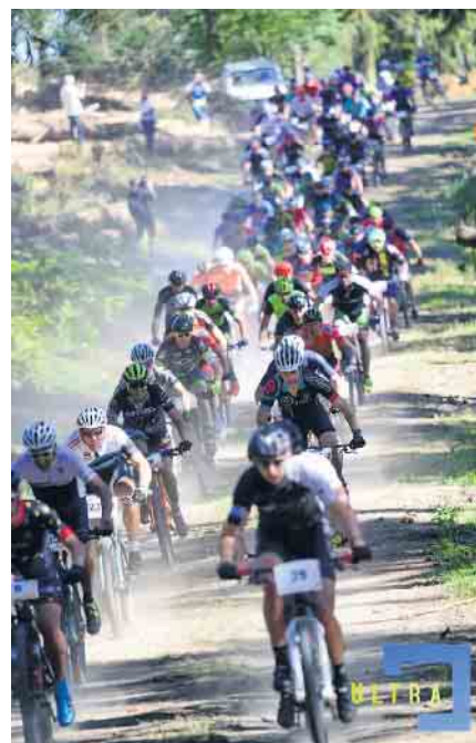
Rennaction in Vossenack