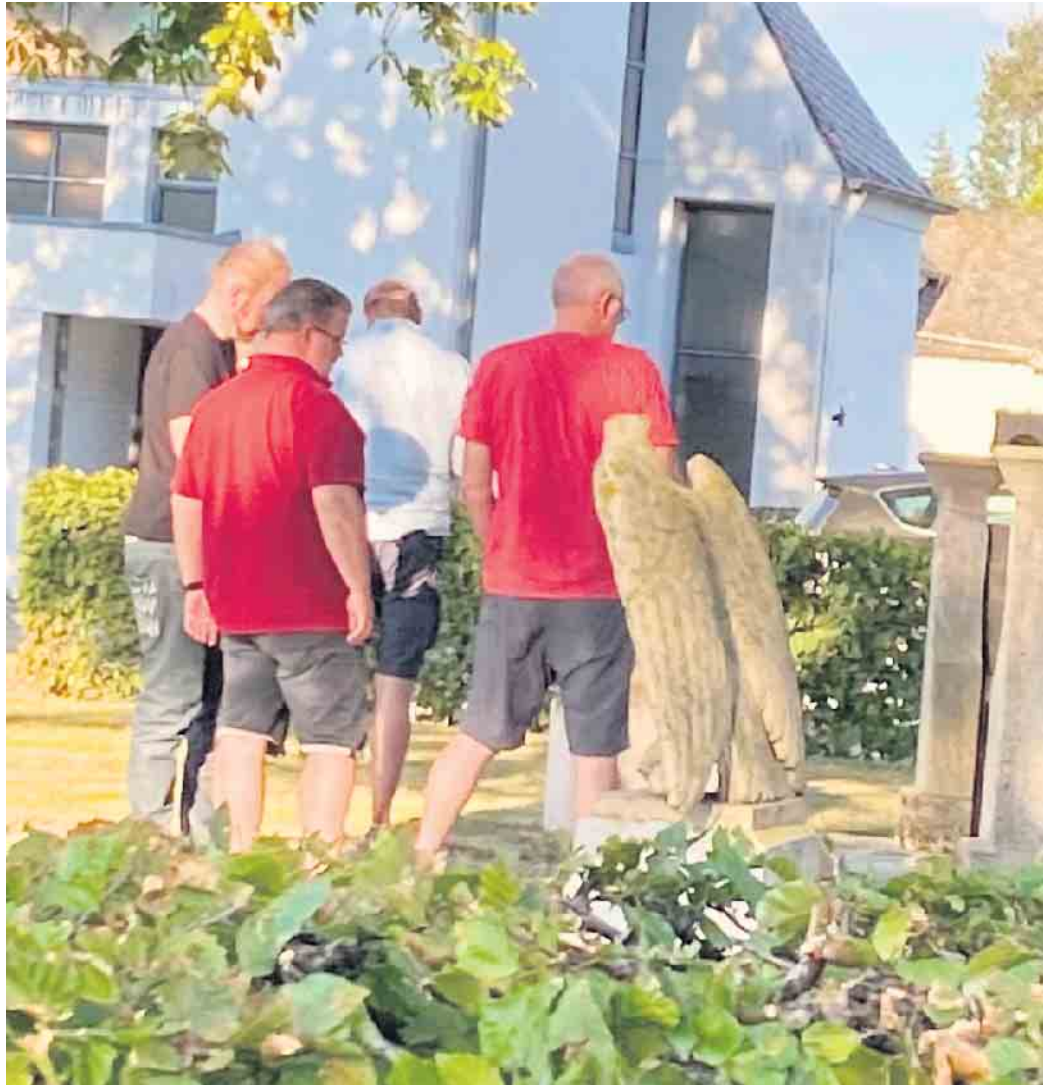
Impression aufgenommen von der Strecke

Fazit: Aufgrund der hervorragenden Resonanz wird auch im kommenden Jahr wieder eine Orientierungsfahrt durchgeführt! FH