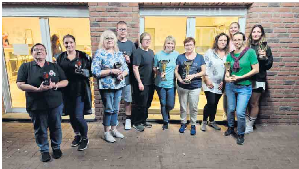
Hervorragende Resonanz: 16. große Orientierungsfahrt des 1. FC Köln Fan-Clubs Neffeltal 98

Die Fahrt führte die Teilnehmer von Bleibuir über Wielspütz, Bescheid, Lückerath, Schützen-