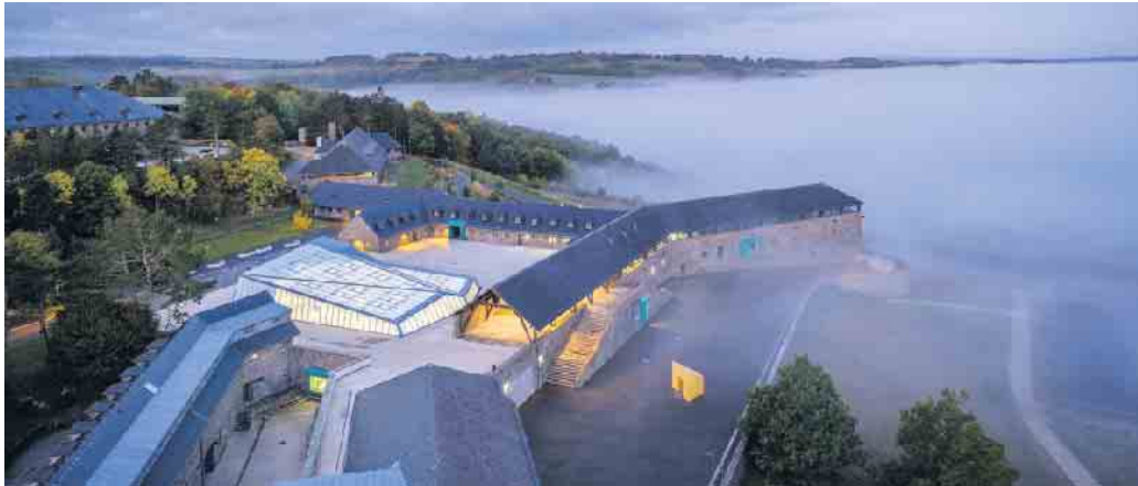
Vogelsang IP Turmaufstieg

LVR, Biologische Station Düren und Partner laden vom 16. September bis 8. Oktober zu über 100 Veranstaltungen in die Kulturlandschaft der Eifel. Programm jetzt erhältlich Vom 16. September bis 8. Oktober heißt es wieder Stadt Land Fluss. Alle zwei Jahre lädt der Landschaftsverband Rheinland (LVR) zur Erkundung einer Kulturlandschaft im Rheinland ein. In diesem Jahr gastiert Stadt Land Fluss in der Eifel, die für besonders vielfältige physisch-geographischen Strukturen mit tief eingeschnittenen Tälern aber auch flachen Muldenlandschaften steht. Von West nach Ost folgen auf das wasserreiche Hohe Venn das Monschauer Heckenland, die walddreiche Rureifel mit ihren Talsperren und die durch eher offene Landschaftsräume charakterisierte Kalkeifel.