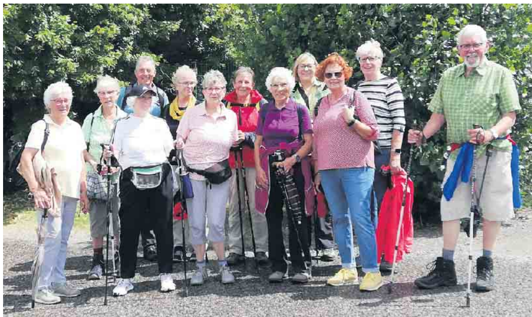
Senioren des Turnclubs Kreuzau auf dem Erlebnispfad Üdingen-Boich

Senioren des Turnclubs Kreuzau entdecken unbekannte „Schätze“