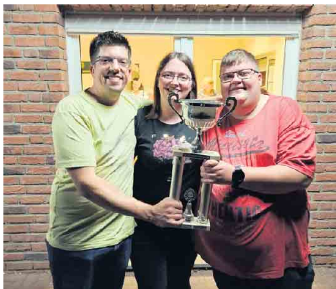
Das Siegerteam erhielt einen großen Wanderpokal. Der Wanderpokal für Vereine ging an das Team Hürtgen/Brose und blieb somit im Verein

dorf, Hostel, Glehn, Eicks sowie Floisdorf bis nach Bürvenich. Anschließend hatten alle die Möglichkeit sich bei Gebrülltem und Getränken im Gladbacher Sportheim auszutauschen. In dieser Zeit werteten die Neffeltal 98er die Bordkarten aus. Die Strafpunkte reichten von den Erstplatzierten mit nur 15 Punkten bis zum Schlusslicht mit 693 Punkten. Das Siegerteam erhielt einen großen Wanderpokal.