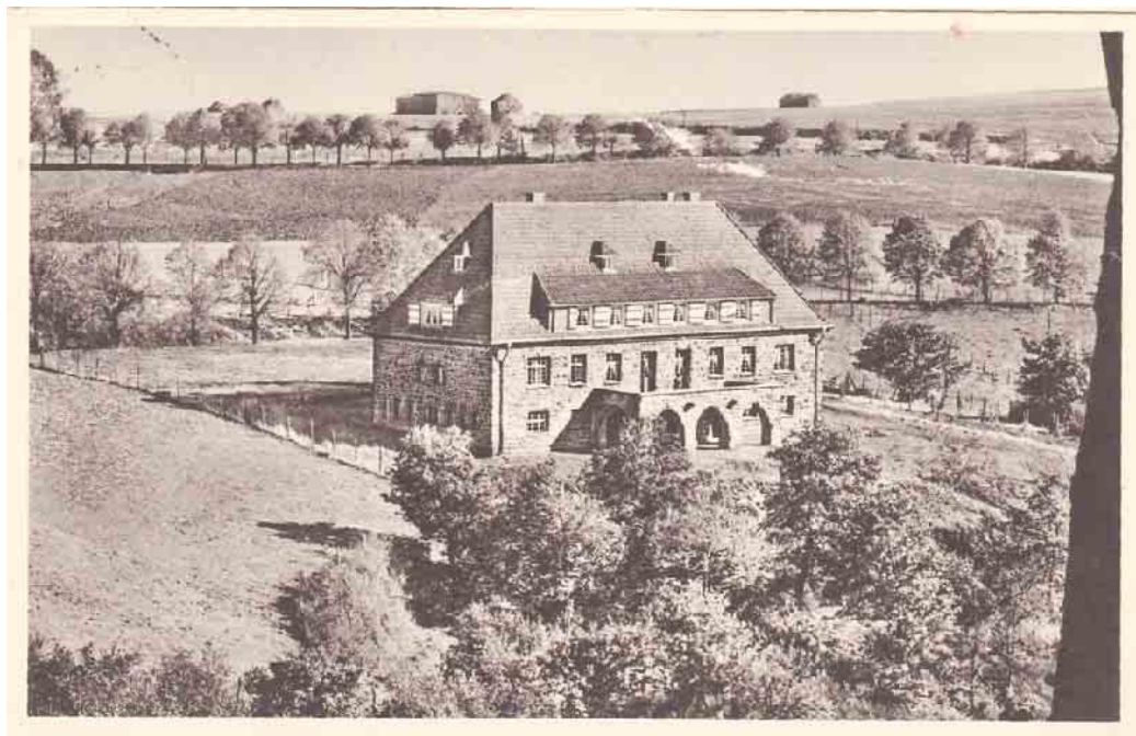
Alte Jugendherberge, Rather Straße 1932

Beheizt wurde das Gebäude durch zwei Koksöfen mit Warmluftschächten; die Schlafräume wa-