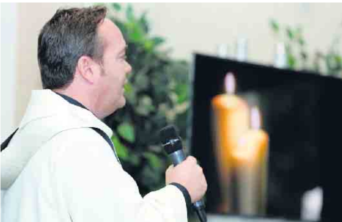
Gemeinsam Abschied nehmen.

Achten Sie darauf, dass in einer einmaligen Zahlung alle Positionen abgedeckt sind, damit die Kosten überschaubar bleiben. Hierzu gehören auch mögliche Grabpflegekosten sowie die möglichen zuvor genannten weiteren Kosten. Überlegen Sie frühzeitig, ob Sie die Trauerhalle und Friedhofskapelle nutzen möchten. Vergleichen Sie und lassen Sie sich Zeit. Bei Urnen muss übrigens die Beisetzung nicht sofort erfolgen. So bietet zum Beispiel das Rheintanus-Krematorium eine bis zu einem Jahr kostenfreie Aufbewahrung der Urne an. (akz-o)