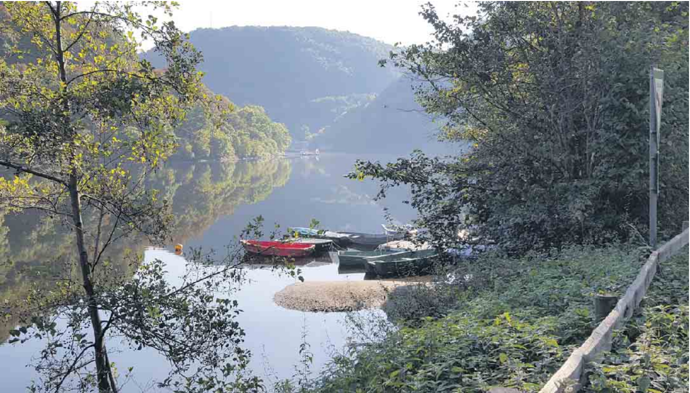
Bei der Präsentation der „Wasserstadt Heimbach“ steht auch der Stausee mit dem einzigartigen Jugendstilkraftwerk im Fokus.

Am 16. September werden die Schokoladenseiten der Stadt bei einer informativen Rundfahrt präsentiert - Den Abschluss bildet ein Open-Air-Jazz-Konzert am Wasserkraftwerk. „Stadt, Land, Fluss“ nennt sich eine Programmreihe, die ab 16. September die Kulturlandschaft der Eifel vorstellt. Auf Initiative des Landschaftsverbands Rheinland wird die Region in Zusammenarbeit mit Biostationen und regionalen Einrichtungen vorge-