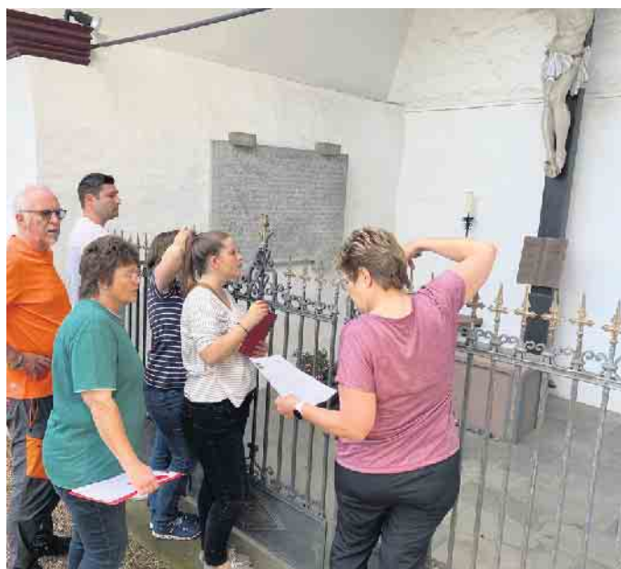
Die Teams erhielten Unterlagen mit 19 Fragen, die während der Fahrt bewältigt werden mussten. Die Antworten fanden sich rechts und links vom Straßenrand

Der Wanderpokal für Vereine ging an das Team Hürtgen/Brose und blieb somit im Verein.