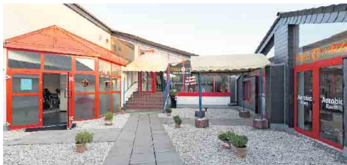
Der Trainingsraum für das Gruppentraining befindet sich auf der rechten Seite.

Fitness& more in Nideggen, wo alle Kurse des Rehasportvereins stattfinden. Wir freuen uns dich auf deinem Weg zu begleiten.