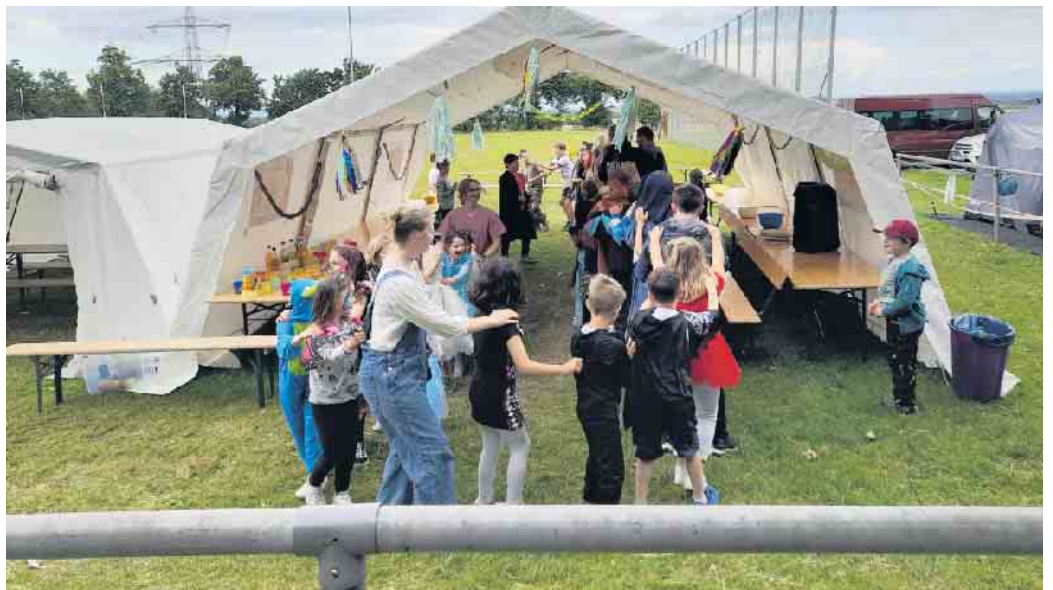
Die Ferienspiele sind immer sehr beliebt!