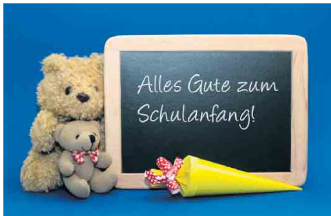
Alles Gute zum Schulanfang!

Neben der Freude wiegt aber oft auch ein mulmiges Gefühl - nicht zuletzt bei uns Eltern. Schließlich beginnt mit dem ersten Schultag ein neuer Lebensabschnitt. Es ist unsere gemeinsame Verantwortung, unseren Kindern eine solide Grundlage für ihre Bildung und persönliche Entwicklung zu bieten. Lassen Sie uns ein Beispiel sein und zeigen, dass wir als Gemeinschaft stehen und uns gegenseitig unterstützen, damit unsere Kinder ihre Potenziale voll entfalten können. Ich bin zuversichtlich, dass das neue Schuljahr 2023/2024 voller Möglichkeiten steckt. In diesem Sinne wünsche ich allen Schülerinnen und Schülern, Lehrkräften und Eltern einen erfolgreichen Start in das neue Schuljahr. Möge es eine Zeit der Inspiration, des Wissenserwerbes und der schönen Erinnerungen sein. Es grüßt herzlichst Euer/Ihr Bürgermeister Joachim Kunth