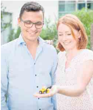
Für den Bau des eigenen Zuhauses kommt es auf eine solide Eigenkapitalbasis an.