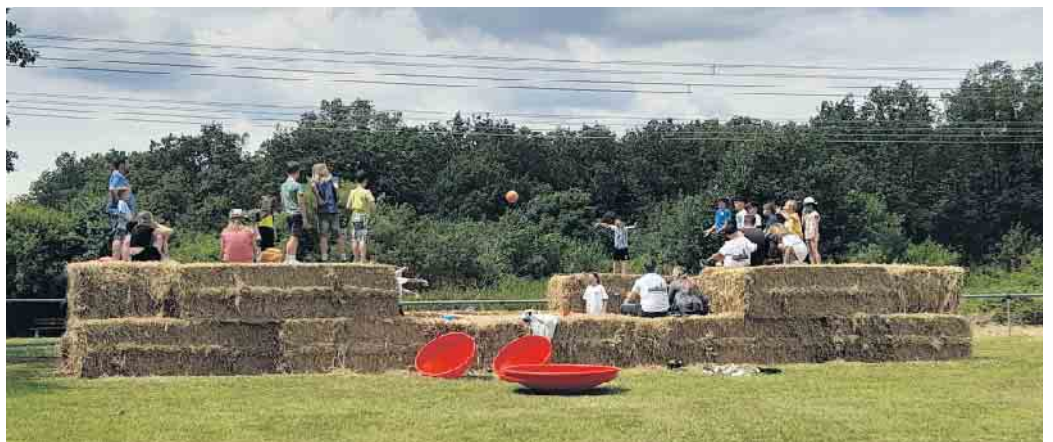
Spiel und Spaß garantiert!