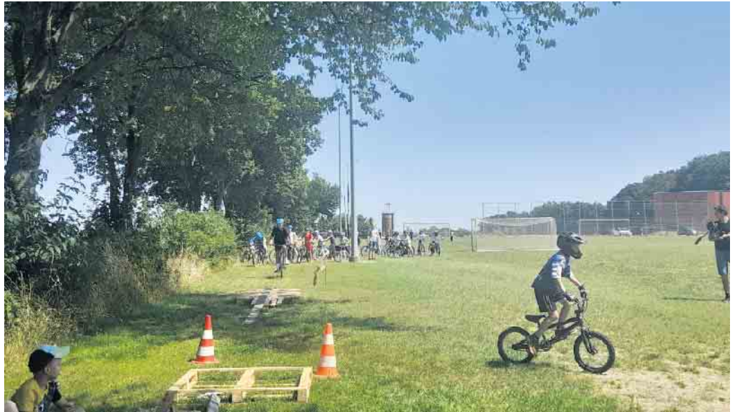
Die Kids hatten jede Menge Spaß!