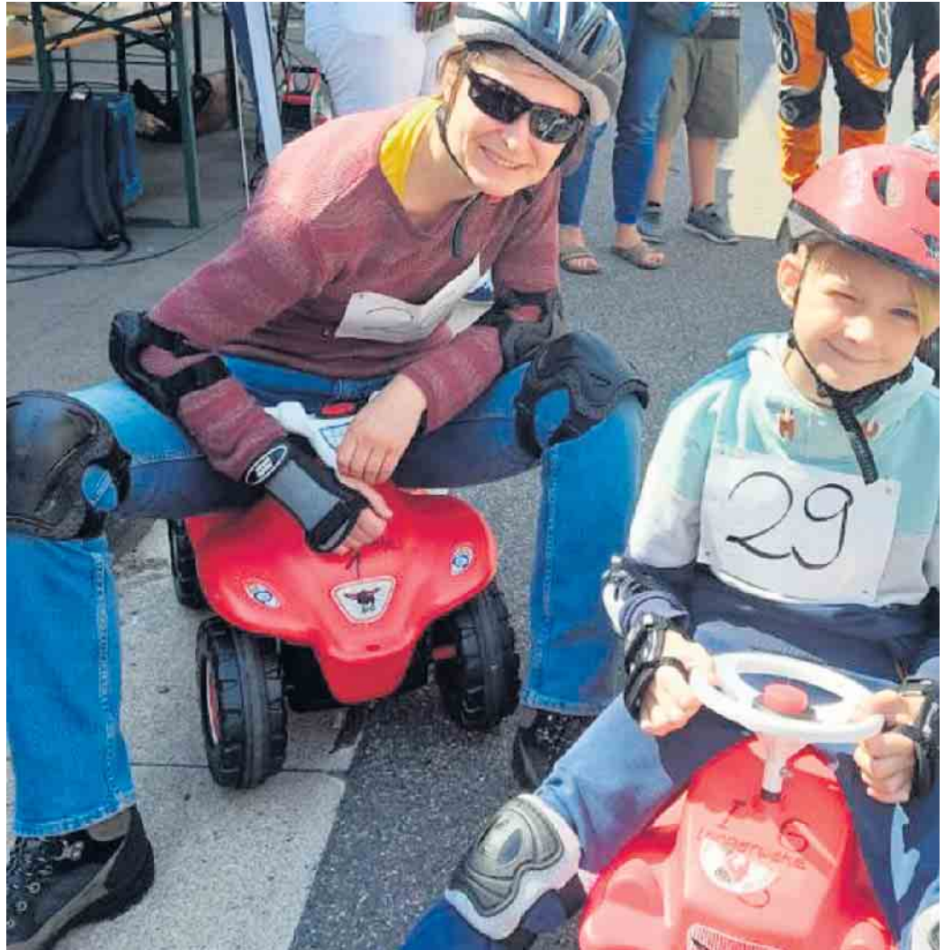
Zwei der 58 Teilnehmer 2022