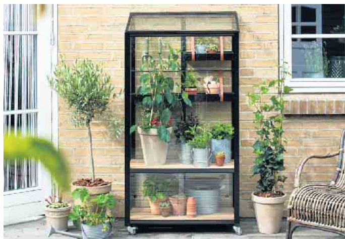
Im Mini-Gewächshaus gedeihen Kräuter und Gemüse auf kleinstem Raum

chen es sogar möglich, sich das ganze Jahr hindurch, mit frischen Obst, Gemüse und Kräuter selbst zu versorgen. Und auch in der kalten Jahreszeit sind Gewächshäuser nützlich: als Schutz für frostempfindliche Pflanzen. (BHW)