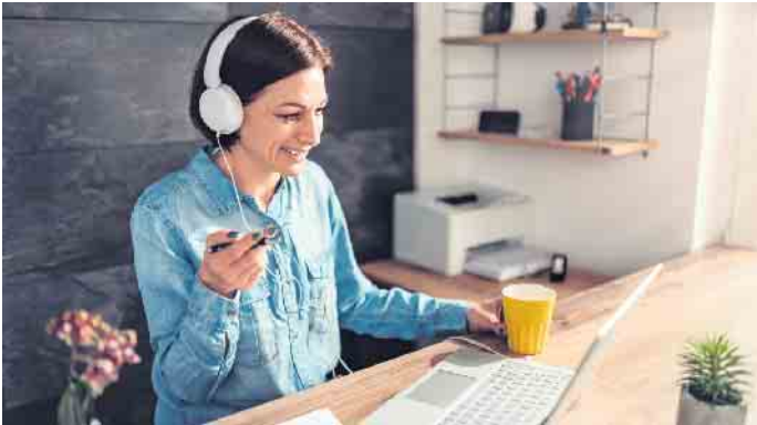
Viele an einer Umschulung oder Weiterbildung Interessierte sind auf flexible, familienfreundliche Unterrichtszeiten angewiesen.

tenträgers kann man häufig sogar von zu Hause aus am virtuellen Unterricht teilnehmen.