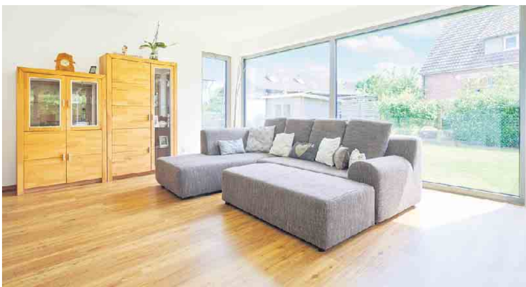
Aluminiumfenster sind bei großformatigen Panoramafenstern besonders beliebt.

aufgesetzt wird. Außerdem besteht die Möglichkeit, die Aluminiumaußenseiten farbig pulverbeschichten. „Auf diese Weise gewinnt man außen die Optik und Witterungsvorteile eines Aluminiumfensters mit höheren Dämm-