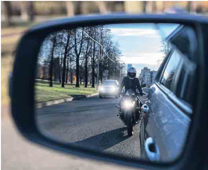
An Motorrädern muss tagsüber stets das Licht eingeschaltet sein, um es im Straßenverkehr besser sichtbar zu machen.

Gut gesehen zu werden, hilft bei der sicheren Teilnahme am Straßenverkehr. Das gilt auch im Sommer, selbst wenn dieser viel Sonnenschein und lange Tageslichtphasen bietet. Denn zum Beispiel ungünstiger Sonnenstand (Gegenlicht), Regen, Nebel und andere Phänomene können die Wahrnehmung von Autofahrern und anderen Verkehrsteilnehmern auch im Hellen beeinträchtigen. Besonders in solchen Situationen hilft es, wenn Fußgänger und andere Fahrzeuge durch starke Farben, hohe Kontraste oder Licht besser wahrzunehmen sind. Seit Februar 2011 müssen alle neuen Personenwagen, die in Deutschland zugelassen werden, mit Tagfahrlicht ausgestattet sein. Für Lastwagen gilt diese Regelung seit August 2012. Weit verbreitet sind dabei eigene Tagfahrleuchten, die gegenüber den Scheinwerfern des Abblendlichts eine erheblich geringere Lichtabgabe haben und nach vorn weisen, statt die Fahrbahn auszuleuchten. Sie haben ausschließlich eine Signalfunktion und werden automatisch ausgeschaltet, wenn das Abblendlicht eingeschaltet wird.