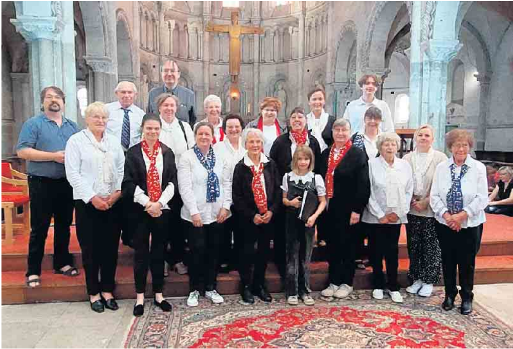
Gruppe in der Kirche St. Martin Barentin

Vom 28. bis 30. Juni startete der Kirchenchor Froitzheim zu seiner 2. Konzertreise nach Frankreich. Diesmal war das Ziel die kleine Stadt Barentin bei Rouen in der Normandie. Die Einladung erfolgte über eine französische Elterngruppe, die wir bei unserer 1. Konzertreise nach Paris (Oktober 2023) kennen lernten. Auf der Hinreise mit dem Bus besichtigten wir die wohl weltweit größte Kathedrale in Amiens, in der der Überlieferung nach der heilige Martin den Mantel teilte. Am Vormittag besichtigten wir die Stadt Rouen mit der großen Kathedrale, in der sich die Gräber des 1. Französischen Königs Rollo und des Richard Löwenherz befinden. Nach einer Stadtrundfahrt ging es dann nach Pavilly, wo wir in der dortigen Kirche unser Konzert durchführten. Unsere Gastgeber bedankten sich mit einem feudalen Abendessen.