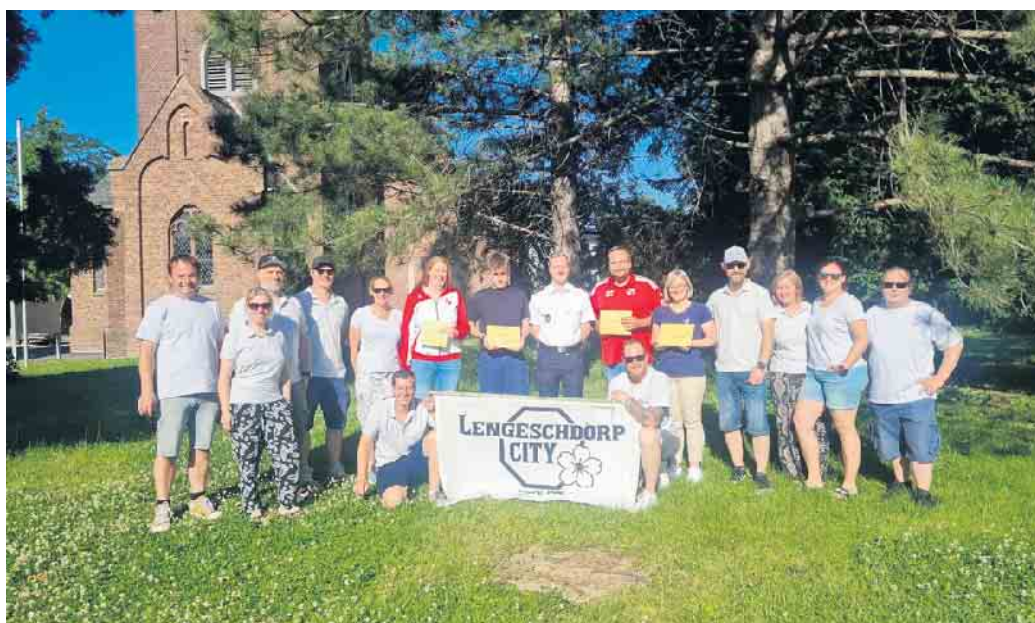
Dieses Jahr sollen die Spenden zu Gunsten der Lendersdorfer Dorfvereine für die Jugendarbeit verteilt werden. Die Gelder wurden kürzlich bei einer Übergabe an insgesamt vier Vereine ausgegeben.