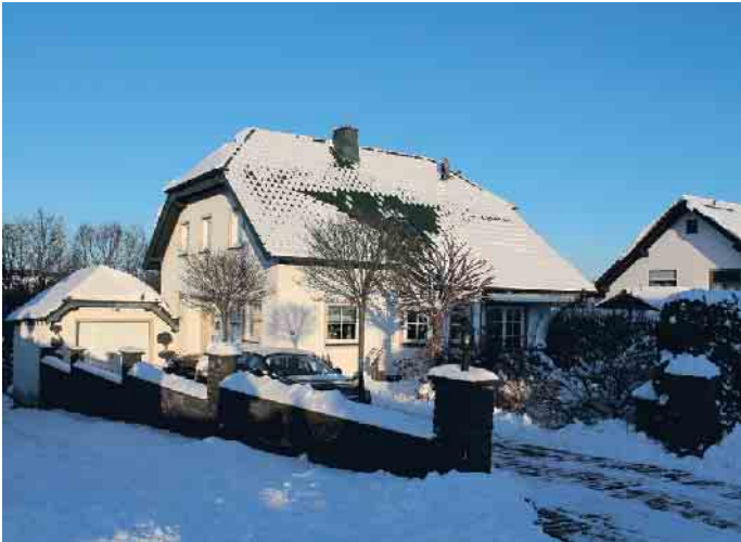
Dächer werden durch vielfältige Witterungen und Temperaturunterschiede beansprucht. Ein regelmäßiger Check sorgt für Sicherheit.

Der Zentralverband des Deutschen Dachdeckerhandwerks (ZVDH) rät daher allen Hausbesitzern und Hausverwaltungen, nach dem Winter das Dach und seine Bauteile überprüfen zu lassen. Nur so können mögliche Schäden rechtzeitig behoben werden. Im