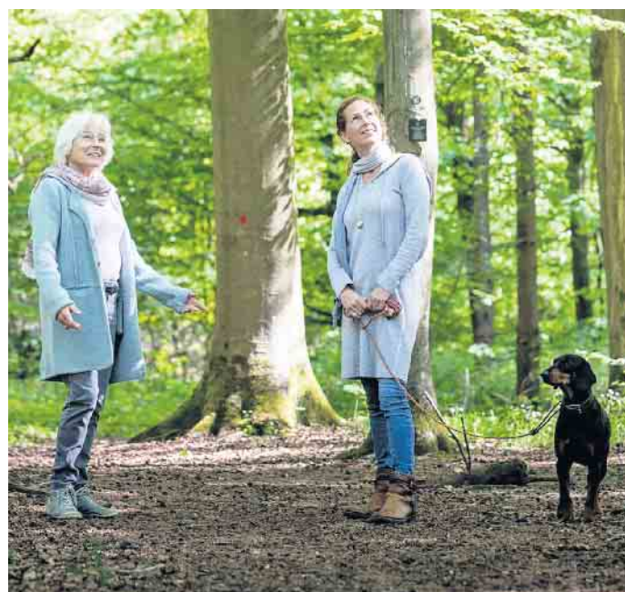
Viele Hinterbliebene lassen ihren Erinnerungen gern bei einem Spaziergang durch den Bestattungswald freien Lauf.

Manche nutzen den Baum im Bestattungswald auch als stummen Gesprächspartner, berühren und umarmen ihn oder lesen ihm einen selbst verfassten Brief an den Verstorbenen vor. Kinder finden die Idee, diesem Menschen eine Umarmung durch den Baum zu schicken, oft sehr nachvollziehbar. (djd)