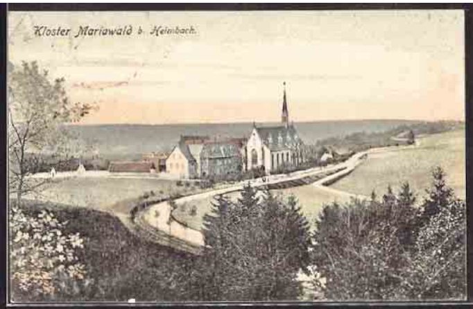
alte AK auf dem Weg zum Kloster Mariawald

Bier galt als Tischgetränk oder wurde zu besonderen Anlässen ausgeschenkt.