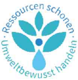
Ressourcen schonen - Umweltbewusst handeln