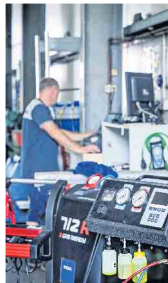
Mechaniker mit Sachkundenachweis für die Klimaanlagenwartung und professionelle Klimaservicegeräte stellen sicher, dass bei der Überprüfung der Fahrzeugklimatisierung nichts übersehen wird.

rige Temperaturen den Kreislauf belasten und Erkältungen nach sich ziehen können. Als Vorbeugung gegen Gerüche sollte die Klimatisierung zudem ein paar Minuten vor Fahrtende ausgeschaltet werden. So kann Kondenswasser verdunsten und der Gefahr der Ansiedlung von geruchsbildenden oder allergenen Keimen wird vorgebeugt. (DJD)