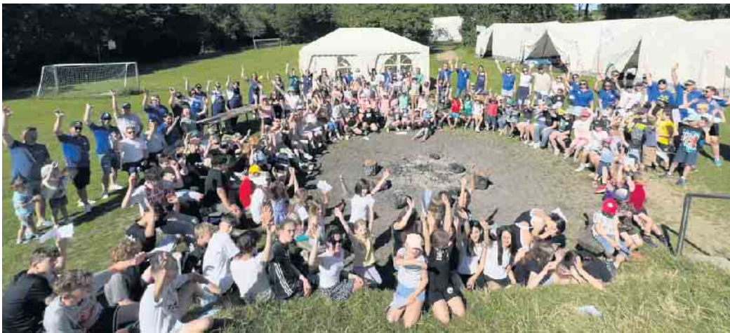
Kinder und Jugendliche der Kreuzauer KG „Ahle Schlupp“ 1880 Kreuzau e.V. erlebten mit Betreuerinnen und Betreuern sowie einer „Küchen“- und einer „Hausmeistercrew“ eine tolle Zeit auf dem Zeltplatz Finkenheide.