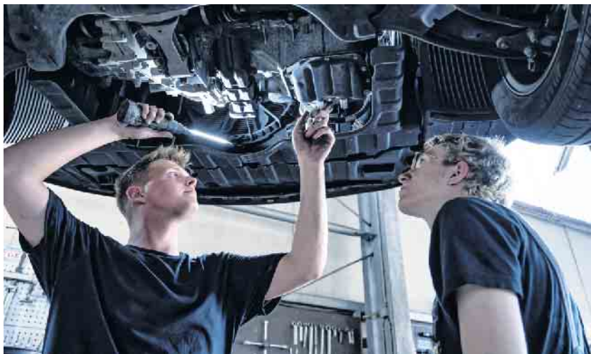
Beim Klimaanlagen-Check prüft der Kfz-Mechaniker alle Teile der Anlage und ihre Funktionen.

etwa kann die Leistung beeinträchtigen und zu Schäden am Kompressor der Klimaanlage führen – die Reparatur geht richtig ins Geld. Ein Austausch der Innenraumfilter nach Herstellerempfehlung verhindert, dass sich Bakterien oder Schimmel ansammeln, die unangenehme Gerüche erzeugen und Allergien auslösen können. Sollte bereits ein muffiger Hauch aus der Lüftung wahrnehmbar sein, empfiehlt sich eine Desinfizierung der