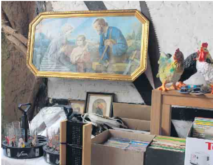
Gläser, Bücher oder sehenswerte Gemälde - Jeder hat solche Dinge zuhause liegen, die er nicht mehr braucht oder die nicht mehr gefallen