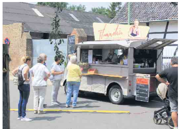
Für das leibliche Wohl während beider Tage sorgten zahlreiche Street Food-Stände