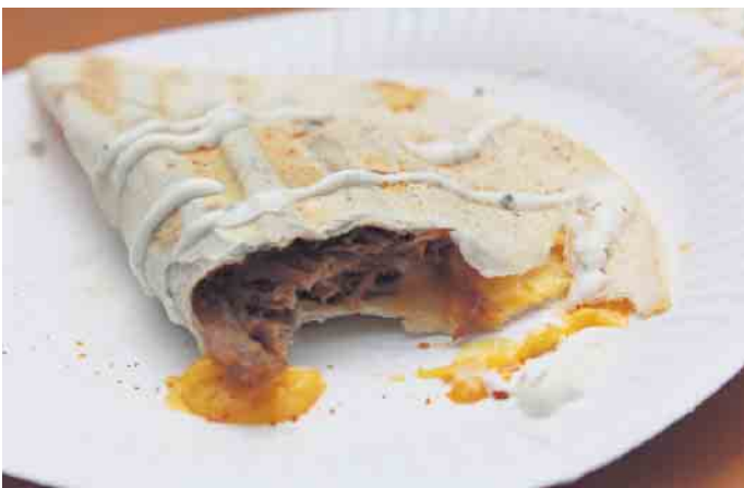
Burritos gefüllt mit Pulled Pork - hmm herrlich lecker

Andererseits finden wieder vermehrt Veranstaltungen statt. Für das leibliche Wohl während beider Tage sorgten zahlreiche Street Food-Stände rund um die örtliche Kirche. Die Besucherinnen und Besucher konnten sich hier erstmals auf abwechslungsreiche internationale Speisen, Flammkuchen, kölsche