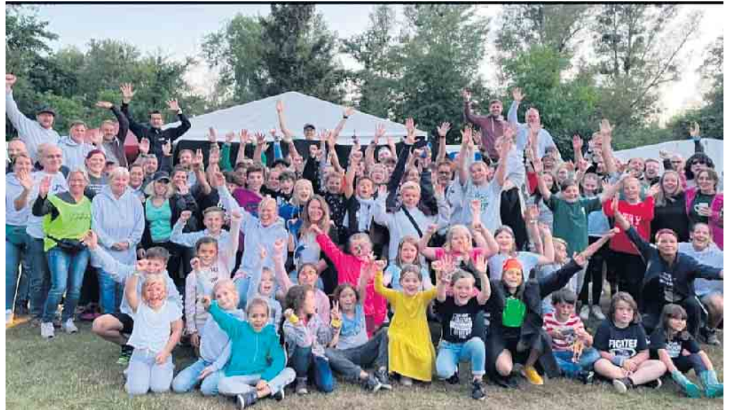
Am ersten Ferienwochenende veranstalteten die Karnevalsgesellschaft Lengeschdörpe Klompe nach zwei Jahren Corona-Pause das traditionelle Kinder- und Jugendzeltlager in den Niederauer Rurauen