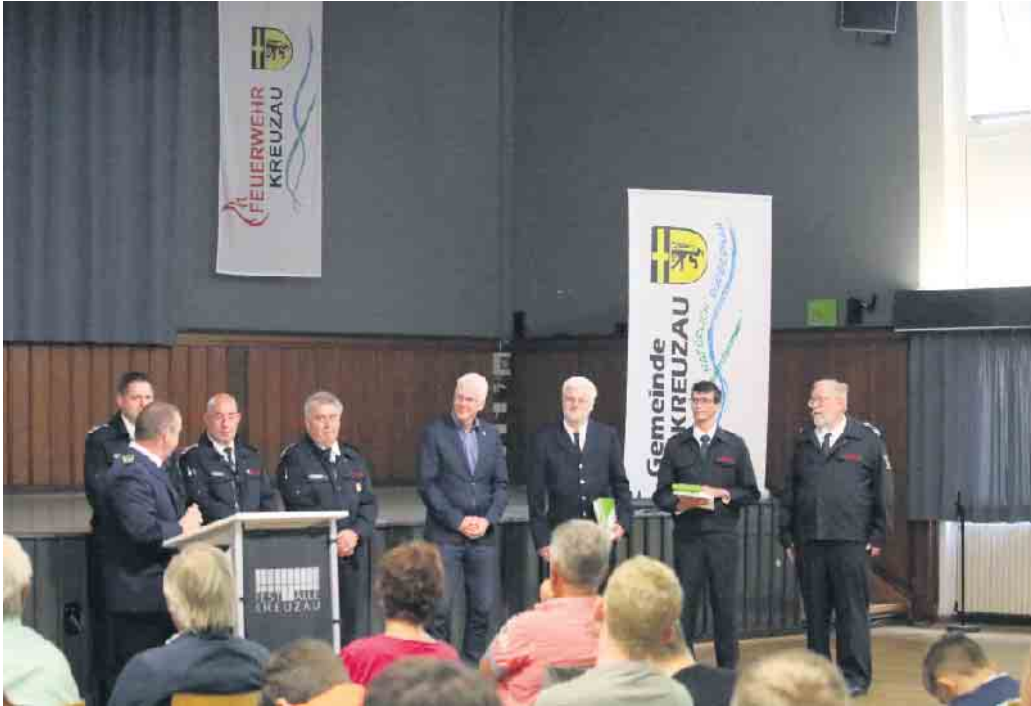
Feuerwehr Kreuzau: Fotos: Gemeinde Kreuzau

Mitgliederversammlung der Feuerwehr Kreuzau