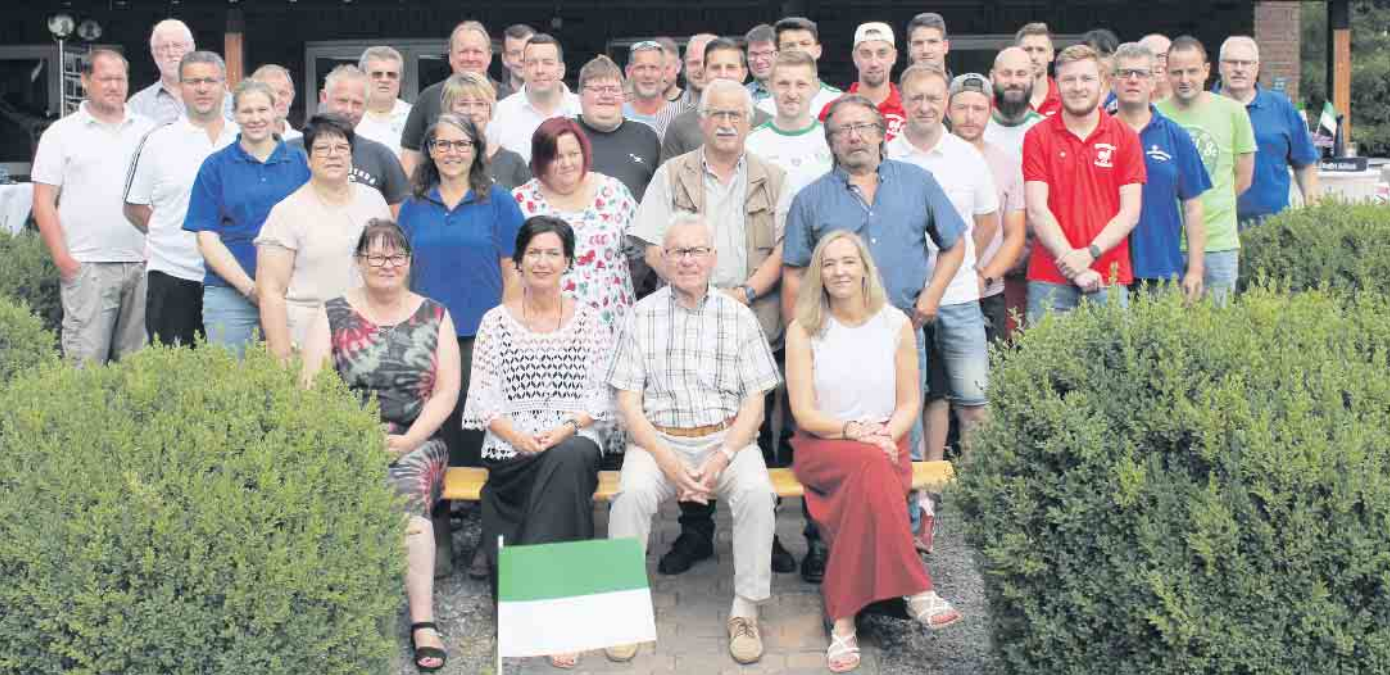
Ehrenmitglieder sowie Mitglieder der „Sportfreunde Gladbach 1920 e.V.“

Die Sportwoche in Gladbach vom 17. bis 19. Juni fand unter den besten Voraussetzungen statt, sogar die Sonne begleitete die Fußballspiele das ganze Wochenende. Am Freitag, 17. Juni, gab es endlich nach zwei Corona-Jahren wieder hausgemachte Reibekuchen. Die Resonanz der Besucher*innen aus dem Dorf war überwältigend. Es wurde sich in gemütlicher Runde, mit Reibekuchen und dem ein oder anderen Kaltgetränk, ein schönes Fußballspiel der I. und II. Mannschaft der SG Neffeltal angeschaut. Am Samstag, 18. Juni, fand dann ab 16 Uhr das Alte-Herren-Turnier statt. Auch hier freute man sich, nach einer zweijährigen Corona-