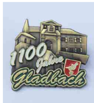
Der Pin zu den Feierlichkeiten konnte vor Ort erworben werden

Schränke, Regale, Dachboden und Keller sind vollgestopft davon und man hat kaum noch Platz für die wirklich wichtigen Dinge. Höchste Zeit, den alten Kram loszuwerden - am besten natürlich gegen Bares, damit man sich davon schöne neue