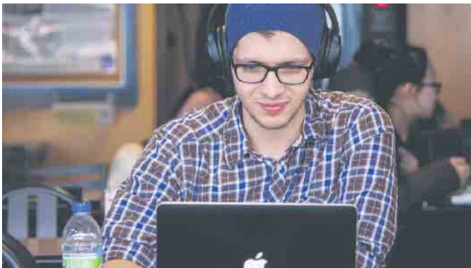
Bei der Lehrstellensuche spielt das Internet eine große Rolle.