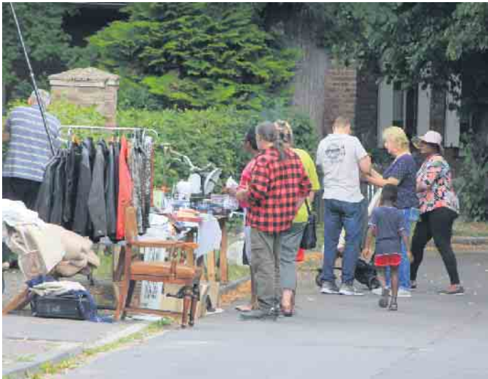
Tolle Nachrichten für alle Trödel-Fans schallten im Vorfeld durch Vettweiß-Gladbach: Der Garagen- und Hoftrödelmarkt fand wieder statt

Sonntagmorgen Alphornbläser Lieder zur Freude der Besucherinnen und Besucher gaben. Der Garagen - und Hoftrödelmarkt mit Street Food-Meile soll in dieser Zeit wieder nach-barschaftliche Freude bereiten. Alle teilnehmenden Haushalte möchten die Nachhaltigkeit