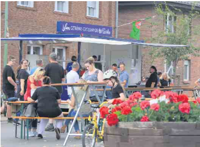
Rund um die Kirche wurden kühle Getränke angeboten

Klassiker und vegetarische Spezialitäten sowie erfrischende Getränke freuen. An beiden Tagen war das Spiel-mobil des Kreisjugendamtes Düren zu Gast. „DJ Thomy“ und Schlagersänger „Roxy“ sorgten am Samstagabend für Stimmung, ehe