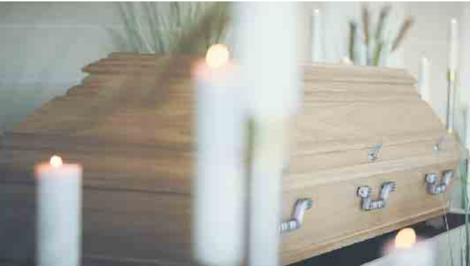
Für sehr große und sehr schwere Menschen gibt es maßangefertigte Särge.

Alle gesellschaftlichen Trends spiegeln sich, früher oder später, auch in der Bestattungskultur wider. Sei es die Digitalisierung, die Individualisierung, die Zunahme der Nomadisierung, einhergehend mit einer zunehmenden Mobilität der Gesellschaft, aber eben auch eine veränderte Ernährungs- und Lebensweise oder andere Dispositionen, die zu Übergewicht und infolgedessen zu Adipositas führen können. Über die Hälfte der Erwachsenen in Deutschland ist übergewichtig, fast ein Viertel ist sogar adipös. Betroffene können sich an den Adipositas-Selbsthilfe-Verein wenden. Dem Lauf der Dinge folgend, werden auch diese Menschen einmal sterben. Die Bestatter des Bundesverbandes Deutscher Bestatter e.V. engagieren sich dafür, für alle Menschen eine würdige Beisetzungsform zu finden, ganz gleich ob groß, klein, schwer oder leicht, geboren oder ungeboren, verstorben. Natürlich muss man auf die besonderen Bedingungen reagieren und entsprechend planen. Ob Erd- oder Feuerbestattung, für beide Abschiedswege wird ein Sarg benötigt. So kümmert sich der Bestatter zum Beispiel um einen maßangefertigten Sarg, denn Standardsärge sind nur 65-70 cm breit. Ist eine Feuerbestattung gewünscht, nimmt er zum nächstgelegenen Krematorium Kontakt auf, welches auch Kremierungen adipös Verstorbener durchführen kann. Dort können auch Trauerfeiern stattfinden. Ist eine Erdbestattung gewünscht, organisiert der Bestatter auf Wunsch die ge-