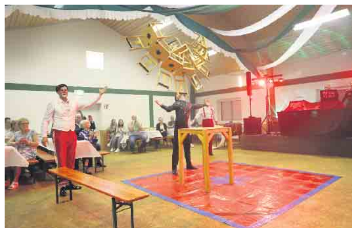
Die Show des Circus Antavia