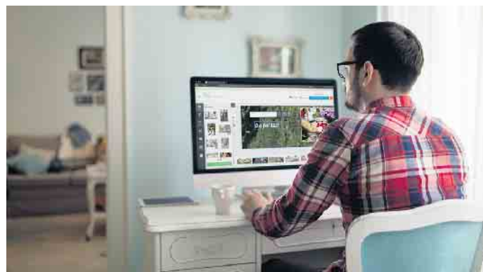
Die digitale Trauer nimmt einen immer größeren Stellenwert bei der Bewältigung des Erlebten ein.

Ein gutes Gedenkportal bietet eine Plattform für Kondolierende und für die, die dem Verstorbenen im übertragenen Sinne „eine Nachricht hinterlassen“ wollen. Dazu gehört unter anderem die Möglichkeit, virtuelle Kerzen anzuzünden und so des Verstorbenen zu gedenken. „Zusätzlich können hier zum Beispiel wohlthätige Spenden im Sinne des Verstorbenen getätigt, Blumen für das Grab bestellt und auch ein eigenes Foto-Erinnerungsbuch mit allen Inhalten der Gedenkseite kreiert werden“, berichtet Stahl. „Das alles bietet dem Hinterbliebenen und allen Freunden des geliebten Verstorbenen einen unglaublich wichtigen Raum für die Trauerbewältigung.“ (DS)