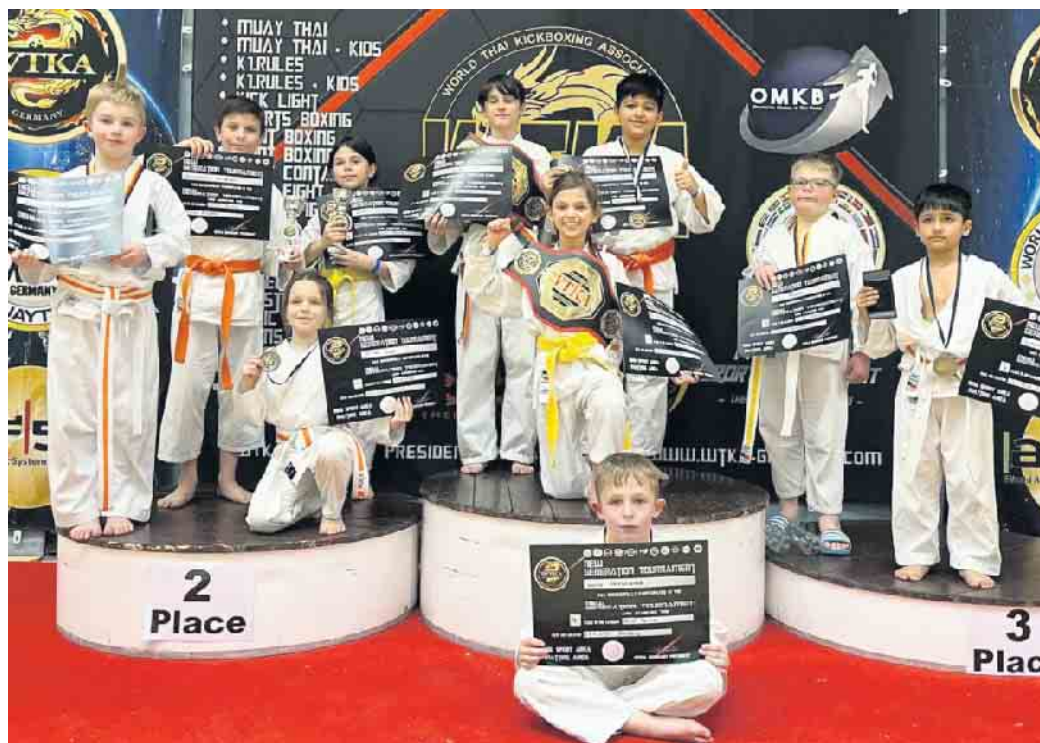
Strahlende Gewinner und Platzierte der Karate Akademie Düren e.V.

Der Ausrichter, die WTKA Germany, organisierte dieses Turnier ausdrücklich für Neueinsteiger. Deswegen war es umso erfreulicher, dass eine gute Organisation auf den Kampfflächen direkt Ruhe in die Halle brachte, was den Kindern der Karate Akademie Düren erstmal die erste Nervosität nehmen konnte. In vielen Kämpfen, die nicht immer das ersehnte Ziel für die jungen Teilnehmerinnen und Teilnehmer brachten, flossen nicht nur Schweiß, sondern manchmal auch ein paar Tränen. Eine Niederlage einstecken und damit umgehen gehört eben auch zu den wichtigen Erfahrungen eines Karate-Sportlers. Und diese Erfahrungen helfen dann nicht