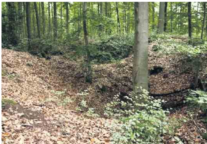
Nideggen, Pinge im Badewald

Erzertrag stehe. Der Fremde, der natürlich ein örtlicher Bergeist war, sagte zu ihm: „Graf e wennig wigger dörch, dann könnst de op schön Ehz“! Der Bergmann tat es und stieß auch wirklich auf ein schmales Äderchen mit feinstem Erz. Mit neuem Mut grub er weiter. Seine Ausdauer wurde belohnt, denn auf einmal wurde die Ader breiter. Erfreut füllte er sein Säcklein und trug es freudig nach Hause. Auf dem Weg begegnete er dem feinen Herrn, den er natürlich wiedererkannte. Der Fremde fragte ihn: „Häb de jetz Ehz jefonge? Dann loß mich ens kicke, wat du em Säckelche häß“. Der Tagelöhner zeigte ihm sein Erz. Was aber war das? Vor Verwunderung konnte er kein Wort hervorbringen, denn das vermeintliche Erz