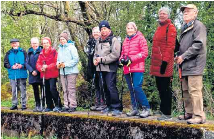
Senioren des Turnclubs Kreuzau im Paustenbacher Venn

Turnclub-Senioren wanderten im Paustenbacher Venn