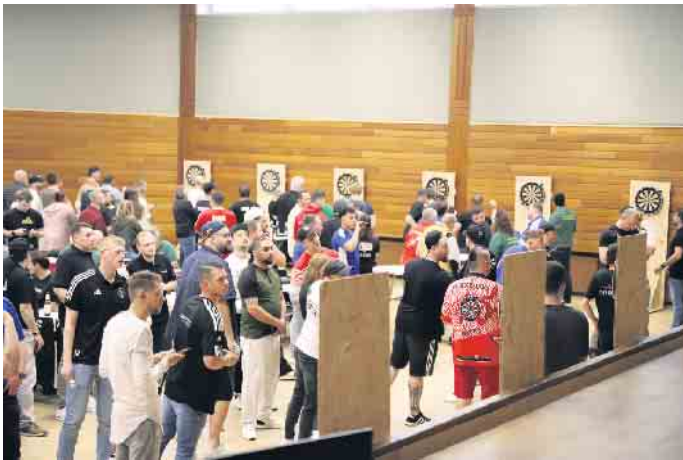
Zielgenau für den guten Zweck hieß es in der Lendersdorfer Rurtalhalle

die Spitze aus Metall besteht. Beim Turnier durfte der Dart-pfeil also maximal 30,5 Zenti-meter lang und 50 Gramm schwer sein. Die einzelnen Dartpfeile der Teilnehmer konn-ten theoretisch unterschiedlich lang und schwer sein. Dem ein-zelnen Spieler war es zudem erlaubt während einer laufen-