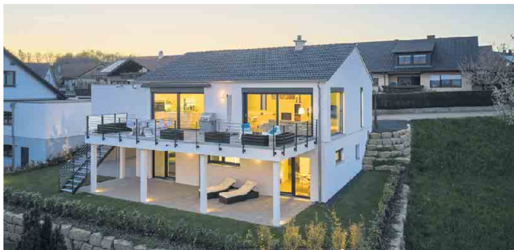
Keller werden heute zum Wohlfühlwohnen genutzt.

Die entstehende Wohnfläche im Untergeschoss des Hauses kann zum Beispiel für eine Wellnesso-