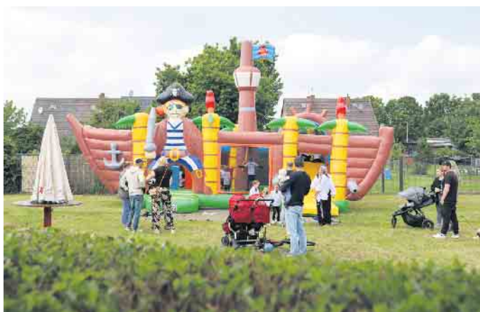
Auf die kleinen Besucher wartete am Sonntag und Montag eine Hüpfburg