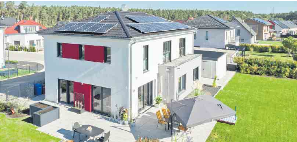
Beim Fertighausbau wird der Grundriss so wie das gesamte Haus individuell auf die Baufamilie zugeschnitten.