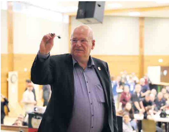
Dürens Bürgermeister eröffnete mit dem ersten Wurf offiziell das Turnier

stehen Wir hier“, so Jacobs zu-frieden. Doch was ist Steel-Dart eigent-lich? Im Dartsport wird zwis-chen Steeldarts und Softdarts unterschieden. Der offensicht-lichste Unterschied liegt bei der Spitze des Dartpfeils. Der Be-griff „Steeldarts“ beschreibt den klassischen Pfeil, bei dem