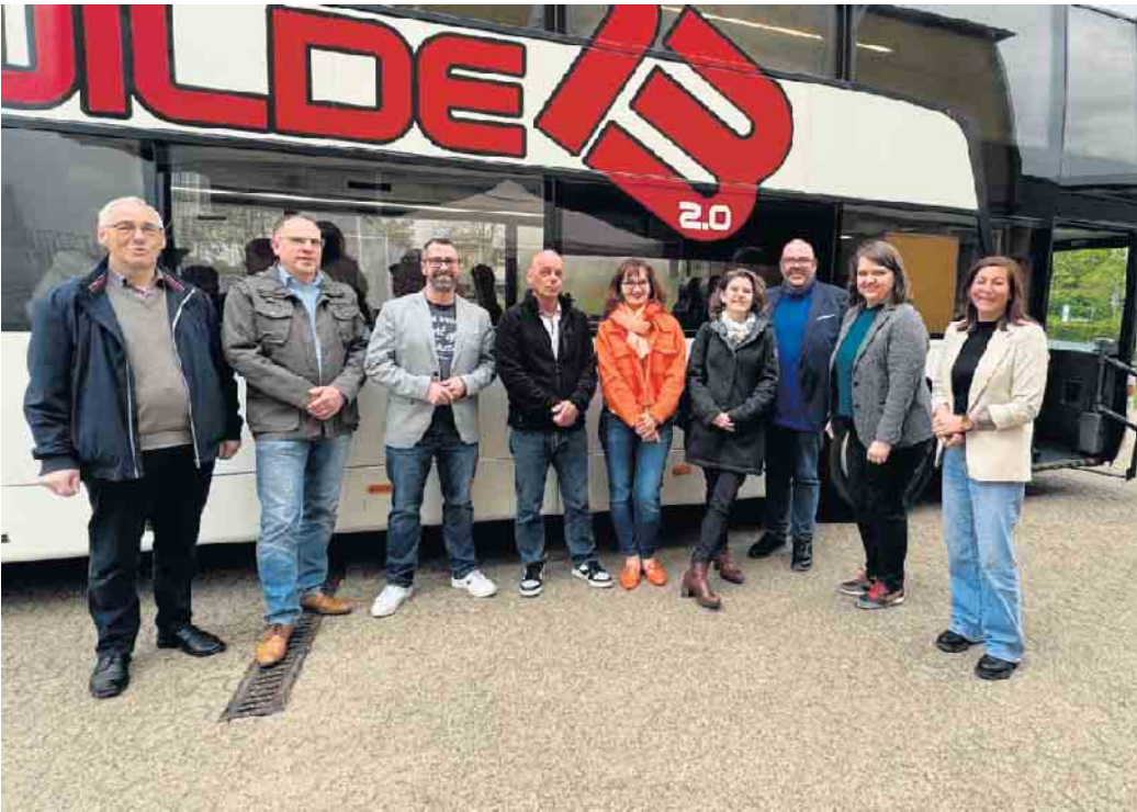
Der Jugendbus „Die Wilde 13 2.0“ unterstützt die Kinder- und Jugendarbeit in Vettweiß.

Seit Januar steht der Bus in Vettweiß an der Regenbogenschule beziehungsweise an dem Mehrgenerationenpark und das Angebot wird von den Kindern sowie Jugendlichen sehr gut angenommen. „Der Bus wird vor allem aufgrund eines hohen Zuzugs von jungen Familien mit Kindern eingesetzt. Er bietet jungen Menschen eine einzigartige Plattform, um sich zu entfalten, Freundschaften zu knüpfen und gemeinsam Abenteuer zu erleben. Wir sind stolz darauf, mit diesem Angebot die Jugendlichen unserer Region zu unterstützen und zu fördern“, betont