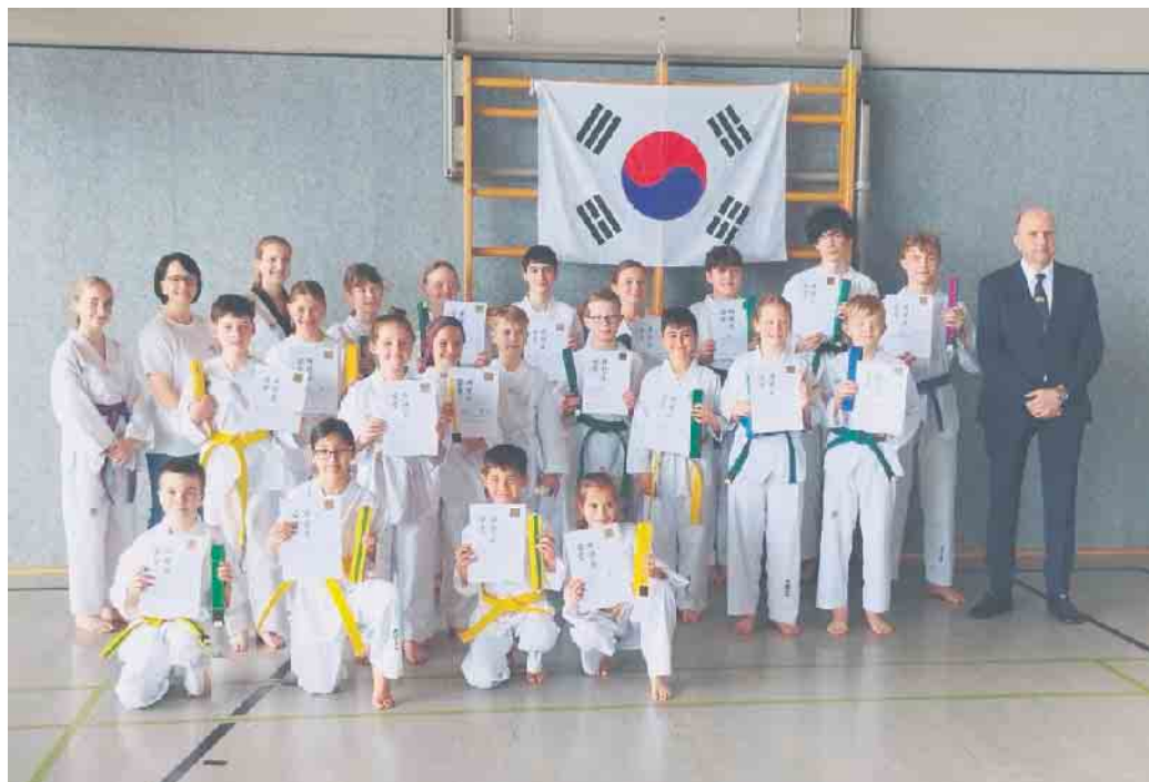
Die Prüflinge mit Prüfer und Co-Trainern

Wir bieten wieder Schnuppertraining an, Kontaktdaten siehe: www.taekwondo-embken.de