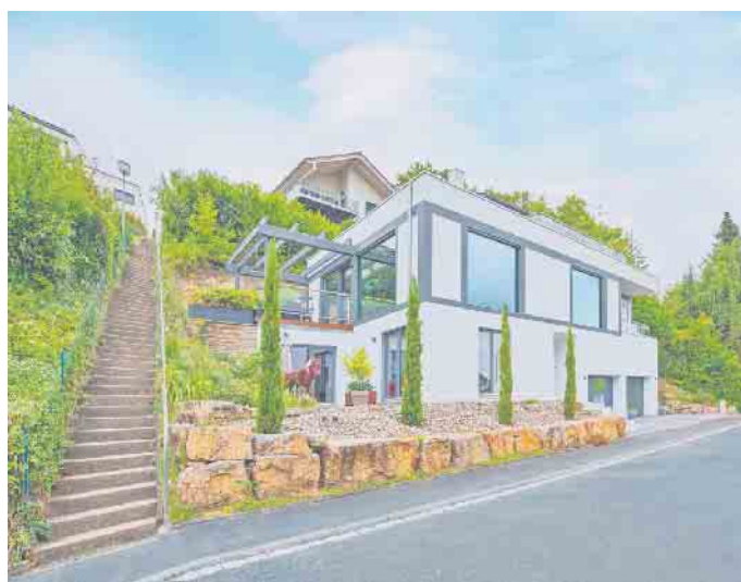
Fertiggeller sind ein sicheres Fundament für den Hausbau am Hang und bieten gegenüber kellerlosen Häusern dauerhaft mehr Wohnkomfort und Flexibilität. Ihr Keller.

kosten gegenüber einem kellerlosen Haus von etwa 20 Prozent. Das rechnet sich nicht nur für den Bauherrn, sondern ist auch allgemein nachhaltig: Das Mehr an Wohnfläche erfordert kein größeres Grundstück, weil in die Tiefe statt in die Breite gebaut wird. Auch bleibt rund ums Haus mehr unbebaute bzw. unversiegelte Fläche für einen blühenden Garten. Kellerexperte Braun merkt an: „Auch wer ohne Keller baut, muss natürlich in Erdarbeiten und ein Fundament investieren - hierfür fallen Kosten an, die gegenüber dem langfristigen Mehrwert und der Nachhaltigkeit eines Kellers mit Sinn und Verstand abgewogen werden sollten“, so der Experte. Unterschätzt werde häufig auch der tatsächliche Bedarf an Nutz- und Lagerfläche, der gerade bei kellerlosen Häusern dann im Nachhinein durch kostspielige und platzinehmende Notlösungen wie zum Beispiel Gartenhäuser oder eine umfunktionierte Garage zu decken versucht wird. Eine Möglichkeit für eine kosteneffiziente Hausplanung, die dem gewünschten Komfort eines Eigenheims dennoch ganz und gar gerecht wird, kann zum Beispiel