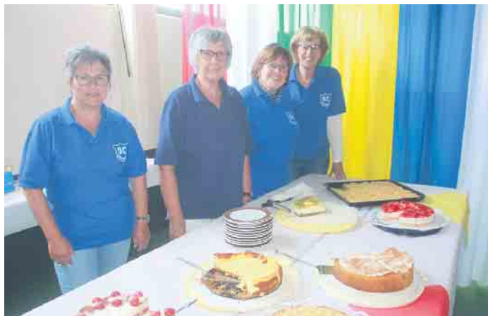
Die Cafeteria lockte mit Kaffee und selbstgebackenem Kuchen

wie man es in Disternich nicht anders gewohnt ist. Damit lässt sich der „Vatertag in Disternich“ am besten beschreiben. Die kleinen Gäste konnten sich auf der Hüpfburg vergnügen.