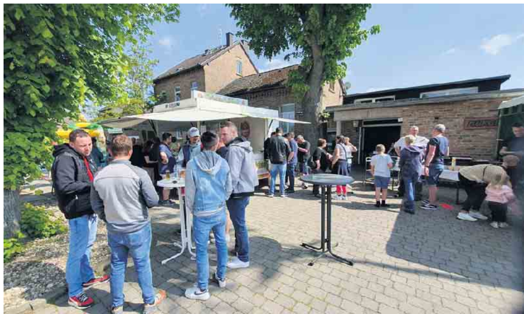
Kaltes Bier, gute Musik und viele Spiele und Unterhaltung für die Kinder - Damit lässt sich „Vatertag für die ganze Familie“ des Bürgervereins LUXHEIM e. V. am besten beschreiben

Kaltes Bier, gute Musik und viele Spiele und Unterhaltung für die Kinder, damit lässt sich „Vatertag für die ganze Familie“ des Bürgervereins LUXHEIM e. V. am besten beschreiben. Viele Leute fanden auch den Weg zur örtlichen Bürgerhalle. Dabei war das Einzugsgebiet groß. Ob nun umliegende Ortschaften oder auch diejenigen, die auf der Durchreise waren. Alle haben den Weg zum Vatertagstreffen gefunden. Bei erfrischenden Getränken und allerlei Köstlichkeiten vom Grill, aber auch süßen Leckereien wie Kaffee und Kuchen, konnte an und in der Bürgerhalle gut verweilt werden. So war für jede Altersgruppe etwas geboten. Der Bürgerverein LUXHEIM e.V. dankt allen Helferinnen und Helfern sowie den Gästen für das zahlreiche Erscheinen. FH