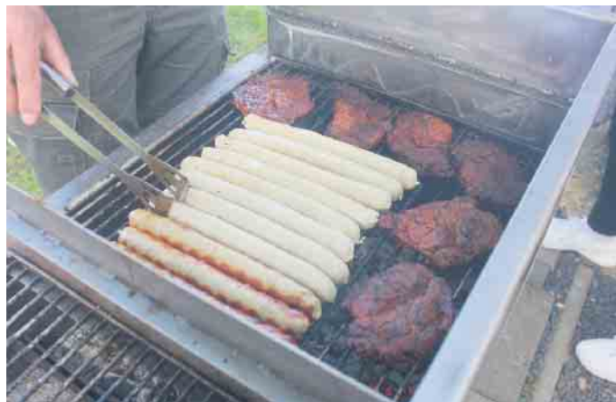
Für den kleinen Hunger zwischendurch sorgten die leckeren Spezialitäten vom Grill

ti Himmelfahrt. In manchen Kalendern ist auch „Vatertag“ vermerkt - eine Art Pendant zum Muttertag am zweiten Mai-Sonntag. Eigentlich nur bedingt und eingeschränkt. Jedenfalls freuen sich viele Menschen einfach nur über ein verlängertes Wochenende und den oft freigenommenen