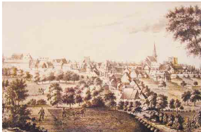
Stadtansicht von 1880

man das Loch zudeckte. Erst viel später besann man sich des angefangenen Baues. Bei Öffnung fand sich jedoch nur eine übelriechende, trübe Flüssigkeit, die sich als Abwasser aus dem Keller einer nahen gelegenen Brauerei herausstellte. Der Brauer wollte es sich einfach machen, musste aber jetzt für die Reinigung sorgen. Dieser Brunnen ist also kein „echter“. Zu erwähnen sind noch einige verstreute so genannte Maare; hierbei muss es sich um mehr oder weniger große Tümpel gehandelt haben, die Wasser nur bei Niederschlag führten und sehr bald stark verschmutzt waren. Der Brunnen auf der Burg, ca. 90 Meter tief, diente nur zur Versorgung der Burgbewohner, obwohl die Nidegger Bürger zum sehr mühseligen Wasserschöpfen herangezogen wurden (es dauerte eine Viertelstunde, einen Eimer Wasser heraufzuzie-