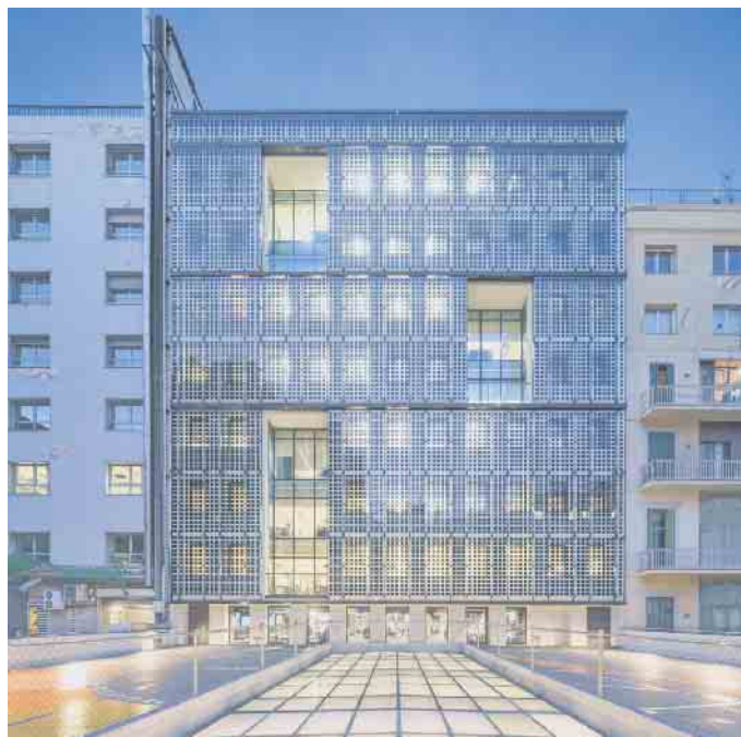
Gut für Klimabilanz und Energieausbeute: Eine vorgehängte BIPV-Lösung an der Fassade einer Gewerbeimmobilie.