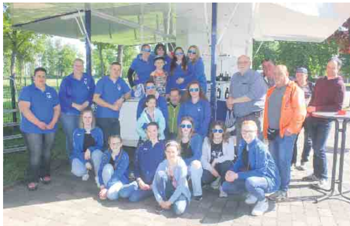
Die Karnevalsgesellschaft Löstige Möscheme lud zum ersten Vatertagsfest nach Müddersheim

Auf dem Parkplatz vor dem Dorfgemeinschaftshaus in Müddersheim war richtig was los. Gleich wenn am selben Tag in anderen Orten auch groß gefeiert wurde, hielt dies die Karnevalsgesellschaft „Löstige Möscheme 1972 e. V.“ nicht ab, eine Premiere zu feiern. Zum ersten Mal in Müddersheim: ein Vatertagsfest. Das Pendant im benachbarten Disternich sollte ei-