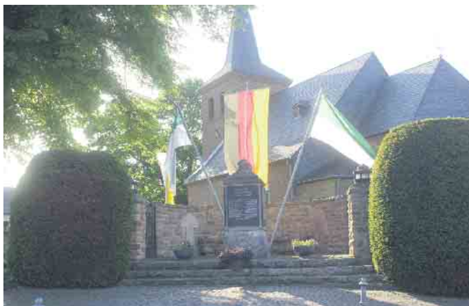
Die Ortschaft Gladbach erstrahlte Mitte Mai wieder in den Farben Grün und Weiß. Endlich stand wieder ein Schützenfest in Präsenz und gewohnter Weise an - auch das Ehrenmal glänzte