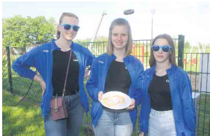
Die Große Garde bot frische Waffeln an

gentlich alle zwei Jahre stattfinden. Die Müddersheimer KG wollte dann in dem Jahr dazwischen ein Fest auf die Beine stellen. Jedoch findet nun bisher jedes Jahr auch ein Fest in Disternich statt. Konkurrenzgedanken kommen aber in keinsten Weise auf. Nimmt man sich doch keine Gäste weg, eher sieht man es als Station, wo man nach und nach den Vatertag