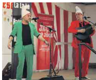
Das Duo „Firlanz“

jetzt die Karnevalskünstler von morgen erleben und feiern möchten, sind auch vielleicht im nächsten Jahr herzlich eingeladen. Dann heißt es in Lütke-Weiß, wenn möglich, wieder: Jeck op Jöck. FH