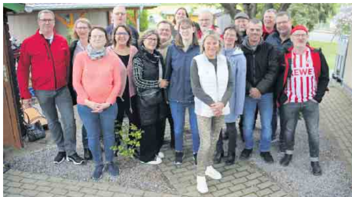
Zehn Jahre Dorfladen - auch das überwiegend ehrenamtliche Team feierte dies ordentlich

10-jähriges Jubiläum im Dorfladen Wollersheim