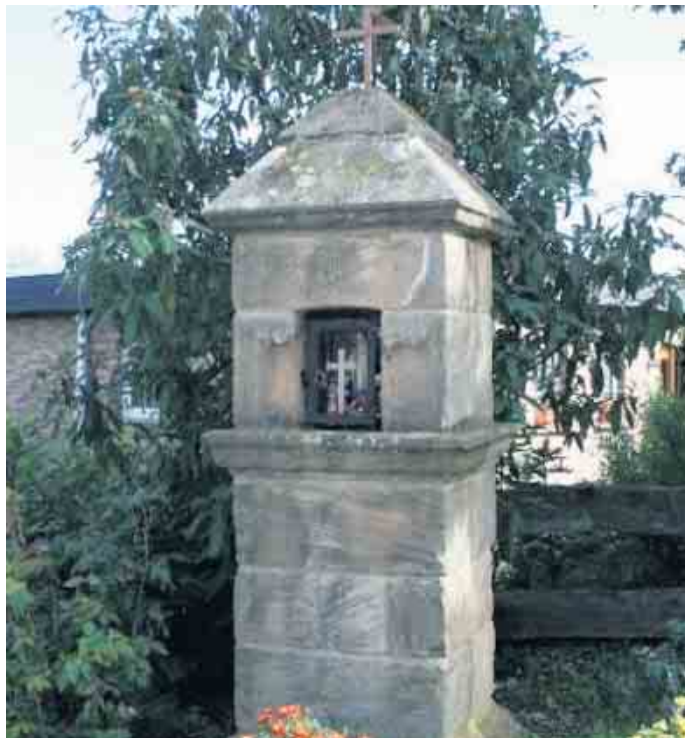
Bildstock Ecke Titzgarten, Quelle: Denkmalschutzliste Gemeinde Kreuzau