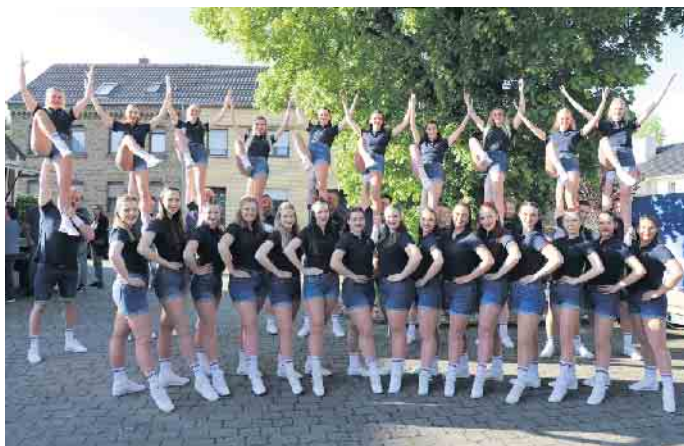
Den Programmanfang machte das Tanzcorps „Kölsche Vita“. Die Tänzerinnen und Tänzer lieferten auf der Bühne ein Feuerwerk an ihren Sessionstänzen nach dem anderen ab