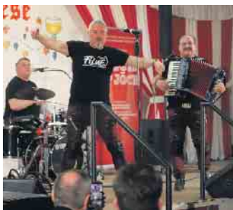
Jeck op Jöck: die „Filue“ begeisterten auf der Bühne in Lütke-Weiß

jetzt die Karnevalskünstler von morgen erleben und feiern möchten, sind auch vielleicht im nächsten Jahr herzlich eingeladen. Dann heißt es in Lütke-Weiß, wenn möglich, wieder: Jeck op Jöck. FH