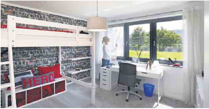
Moderne Fertiggeler sind darauf ausgelegt, dass sie dem Bauherrn hochwertige Wohnfläche und hohen Wohnkomfort bieten.“

Erwärmte und „verbrauchte“ Luft enthält mehr Feuchtigkeit als kühle Luft. Daher sollte die Wohnung und auch der Keller dann gelüftet werden, wenn es draußen möglichst kühl und trocken ist, um feuchte und feucht-warme Raumluft durch nachströmende kühle Luft auszutauschen. Keller ohne automatische Be- und Entlüftung, müssen manuell gelüftet werden - am besten ein- bis zweimal täglich für bis zu zehn Minuten je nach Wetterlage und Außentemperatur. Grundsätzlich empfiehlt sich eine Luftfeuchtigkeit im Wohnkeller von etwa 50 bis 60 Prozent und eine Raumtemperatur von mindestens 18 Grad. Selbst in einem reinen Nutzkeller sollte sich die Luft nicht unter 14 Grad abkühlen. Nicht gelüftet werden sollte an feucht-warmen Tagen, vor oder nach einem Gewitter sowie bei Nebel, da der Luftaustausch durch die geöffneten Fenster dann schnell zu einer erhöhten Luftfeuchtigkeit im Untergeschoss führen kann. „Moderne Fertiggeler sind darauf ausgelegt, dass sie dem Bauherrn hochwertige Wohnfläche und hohen Wohnkomfort bieten. Richtiges Lüften und Heizen sind dafür wie überall in der Wohnung entscheidend“, schließt Geisser. GÜF/FT