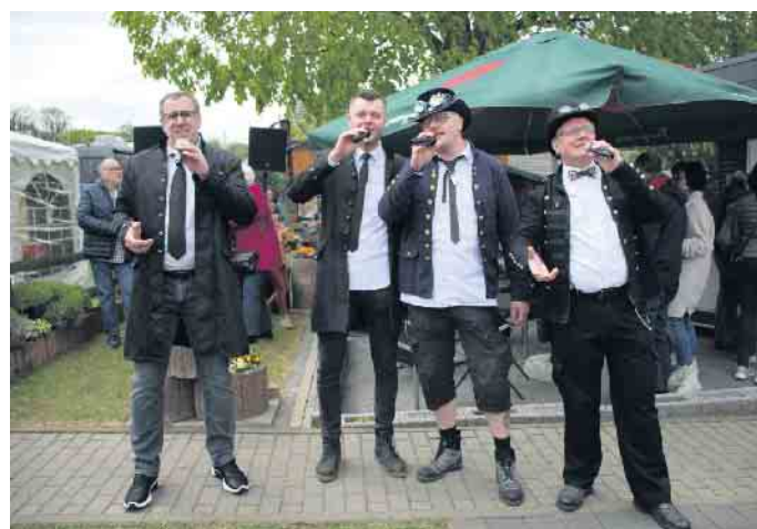
Musikalisch gratulierten die Lokalmatadore von „Us em Lääve“