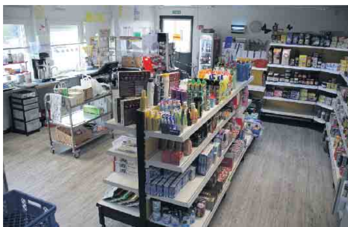
Der Dorfladen wirkt individuell und gemütlich. Neben den typischen Supermarktartikeln werden auffällig viele regionale Produkte angeboten

Zu den Stammkunden gehören heute nicht nur die Genossenschaftsmitglieder und ihre Angehörigen. Auch Durchreisende kommen gern. Der Dorfladen ist so auch zu einem Treffpunkt des Ortes geworden. FH