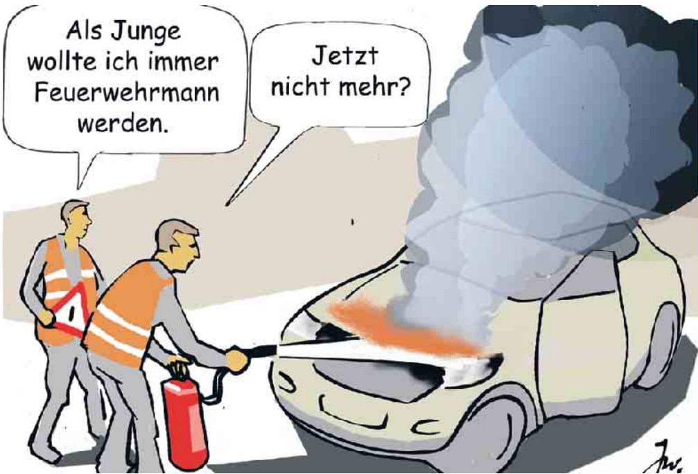
Ein Brandherd in einem Kfz kann sich durch auslaufenden Treibstoff sehr schnell ausbreiten.

Allerdings kann sich ein Brandherd in einem Kfz durch auslaufenden Treibstoff sehr schnell ausbreiten. Entzündet wird der Treibstoff dabei meist durch Funken oder einen Kurzschluss in der Elektronik bzw. die heißen Motortemperaturen, die auch Schmierstoffe in Brand setzen können. Ausgehend vom Motorraum kann ein Feuer dann schnell zu einer tödlichen Gefahr für Autoinsassen werden. Was soll man also tun, wenn das Fahrzeug brennt? Wenn sich ein Brand durch Qualm oder Brandgeruch ankündigt empfiehlt es sich, umgehend anzuhalten - am besten auf dem Seitenstreifen oder am rechten Fahrbahnrand - die Warnblink-