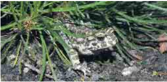
Wechselkröte, hier ein Weibchen

Sie finden den Link auch auf der Homepage der Biologischen Station im Kreis Düren unter der Rubrik Projekte/Wechselkröte oder Sie scannen den QR-Code. Wenn Sie kürzlich oder im vergangenen Jahr irgendwo eine Wechselkröte gesichtet oder gehört haben, kontaktieren Sie bitte maike.guschal@biostation-dueren.de oder dagmar.ohlhoff@biostation-dueren.de . Gerne können Sie auch ein Foto mit-schicken, das uns die Bestimmung zu erleichtern hilft.