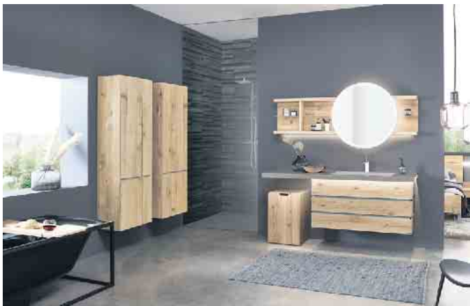
Gerade im Badezimmer herrscht temporär eine hohe Luftfeuchtigkeit mit der Massivholzmöbel gut umgehen können.

Daher ist es nicht verwunderlich, dass heute viele Einrichter bevorzugt Möbel aus massivem Holz auswählen, denn das Naturmaterial ist atmungsaktiv, verbessert die Luftqualität und ist ein wahrer Segen für Allergiker.“ (IPM/RS)