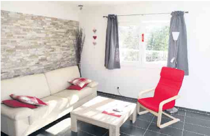
Richtiges Lüften und Heizen sind in allen Bereichen der Wohnung maßgeblich für ein behagliches Raumklima. Stoßlüften ist einem gekippten Fenster auch im Keller unbedingt vorzuziehen.

schiedlichen Faktoren ab. Hierzu gehören die Jahreszeit und das Wetter sowie vor allem die gewählte Bauweise. Die Betonelemente eines Fertiggellers werden in einer Härtekammer vorgehärtet, wodurch sich der Feuchtegehalt in den Bauteilen von Anfang an verringert. Ein ausreichendes Lüften und gegebenenfalls Heizen der Kellerräume durch den Bauherren beschleunigt die weitere Aushärtung. Florian Geisser von der GÜF empfiehlt: „Acht Wochen nach Fertigstellung des Rohbaus sollten Bauherren mindestens abwarten, bevor sie mit dem Ausbau des Kellers beginnen. Im Zweifelsfall besser ein bis zwei