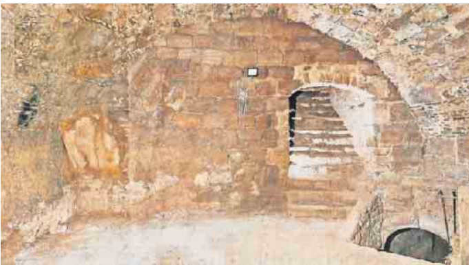
Küchenerker unter dem Palas