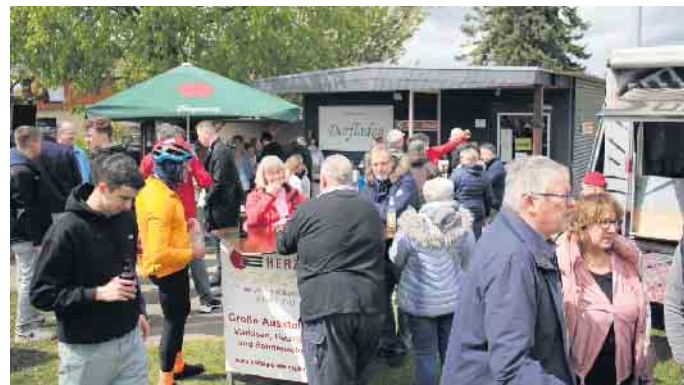
Bei frühlingshaften Temperaturen wurde mit vielen Kundinnen und Kunden auf dem Platz vor dem Dorfladen gefeiert

Der Dorfladen von Wollersheim feiert sein zehnjähriges Bestehen. Als Mitte der 90-er Jahre der letzte Laden schloss, dies war die Bäckerei Schuhmacher, gab es keine Möglichkeiten mehr im Ort einzukaufen. Es dauerte jedoch circa 20 Jahre bis die Idee zu einem neuen Dorfladen entstand. Nach einigen Versammlungen stand dann fest, dass es einen Dorfladen in Wollersheim geben sollte. Man gründete eine Genos-