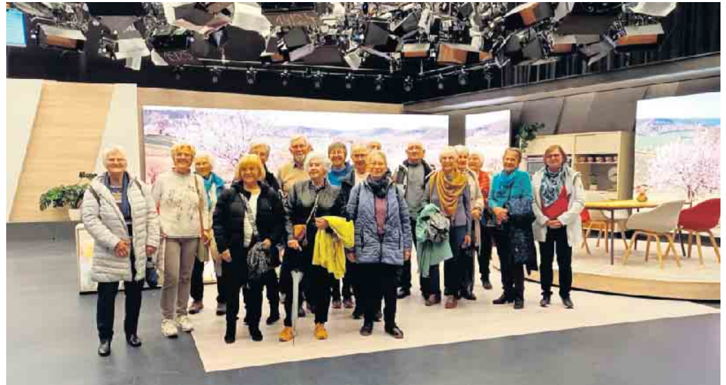
Senioren des Turnclubs Kreuzau in einem Studio beim WDR in Köln