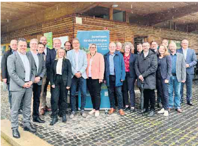
Die Mitglieder der hwsErft trafen sich anlässlich des zweijährigen Bestehens der Kooperation an der Gymnicher Mühle