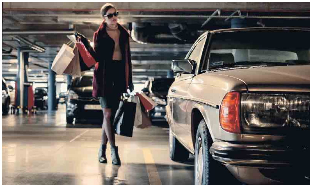
In Parkhäusern ist Vorsicht und gegenseitige Rücksichtnahme notwendig.

Daher sind beim Fahren im Parkhaus Vorsicht und gegenseitige Rücksichtnahme notwendig. So sieht es die Straßenverkehrsordnung vor. Das heißt: Die Fahrweise muss den besonderen Bedingungen im Parkhaus angepasst werden. Langsam und umsichtig zu fahren, ist gerade in sehr engen Parkhäusern wichtig. Blickkontakte und Handzeichen sind gute Möglichkeiten, um sich hier mit anderen zu verständigen. Gehört das Parkhaus einem Privatunternehmen, kann dies zusätz-