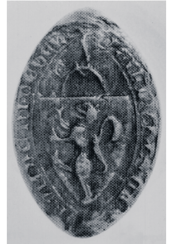
Schöffensiegel der Stadt Nideggen