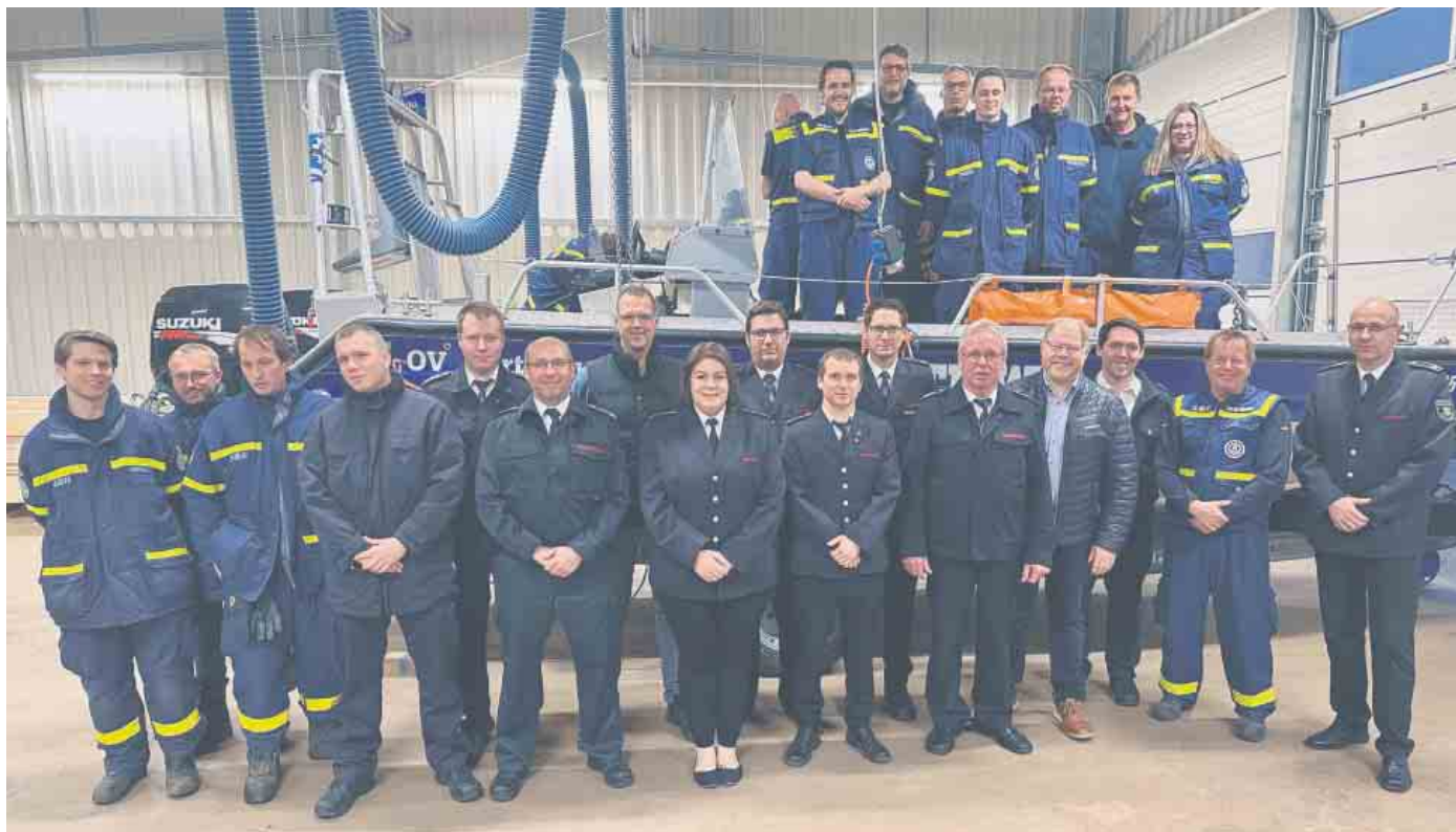
Gemeinde Hürtgenwald, Feuerwehr und ortsansässiges THW arbeiten beim Katastrophenschutz Hand in Hand.

Die finanziellen Hürden für eine THW-Unterstützung sind bei weitem nicht mehr so sperrig