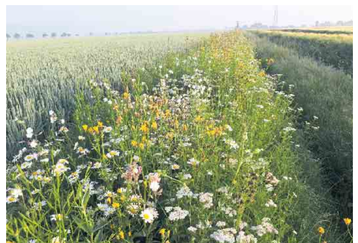
Blühstreifen an einem Wegrand in Kelz im Kreis Düren.