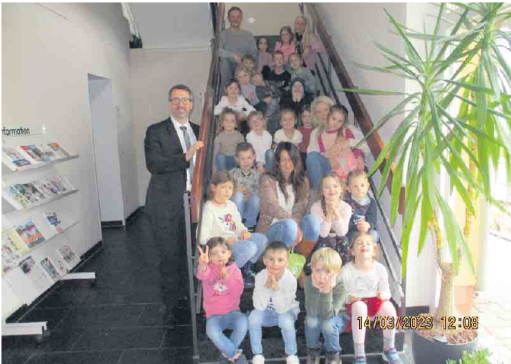
Vorschulkinder der Kindertagesstätte Abenteuerland Vettweiß