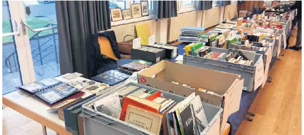
Bücherbörse 2024 in der Festhalle Kreuzau.