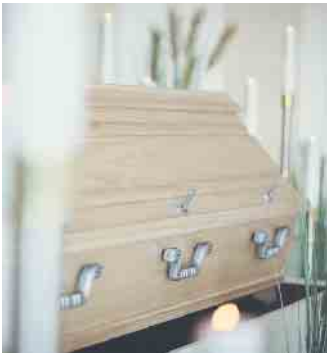
Für sehr große und sehr schwere Menschen gibt es maßangefertigte Särge.

desverband Deutscher Bestatter e. V. bietet über die Deutsche Bestattungsvorsorge Treuhand AG und das Kuratorium Deutsche Bestattungskultur GmbH die Absicherung von Bestattungsvorsorgeverträgen an. (akz-o)