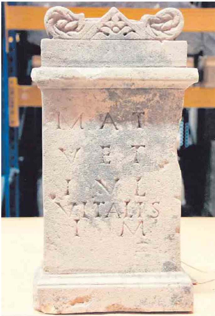
Matronenstein im Kirchbusch Abenden, Foto: LVR-Museum Bonn

Margot und Jochen Groß www.die-zwei-nideggen.de