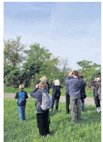
Der Vogelbestimmungskurs begeistert Jung und Alt

Benötigte Utensilien: Fernglas, festes Schuhwerk, ggf. Vogelbestimmungs- und Notizbuch