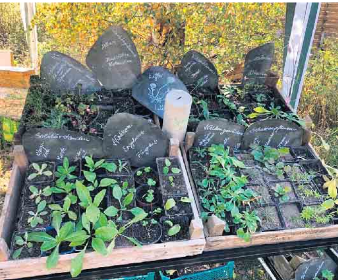
Biologische Station im Kreis Düren e.V.

Nachdem das Pilotprojekt „Pflanzentauschbörse“ im letzten Jahr so großen Anklang fand und viele Pflanzen neue Besitzer gefunden haben, wird es auch in diesem Jahr wieder eine Börse auf dem Frühlingsfest zwischen den Toren von Nideggen, am Sonntag, den 16. März 2025, von 11 bis 18 Uhr geben. Gemeinsam mit den Blumenfreunden Muldenau dürfen Sie wieder Pflanzen und Saatgut für Garten, Balkon oder Fensterbank mitbringen und tauschen oder einfach nur so vorbeikommen und vielleicht den ein oder anderen Schatz für das eigene Grün finden. Wichtig: Die mitgebrachten Pflanzen in Töpfen beschriften und wenn möglich Blühzeitpunkt und Blütenfarbe draufschreiben. Ergänzt wird das Angebot durch einen gemeinsamen Stand der Stadt Nideggen zu den Themen Stadtentwicklung und Klimaschutz, der Blumenfreunde Muldenau und der Biologischen Station im Kreis Düren e.V. direkt auf dem Parkplatz am Zülpicher Tor. Für Kinder und Erwachsene gibt es hier viel Wissenswertes zu unserer Natur in Nideggen und Umgebung und den Stadtentwicklungs- und Klimaschutzmaßnahmen vor Ort zu entdecken und auszuprobieren. Wir freuen uns auf Sie! Das Team Stadtentwicklung Stadt Nideggen, die Blumenfreunde Muldenau & die Biologische Station Kreis Düren