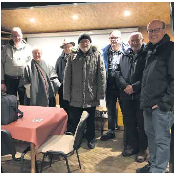
Für die Teilnehmer hat sich der Abend gelohnt!

Die Mitglieder des Ortsverbandes Rureifel treffen sich zurzeit jeden ersten Freitag im Monat um 19 Uhr im Landgasthof Stollenwerk, Im Hech 4, 52152 Simmerath - Steckenborn. Besucher sind herzlich willkommen. Informationen zum Ortsverband Rureifel finden Sie unter http://www.darc.de/g26 .