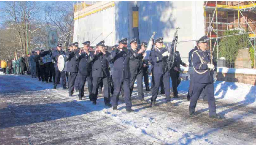
Umzug vor ungewohnter Kulisse: Die Nidegger Kirche wird derzeit umfassend saniert

Beginn für den gemütlichen Teil mit vielen Gesprächen und einem Ende erst am späten Abend. Die Nidegger Schützen danken allen, die den Tag vorbereitet und mitgefeiert haben - dem Pfarrteam, den Messdienerinnen, allen Musikern aus Berg und Vlaten und dem ehrenamtlichen Serviceteam an einem festlichen Tag.