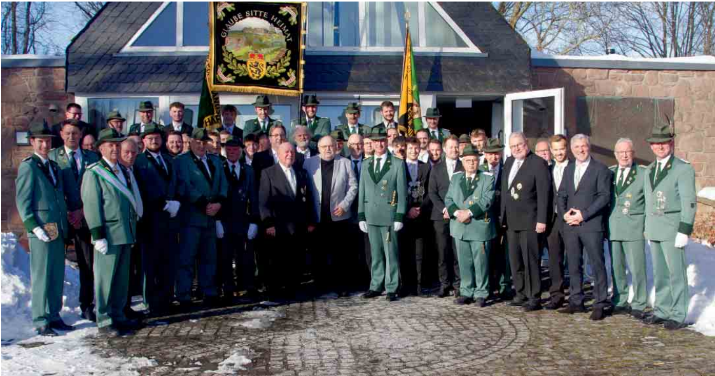
Ehrengäste, Jubilare & Co - das traditionelle Gruppenfoto

Ansprachen, Ehrungen und Neuaufnahmen im feierlichen Rahmen