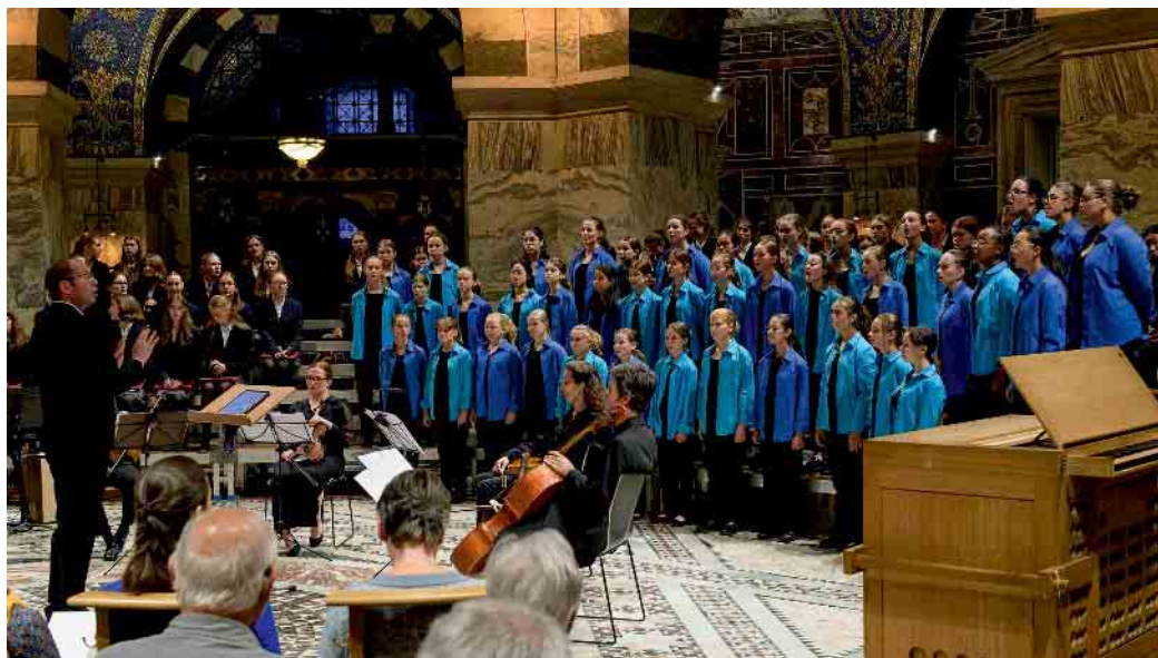
Mädchenchor am Aachener Dom

Der Mädchenchor am Aachener Dom ist das jüngste Ensemble in der Familie der Aachener Dommusik. Er wurde vom