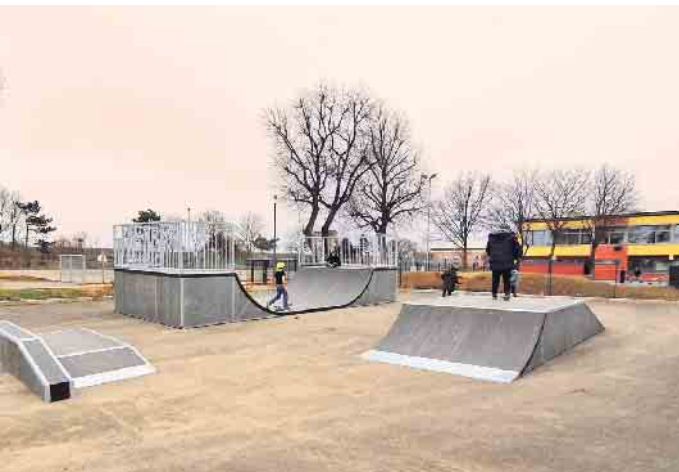
Die neue Anlage verfügt über verschiedene Hindernisse

sehr erfahren und darauf spezialisiert sind. Finanziert wurde die Minipipe der Anlage durch einen Zuschuss der Kleinprojekte aus dem Regionalbudget der LEADER Region Zülpicher Börde, mit einem Fördersatz von 80%. Das Land NRW bietet mit der Richtlinie über die Gewährung von Zuwendungen zur Förderung der Strukturentwicklung des ländlichen Raumes für die LEADER Regionen