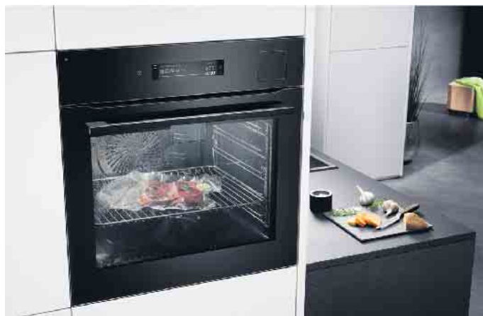
Sehr energieeffizient (A++) und zudem WLAN-fähig. Dieser Dampfbackofen - u. a. mit Kochassistent, Kerntempersensor und Sous-Vide-Funktion - ist mit einer integrierten Videokamera im Türgriff ausgestattet.

Hybrides Arbeiten mit wechselnden Aufenthaltsorten erfordert auch ein flexibles Wäschepflegemanagement. Hierbei unterstützen smarte Waschmaschinen und Trockner mit cleveren Funktionen: z. B. indem die Waschmaschine alle wichtigen Einstellungen des letzten Waschgangs an ihr Pendant - einen smarten Wäschetrockner - sendet, der daraufhin das optimal passende Programm wählt und seine Besitzer per Push-Nachricht informiert, wenn die Wäsche fertig ist. „Wer für seine