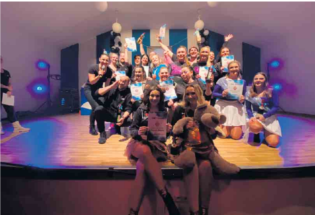
Die Teilnehmer hatten viel Spaß