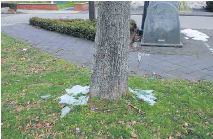
Zerschlagene Glasscheiben am Sammelcontainer

Ende Januar wurde eine Scheibe, die am Glascontainer stand von mehreren Jugendlichen an einem Baum zerschlagen. Das Ganze fand in der Nähe des Kindergartens statt. Solche Aktionen bergen ein hohes Gefahrenpotential, besonders an diesem Standort. Ob ein Kind fällt oder ein Hund hineintritt, Schnittwunden und Verletzungen sind hier vorprogrammiert. Das gilt auch für die, die nun die entstandenen Glasscherben entsorgen müssen. So etwas ist absolut verantwortungslos und unnötig. Alles was nicht durch die Öffnung passt, gehört nicht dort hinein. In den Altglas-Container gehört nur sogenanntes Behälterglas wie Flaschen, Konservengläser usw. Auf keinen Fall dürfen Porzellan und Keramik, Bleikristallgläser und andere Trinkgläser sowie temperaturbeständiges Glas wie Backofengeschirr in den Container. Auch Flachglas, Fensterscheiben oder Spiegel dürfen nicht hinein. Verschiedene Glasarten schmelzen bei unterschiedlichen Temperaturen, weshalb eine Trennung an dieser Stelle wichtig ist.