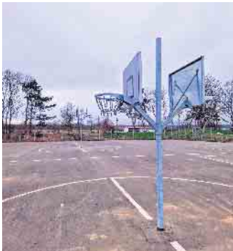
Zwei neue Doppelkörbe können auf dem Gelände bespielt werden.

Die Basketballkörbe auf dem asphaltierten Platz der Kiss & Go Zone, direkt neben der Schule in Vettweiß sind im vergangenen Jahr abgebaut worden. Im Rahmen der TÜV Überprüfung wiesen sie Mängel auf, die vielen Jahre der Intensiven Nutzung hatten ihre Spuren hinterlassen. Nun wurden sie durch neue ersetzt. Die Firma Product Spiel-Sport-Freizeit hat die neuen Körbe aufgebaut. Der Hobby-Basketballplatz verfügt nun über zwei linierte Felder, die beidseitig mit zwei Doppelkörben bespielt werden können, einen niedrigen und einen höheren Korb. Die Basketballanlage verspricht ultimativen Spielspaß, unvergessliche Dunks und jede Menge Action. Ab sofort können alle Interessenten den Bällen hinterherjagen, präzise Würfe trainieren und gemeinsam Höchstleistungen erzielen. Die regelmäßige Bewegung schafft gesundheitliche und soziale