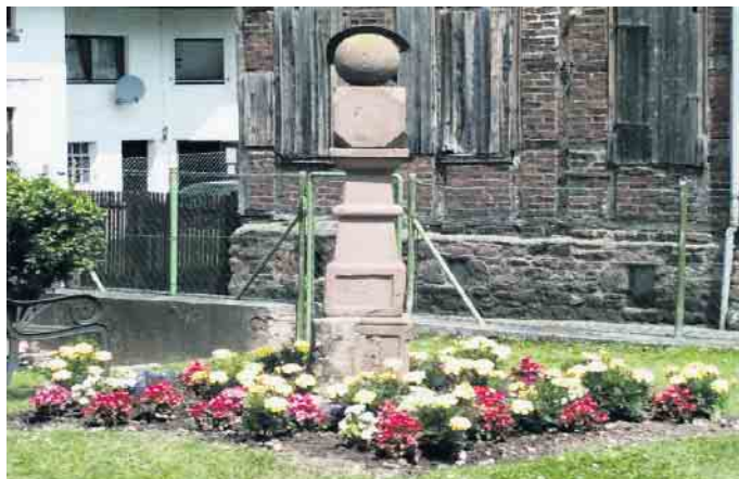
Sonnenuhr im Garten in Abenden

Abenden. Mir gegenüber stand die alte Kapelle St. Martinus, bis sie durch eine größere Kirche am Friedhof ersetzt wurde. Später stellte man zur Erinnerung ein Steinkreuz an dieser Stelle auf. All die Jahre wurde ich liebevoll von den Besitzern gepflegt und meine drumherum gepflanzte Blütenpracht wurde von den Vorbeigehenden bewundert. Auch wurde diskutiert, was ich wohl darstelle. „Ich bin doch eine Sonnenuhr“, erkennt man doch eindeutig an meiner Gestalt. Es war eine herrliche Zeit, alles veränderte sich, bei mir wurden nach Jahreszeiten die Blümchen ausgewechselt. Doch eines Tages musste für mich ein neuer Standplatz gefunden werden, in meinem geliebten Garten durfte ich nicht länger bleiben. Nach langer Suche wurde ein sicherer, geeigneter Standort gefunden und zwar in der großen Kirche, der Nachfolgerin