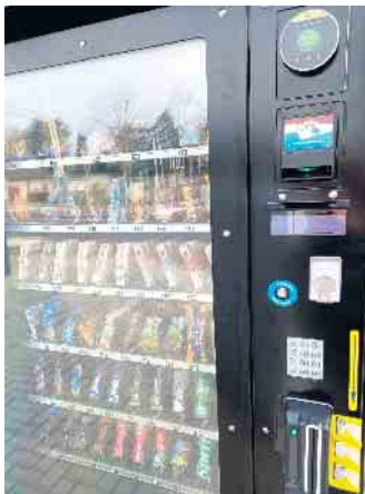
Snackautomat an der Bahnstation in Vettweiß

Seit vergangener Woche bereichert ein Verkaufsautomat die Bahnstation der Bördebahn im Zentralort Vettweiß. Er bietet Reisenden eine bequeme Möglichkeit, den kleinen Hunger zu stillen. Strategisch platziert in der Nähe des Wartebereiches, sorgt er 24/7 für schnellen Zugang zu einer Vielzahl von Snacks. Pendler können so ihre Reise genießen, ohne weit gehen zu müssen. Die Auswahl an Snacks umfasst 50 verschiedene Produkte. Von eiskalten Energy- und Softdrinks über diverse Schokoriegel bis hin zu Raucherbedarf, ist alles dabei. Geplant ist ein wechselndes Sortiment, je nach Bedarf. Der moderne Automat verfügt über einen Münzeinwurf und bietet zudem die Möglichkeit des bargeldlosen Zahlens an. Eine Altersfreigabe wird z.B. beim Kauf des Raucherbedarfs über den