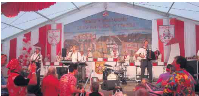
Für die „Klüngelköpp“ war es ein leichtes die Stimmung im Festzelt hoch zu halten

türmern“ den Schlusspunkt eines abwechslungsreichen karnevalistischen Männerstammtisches. FH