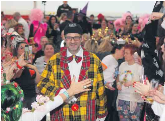
Dä Blötschkopp nach 10 Jahren wieder im Zelt - was ein Gefühl