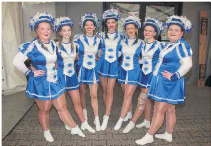
Tänzerisch überzeugte die Garde der KG Verdötschte Glabige 1951 e.V.

Programm der Spitzenklasse zusammen zu stellen. Viele der Anwesenden waren erneut so von der Sitzung begeistert, dass sie bereits jetzt ihre Teilnahme an der Herrensitzung im nächsten Jahr zugesagt haben. FH