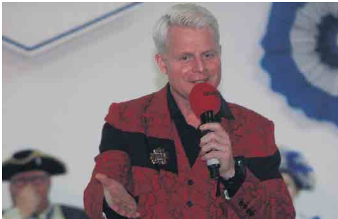
Guido Cantz startete einen Angriff auf die Lachmuskeln der jecken Wiever