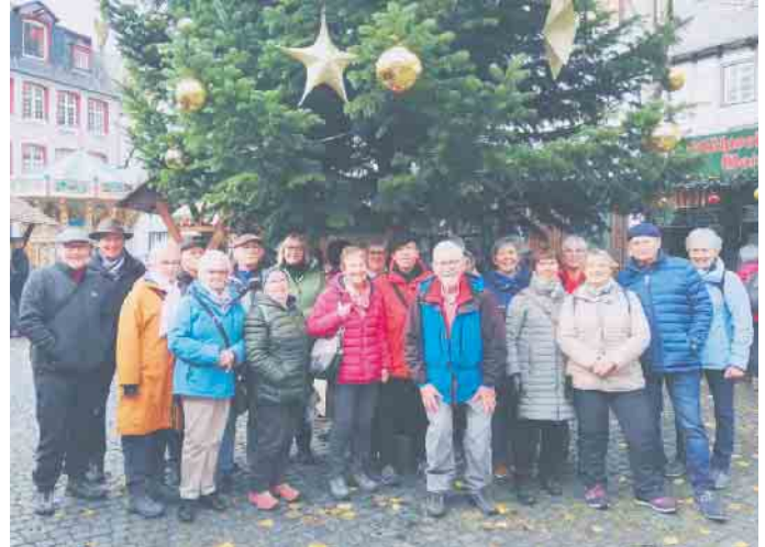
Unter einem guten Stern: Kreuzauer Turnclub-Senioren in Monschau

Kreuzauer Turnclub-Senioren besuchten Weihnachtsmarkt in Monschau