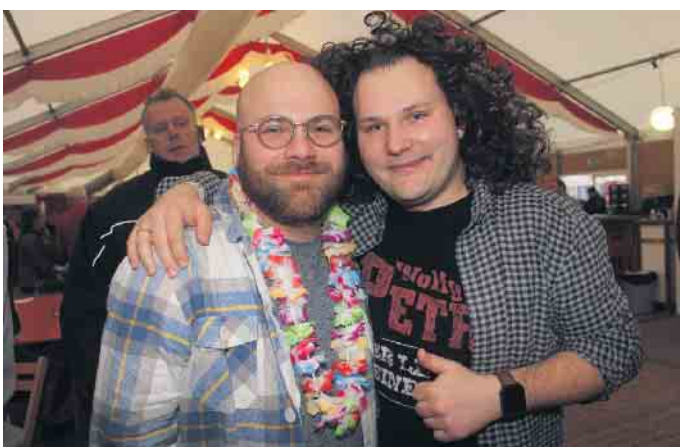
Und dass auch die Männer der Schöpfung gerne nach Vettweiß kommen, dafür ist das ausverkaufte Festzelt am Tannenweg mit 2000 Besuchern der beste Beleg