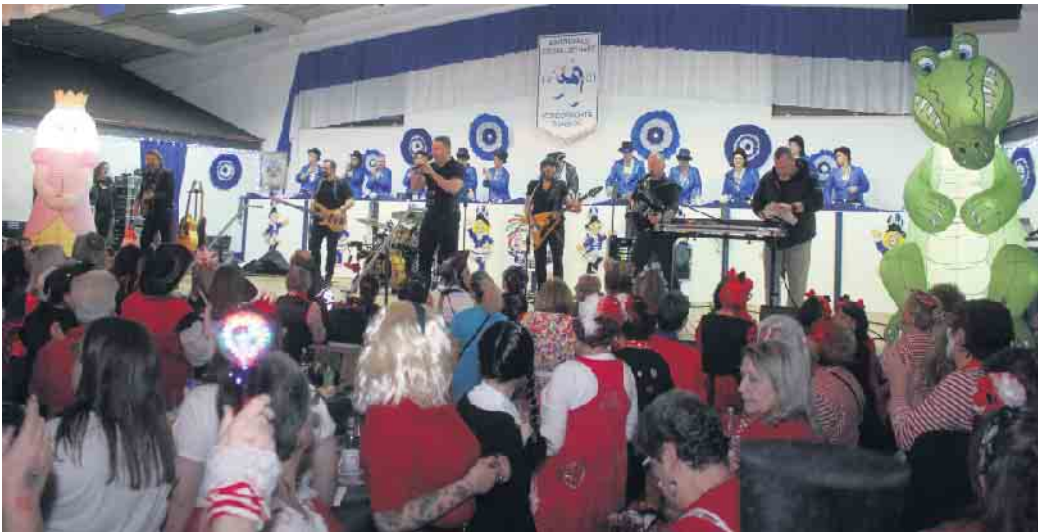
Insgeheimes Highlight der Sitzung waren zweifelsohne die „Höhner“. Neben „Viva Colonia“ oder „Die schönste Stroß“ hatte die Band auch ihren Sessionshit „Prinzessin“ im Gepäck