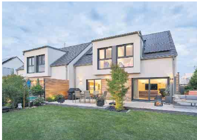
Doppelhaus in Fertigbauweise - das geht achsensymmetrisch oder auch grundverschieden.

nung realisiert. Das Doppelhaus in Fertigbauweise ist sogar noch effizienter, weil es eine Außenwand weniger gibt“, so Hannott. Diese senke die Wohnnebenkosten beider Parteien und gebe bei einem zukunftsicher geplanten Doppel-Fertighaus mit fortschrittlicher Technik wie einer Photovoltaikanlage, einer Wärmepumpe und hauseigenen Speicherbatterie auf Jahre hin Kosten- und Versorgungssicherheit. (BDF/FT)