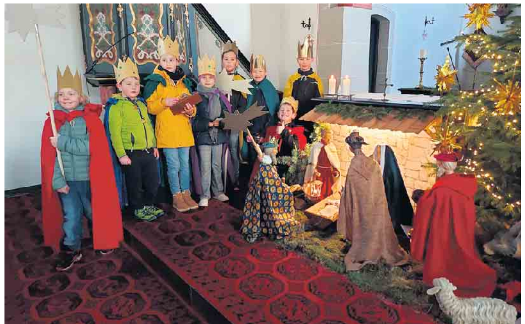
Gruppenfoto Heilige Drei Könige

Zum Abschluss wurde sich mit Nudeln und Hackfleischsauce im Pfarrheim gestärkt und da es auch einige Süßigkeitspenden gab, konnte jedes Kind noch eine süße Belohnung mit nach Hause nehmen.