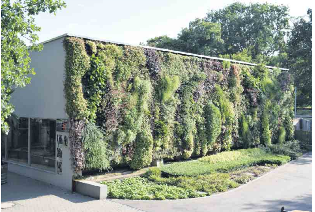
Fassade im Karlsruher Zoo.

Organisiert wird die Vortragsreihe von den Biologischen Stationen der Kreise Düren, Euskirchen, Bonn/Rhein-Erft und der StädteRegion Aachen, die im Rahmen des gemeinsamen LEADER-Projektes „Na-Tür-lich Dorf. Naturschutz vor der Haustür“ bereits seit Mai 2020 Maßnahmen zur Stärkung der Artenvielfalt in den LEADER Regionen Eifel und Zülpicher Börde umsetzen. Seit September 2022 be-