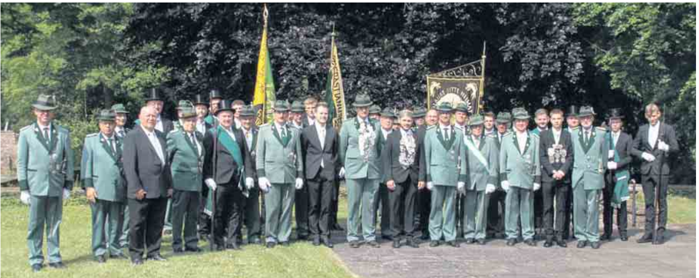
Ein Teil der Nideggener Schützenbruderschaft beim lockeren Gruppenbild im vergangenen Sommer

des offiziellen Teils klingt der Tag dann traditionell in den vielen Freundeskreisen und gastlichen Adressen der Altstadt aus. Liebe Anwohner der Altstadt, darf es am 21. Januar etwas Fahnen-schmuck sein? Wir würden uns freuen! Herzliche Grüße an alle - Ihre St. Sebastianus-Schützenbruderschaft von 1430 e.V.