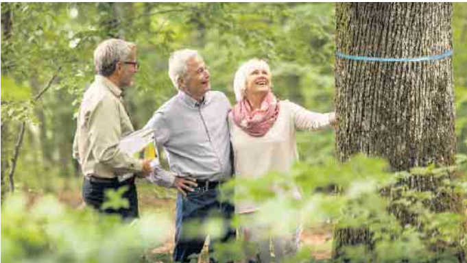
Ein freier Baum, der als Ruhestätte infrage kommt, ist mit einem farbigen Band markiert.

Kostenlose Waldführungen informieren über mögliche Arten einer Grabstätte