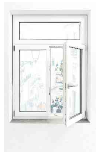
Fenster, die geschlossen und geöffnet Freude machen.

Vor zu hoher Luftfeuchtigkeit schützen auch Fensterfalzlüfter. Diese lassen sich nachträglich in den Fensterrahmen einbauen. Das geht bei vielen Fenstern sehr einfach, sollte jedoch nicht ohne Absprache mit einem Fachbetrieb erfolgen. „Fensterfalzlüfter sorgen für eine kontinuierliche Luftzufuhr, können die Stoßlüftung aber keinesfalls ersetzen“, hebt Frank Lange hervor. Beim Fenstertausch sollten Fensterfalzlüfter eingebaut werden, empfiehlt er.