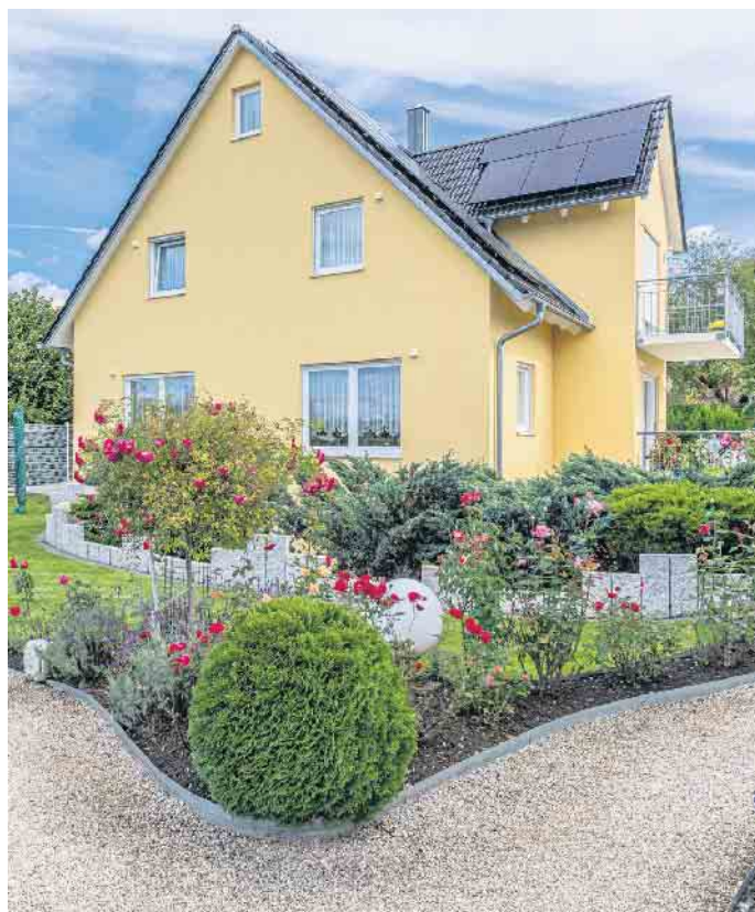
Ob Farben, Putz oder Klinker: Für die Fassadengestaltung können Hausbesitzer aus verschiedenen Möglichkeiten wählen.

Sand, Wasser und Bindemittel ermöglichen die Fassadengestaltung mit Putz in individuellen Optiken. Bei Mineralputz handelt es sich um Trockenmörtel, der mit