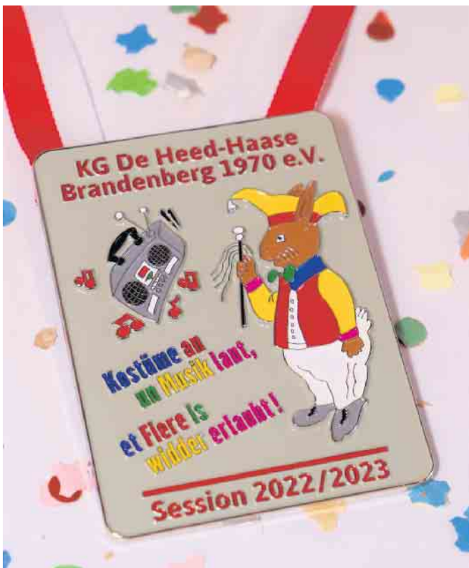
Der Sessionsorden der Heed-Haase

Im Veranstaltungskalender nicht fehlen dürfen die Karnevalsparty am 10. Februar sowie das Familienfest JECK UN WOOSCH. Bei Letzterem laden die Heed-Haase bei jecker Musik, Suppen, Würstchen, Getränken und einer Indoor-Hüpfburg ab 11:11 Uhr an Weiberfastnacht (16. Februar) in's Festzelt. Der traditionelle Kostümball startet am 18. Februar um 20 Uhr und der große Rosenmontagszug beginnt ab 11:11 Uhr sich den Weg durch das Eifeldorf zu bahnen. Weitere Infos sind auf www.heed-haase.de sowie auf deren Facebook-Seite zu finden.