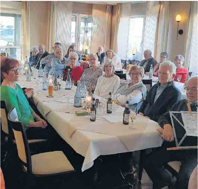
Jahresabschlußfeier im Lokal Wettstein

Schmiedestr. gez.: der Vorstand, i.V. W.Vrölz