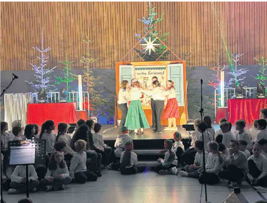
Alle Fünftklässlerinnen und Fünftklässler des St. Joseph-Gymnasiums wirkten am Weihnachtsmusical mit.

Auf dem Schulgelände gab es nach dem Musical Artikel und Speisen aus den besungenen Ländern zu kaufen. Vieles davon wurde direkt verzehrt, beispielsweise das ungarische Gulasch oder Schweizer Raclette. Anderes wie französische Madeleines oder landestypischer Weihnachtsschmuck war zum Mitnehmen gedacht. Der Apfelgelee aus Obst von der Apfelwiese, angelegt von den Schwestern, die 1911 die