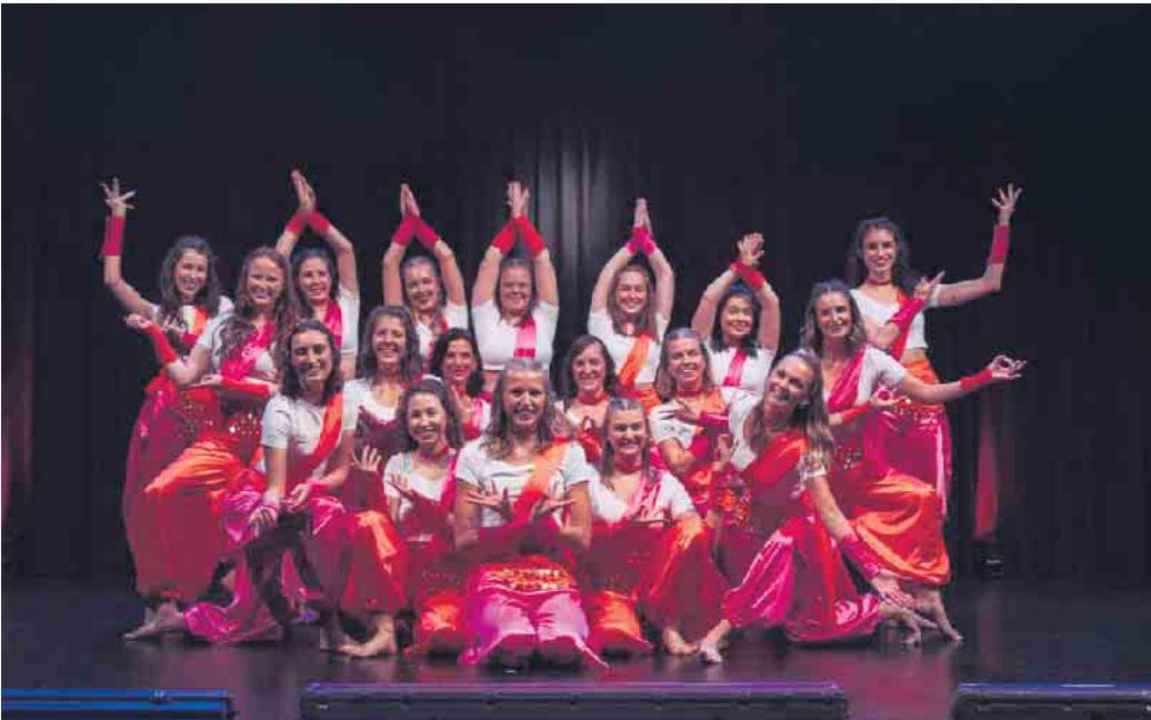
Ein strahlendes Team voller Freude und Zusammenhalt - die Tänzerinnen posieren in leuchtenden Farben.