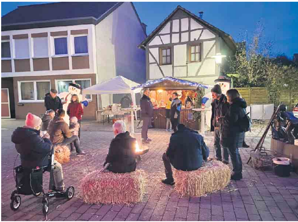
Vorweihnachtszeit in Merl