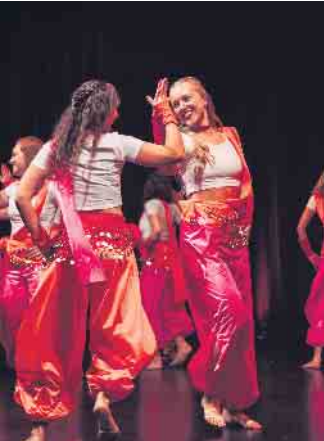
Freude und Energie auf der Bühne - Tänzerinnen in farbenfrohen Kostümen bei einer dynamischen Performance

Die Tanzabteilung des MSV engagiert sich für den guten Zweck