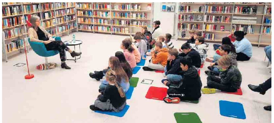
Spannende Lesung für die Jüngeren

sich schon seit vielen Jahren an der Aktion, weil es wichtig ist, die Vorlesekultur zu fördern.