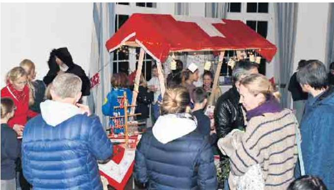
An Ständen wurde über Weihnachtsbräuche in europäischen Ländern informiert und Weihnachtliches sowie Leckereien verkauft.

Schule gründeten, erfreute sich großer Beliebtheit.