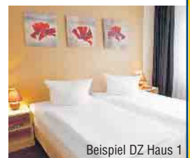
Beispiel DZ Haus 1