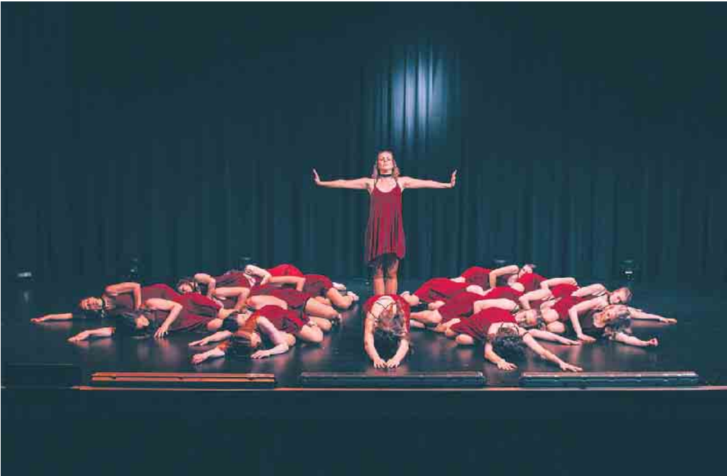
Ausdrucksstarke Choreografie - die Tänzerinnen in roten Kleidern verweilen in einer eindrucksvollen Formation.

im Rampenlicht stehen. „Ohne mein großartiges Helferteam könnte ich eine Show dieser Größe nicht stemmen.“ Mit einer After-Show-Party im Vereinsheim des MSV feierten die Aktiven ihren Erfolg und dankten allen Helfern und dem Sketcheteam für die hilfreiche Unterstützung.