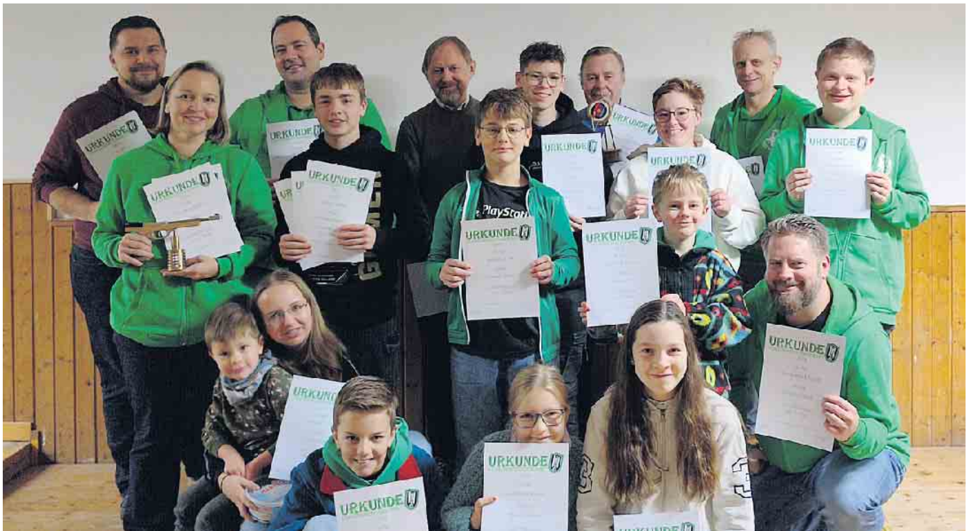
Die Sieger der Vereinsmeisterschaft freuten sich über ihre Leistungen.

Altendorf-Ersdorfer Schützen ermitteln Vereinsmeister im Blasrohrschießen