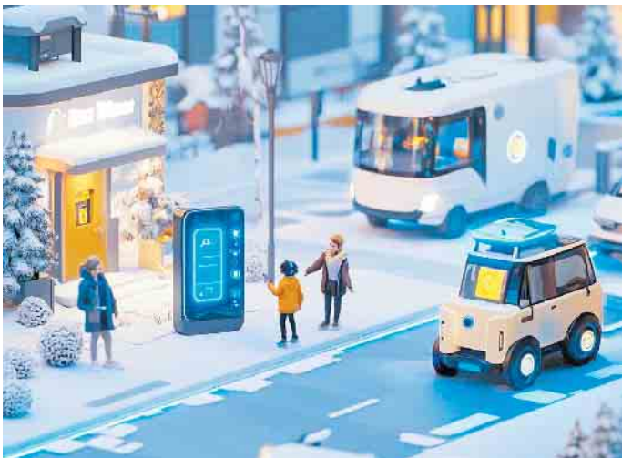
Durch KI generierte Bilder