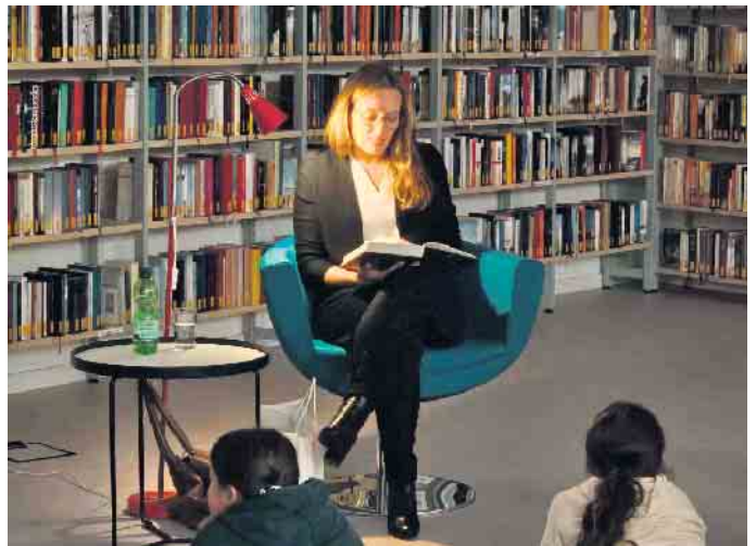
Gemütliche Vorlesestunde im Keller der Bücherei

Der bundesweite Vorleseabend findet seit 2004 jedes Jahr im November statt und ist eine gemein-