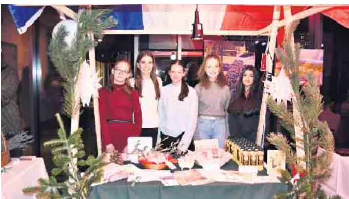
Zu einigen europäischen Ländern hatte die Schule Verkaufsstände vorbereitet.

wandern“, ertönte es voller Begeisterung auf der Bühne, begleitet von einer Band aus Streichern, Blechbläsern, E-Gitarre und Schlagzeug. Gemeinsam mit dem Stern machte sich das Publikum auf eine Reise durch Europa. So wurden England, Italien, Frankreich, Österreich, Schweden, Deutschland und Spanien bereist. Zu jedem Land öffneten Kinder auf der Bühne das Fenster und ein Bild zeigte an, wo der Stern gelandet war. Und wie wird dort gefeiert? Und welche Weihnachtslieder werden dort gesungen? Auf unterhaltsame Weise und mit passenden Kostümen erläuterten Mädchen und Jungen in Form kurzer Gespräche Weihnachtsbräuche aus den unterschiedlichen Ländern. Der Weihnachtskuchen Panettone in Italien durfte dabei so wenig fehlen wie die Carol Singers in England, der Adventskranz in Deutschland oder die Weihnachtslotterie in Spanien.