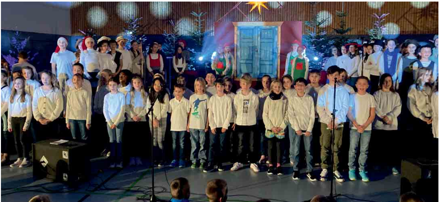
Die Mädchen und Jungen der fünften Klassen führten ein Mini-Musical auf: „Unser kleiner Stern - eine weihnachtliche Reise durch Europa“.

Musical und Budenzauber stimmen in die Adventszeit ein