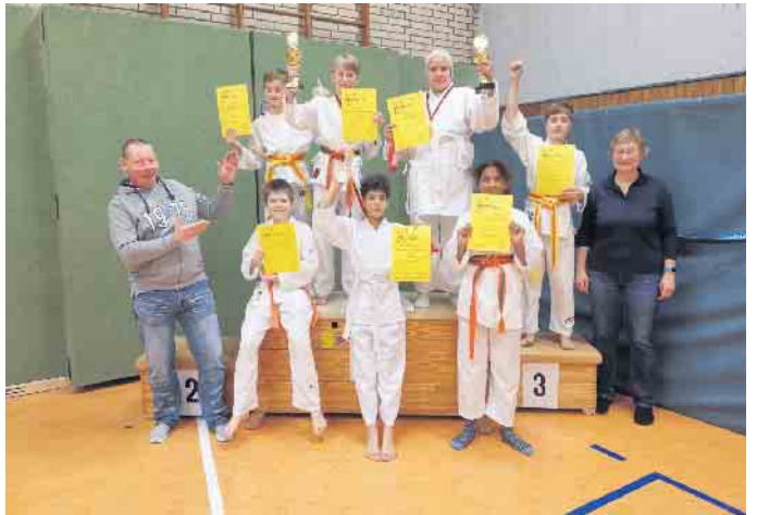
Karate-Kids des BZM mit ihren Trainern

Kids in fünf der sieben Gruppen an diesem Wettbewerb teil. Allen Karate-Kids konnte man die Aufregung anmerken, das führte dazu, dass die Wettkämpfer sehr konzentriert und mit besonders viel Engagement ihre Kata oder Techniken zeigten. Nach knapp drei Stunden hatten die Teilnehmer ihr Können mit hervorragenden Leistungen in zwei Durchgängen zum Besten gegeben und es kam zur Endauswertung. Oftmals waren es nur Zehntelpunkte, die über einen Sieg entschieden und dennoch waren alle Sieger - es gab keine Verlierer. Das Ergebnis waren spannende Kämpfe, hervorragende Leistungen und ein miteinander fiebern und sich freuen über die Leistungen und das Ergebnis des Freundes bzw. der Freundin. Nach sehr engen Punkteständen holten sich drei der Meckheimer Karate-Kids zwei Pokale