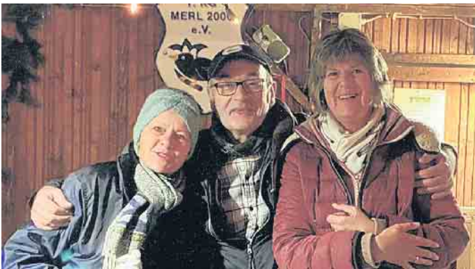
„Die Drei von der Advents-Bude“ öffnen in diesem Jahr vom 14. bis 17. Dezember

Adventswochenende zu feiern, dann aber von Donnerstag bis Sonntag. Vom 14. bis 17. Dezember ist die Weihnachtsbude der 1. KG Merl in der Zeit von 16 bis 20 Uhr geöffnet. Der Dorfplatz wird wieder in weihnachtlichem Lichterglanz erstrahlen, ausgeleuchtet durch Rafaels Lichtdesign. Die Besucherinnen und Besucher können sich auf Strohhallen, rund um einen wärmenden Feuerkorb gemütlich nieder lassen. Die Merler Karnevalisten bieten Vin