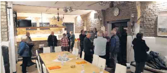
Schöpferische Pause bei der Strategiediskussion im ehemaligen Pferdestall

mit persönlichem Rat zur Seite zu stehen. Zur Zeit gehören rd. 170 Mitglieder dem Netzwerk an. Weitere mit besonderen Ideen, die sie umgesetzt haben, werden herzlich begrüßt.