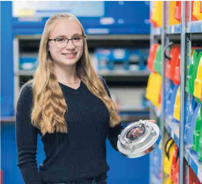
Kaufleute für Groß- und Außenhandelsmanagement sorgen für einen reibungslosen Warenfluss.

ketingmaßnahmen, analysieren Prozesse und vieles mehr. Auch im Technischen Handel wächst der Onlinebereich kreativ und dynamisch - ein Zukunftsberuf für PC- und Internetfans. (akz-o)