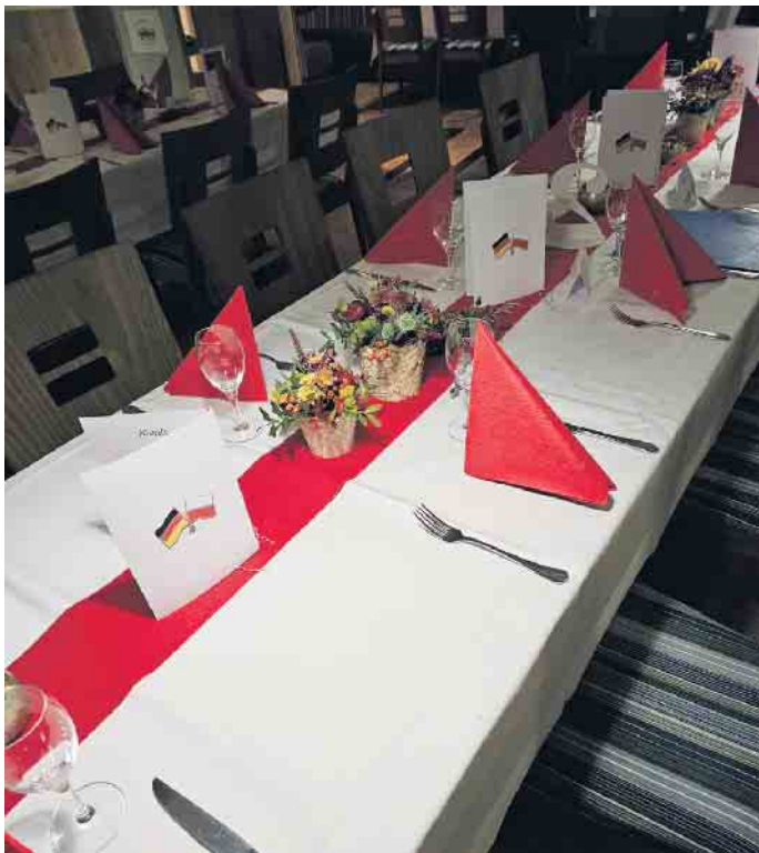
Liebevoll geschmückt für einen Abend der deutsch-polnischen Freundschaft.