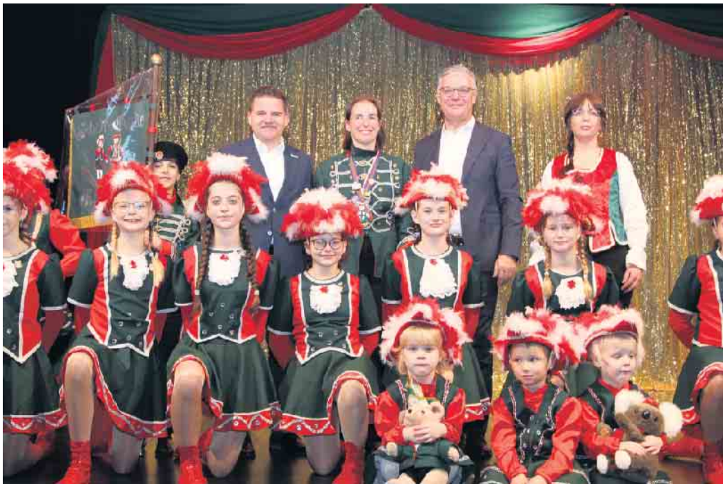
Durch die Spenden der Bürgerstiftung Meckenheim und der Kreissparkasse Köln konnten das Bühnenbild und die Fotowand angeschafft werden.

ckenheim, welcher für das neue Bühnenbild bestimmt ist. Und auch über die Finanzierung der neuen Fotowand, seitens der Kreissparkasse Köln. Die Stadt-Garde Meckenheim e.V. bot nicht nur eine Plattform für den Tanz, sondern schuf auch eine Gelegenheit für kulturellen Austausch und Zusammenkunft und begeisterte das gesamte Publikum: von den Jüngsten, bis hin zu den Senioren. Die leidenschaftlichen Darbietungen ernteten tosenden Applaus und begeisterte Reaktionen von einem Publikum, das die Kunst und Hingabe der Tänzerinnen und Tänzer zu schätzen wusste. Die Vorsitzende der Stadt-Garde Meckenheim e.V. sprach von einem erfolgreichen Event und hob die wichtige Rolle solcher Veranstaltungen für die Förderung des karnevalistischen Tanzsports in der Region hervor.