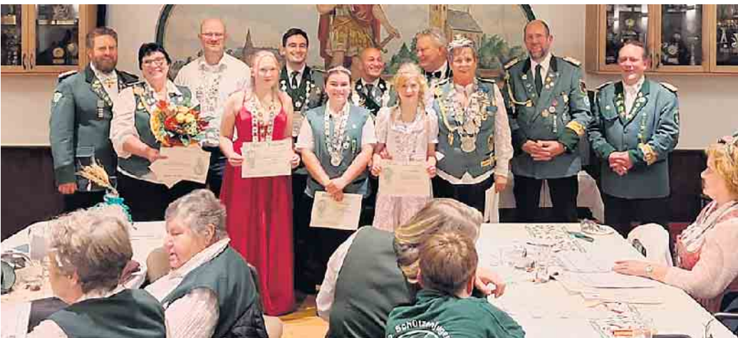
Die neuen Majestäten des Bezirksverbandes Voreifel bei der Krönung.