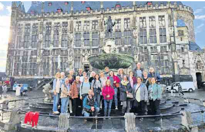
Einen Zwischenstopp legte der Chor während der Stadtführung auch am Karlsbrunnen vor dem Aachener Rathaus ein.

„Top of the World“ - besser hätte der Titel nicht gewählt sein können, den die Sängerinnen und Sänger des Rheinbacher Chores Cantiamo im Drehturm hoch über Aachen in den Abendhimmel schmetterten. Der Abend im ehemaligen Wasserturm auf dem Lousberg war einer der Höhepunkte der viertägigen Chorfahrt, die Cantiamo Ende Oktober anlässlich seines 35-jährigen Bestehens in die Kaiserstadt im Dreiländereck