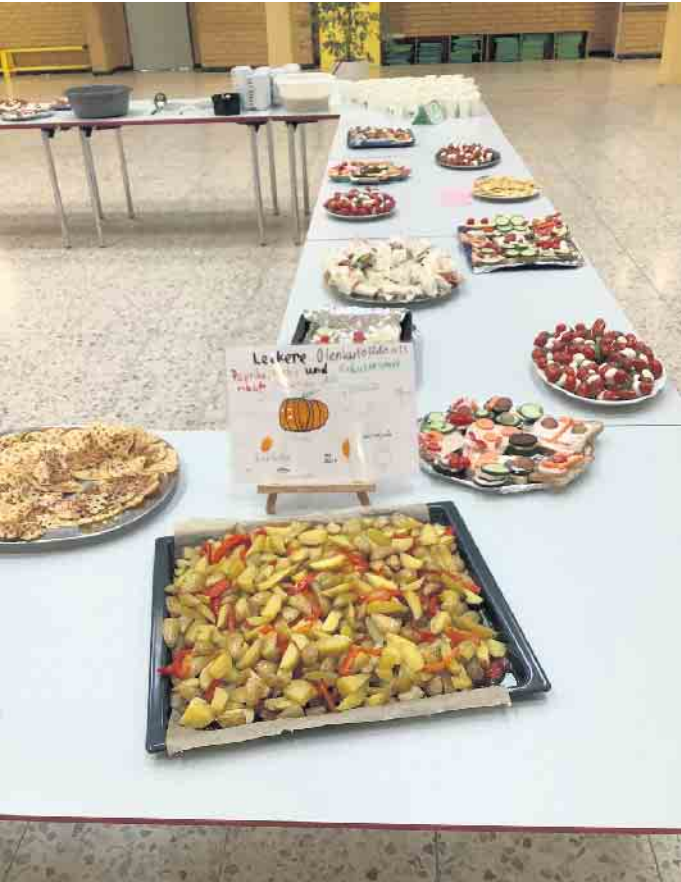
Am 11. Oktober freuten sich in der EGS Kleine wie Große auf das Highlight nach Abschluss der Projekttag und mit Ausblick auf die bevorstehenden Herbstferien: Unser gemeinsames Herbstfrüh-