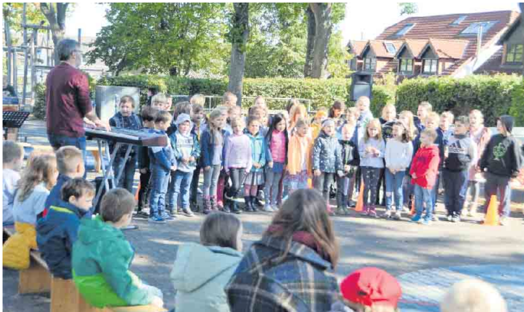
Der Herbst ist da Lieder und Gedichte auf dem Schulhof in Altendorf

Die Schulkinder der KGS Meckenheim aus Altendorf-Ersdorf bekamen Besuch von der „kleinen Flöte“ und feierten den Herbst in Liedern und Gedichten