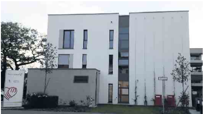
Neuer Standort des Pfl egeteams Wentland: Schumannshöhe in Bonn-Endenich.

Bonn-Endenich. Am 23.11.2022 lädt das Pfl egeteam Wentland interessierte Pflegekräfte zu einem offenen Bewerbertag in seinen neuen Standort in Bonn-Endenich von 9 bis 19 Uhr ein. Im Herzen von Bonn-Endenich - direkt neben dem Schumannhaus - ist das Pfl egeteam Wentland bereits seit Neustem mit einer Wohngemeinschaft und einer Senioren-Tagespflege vor Ort. In diesem Winter 2022/2023 plant der Pflegedienst zudem den Start einer selbstverantworteten Demenz-Wohngemeinschaft und ambulanten Pflegeleistungen. Ein Pflege-Job mit viel Zeit: In den familiären Wohngemeinschaften wohnen bis zu zwölf Bewohnende zusammen. Gesucht werden Pflegekräfte für die Wohngemeinschaften und für