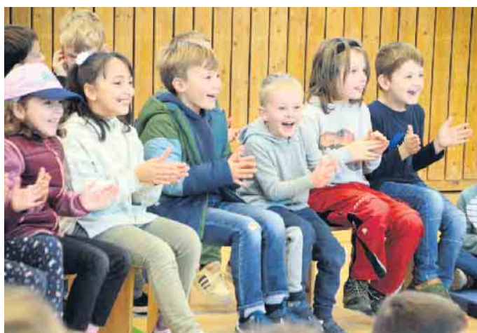
Die Begeisterung über den Besuch der kleinen Flöte war riesengroß

Gueit zwei Flöten zweihändig. Solche Fingerfertigkeit hinterließ offenbar Eindruck, denn im Nachgang meldeten sich mehr als 20 Kinder zur Flöten-AG an, die nun bereits erfolgreich gestartet ist. Die Arbeitsgemeinschaft wird, wie auch der Besuch der Musiker, vom Förderverein der Schule unterstützt. Eine Chor-AG gibt es am Teilstandort in Altendorf schon länger.