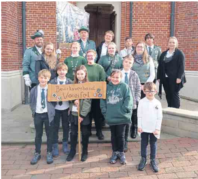
Die Abordnung aus der Voreifel nach der Jugendmesse am Sonntag

und Spaß und der Möglichkeit, in der großen Schützenfamilie ein tolles Wochenende zu verbringen.