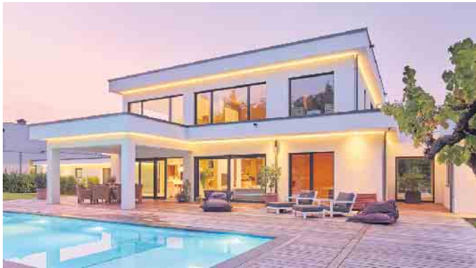
„Die Bauhausarchitektur ist Ausdruck von Individualität und Stilsicherheit.“

Planungsgrundlagen, auf der Fertighaus-Bauherren ihre persönlichen Wünsche und Vorstellungen vom Traumhaus heute in die Tat umsetzen können“, erklärt Fabian Tews, Sprecher des Bundesverbandes Deutscher Fertigbau (BDF). Aber warum ist gerade die Bauhausarchitektur bei Bauherren wieder so beliebt? „Weil sie zeitlos ist“, glaubt Tews. Zum einen könnten reduzierte kubische Gebäudeformen einen willkommenen Gegenpol zur Reizüberflutung und Komplexität einer schnelllebigen und globalisierten Gesellschaft darstellen. Zum anderen sei die sachliche Bauhaus-Architektur für viele Menschen Ausdruck von Individualität und Stilsicherheit. „Auch bei anderen Alltagsgegenständen wie Autos, Möbeln oder Smartphones sind funktionale, möglichst schnörkellose Designs beliebt“, so der BDF-Sprecher. Wenn gewünscht hätten Bauherren von Fertighäusern zudem alle Freiheiten, gezielt Akzente zu setzen mit individueller Ausstattung, mit Formen, Farben und Materialien oder mit architektonischen Ergänzungen wie einem Erker, einer Dachterrasse oder einem Carport. Besonders einfach und komfortabel sind Fertighäuser für den Bauherren, wenn er sich für eine