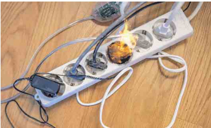
Brennende Steckerleiste durch Kurzschluss