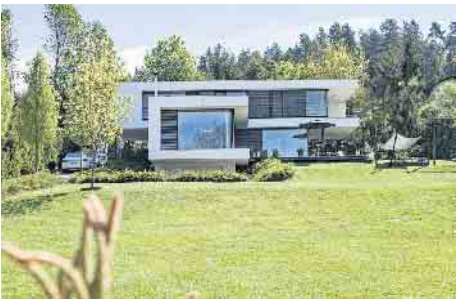
Flaches Dach, kubische Baukörper - das kommt bei vielen Bauherren gut an.

zeitlich immer stärker eingespannt sind oder das Mehr an Komfort besonders schätzen. Mit einem schlüsselfertigen Holz-Fertighaus kommen sie entspannt und planungssicher in ihrem individuellen Traumhaus an“, schließt Tews. (BDF/FT)