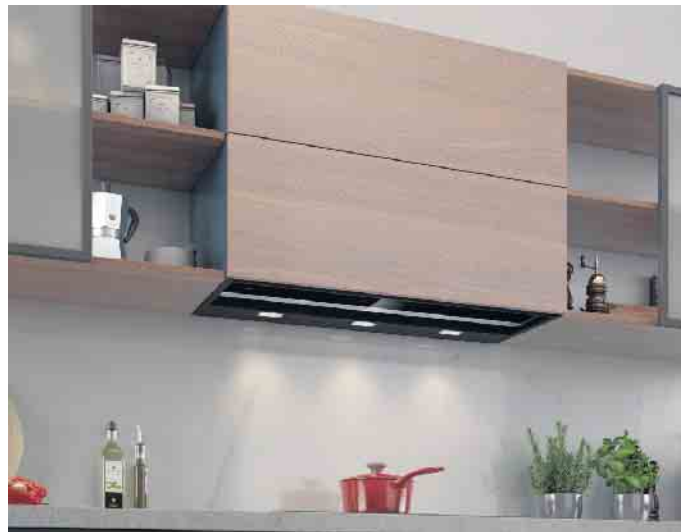
Auffällig unauffällig: Diese 90 cm breite, flächenbündig eingebaute Designhaube nimmt sich optisch komplett zurück und lässt so dem Küchenambiente den Vortritt. Zugleich bietet sie reichlich Stauraum auf zwei Ebenen.

Beispielsweise auch mithilfe optionaler Umluft-Hochleistungsfilter mit ihrer sehr hohen Geruchsreduzierung. Sie halten übrigens auch luftgetragene Pollen zurück und deaktivieren Allergene im Filter, was für alle Allergiker eine besondere Erleichterung ist. Oder wartungsfreie, selbstreinigende Umluftfiltersysteme, die sich z. B. auf der Basis eines thermokatalytischen Verfahrens regenerieren und so für gute Luft