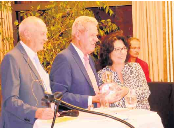
Geschenkübergabe des Ehrenvorstandes

musikalischem Vortrag. Heute hat der Verein knapp 160 Mitglieder, von denen sich viele regelmäßig treffen, wie z.B. zum Stammtisch, Kinobesuche, Theaterbesuche, historischen Stadtführungen oder zu ein- und mehrtägigen Ausflügen.