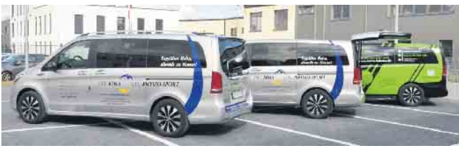
Ein umfangreicher komfortabler Fahrdienst sorgt für einen bequemen und sicheren Hol- und Bringservice.