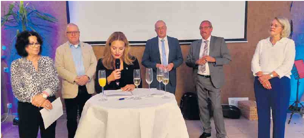
Vorstand mit Gastednerin