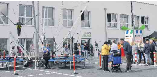
Für große und kleine Besucher war am Tag der offenen Tür bestens gesorgt.