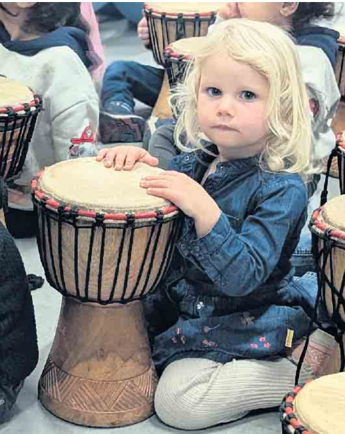
Der Workshop führte die Kinder an die Trommeln.

Interaktives Kinderprogramm in der Kita Steinbüchel