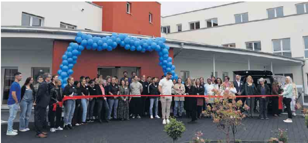
Mit dem Durchschneiden des obligatorischen roten Bandes wurde das moderne Funktionsgebäude in Alfter Ende September offiziell eröffnet.

Der Auftakt des neuen Standorts wurde von einem sehr gut besuchten Tag der offenen Tür begleitet. Besucherinnen und Besucher erhielten Einblicke in die freundliche, moderne räumliche Ausstattung, das Therapie-spektrum und das Angebot des „Bistro Balance“. Es wurde die Gelegenheit für Gespräche mit dem Fachpersonal sowie umfassende Beratungen genutzt. Gemäß seinem Leitbild versteht sich Sieg Reha 2.0 als Dienstleister im Gesundheitswesen mit Heilmittel, Prävention und ambulanter Rehabilitation. Das Ziel ist die Sicherung der Teilhabe im Alltag, Beruf und Gesellschaft Behinderter oder von Behinderung bedrohter Menschen . Die Aufgabe ist die Verbesserung der Lebensqualität und Selbstständigkeit eines