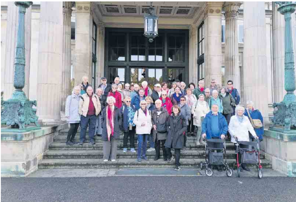
Vor dem Eingang zur „Villa Hgel“

30. November: Advents-Basar in der Behindertenwerksttte Me-