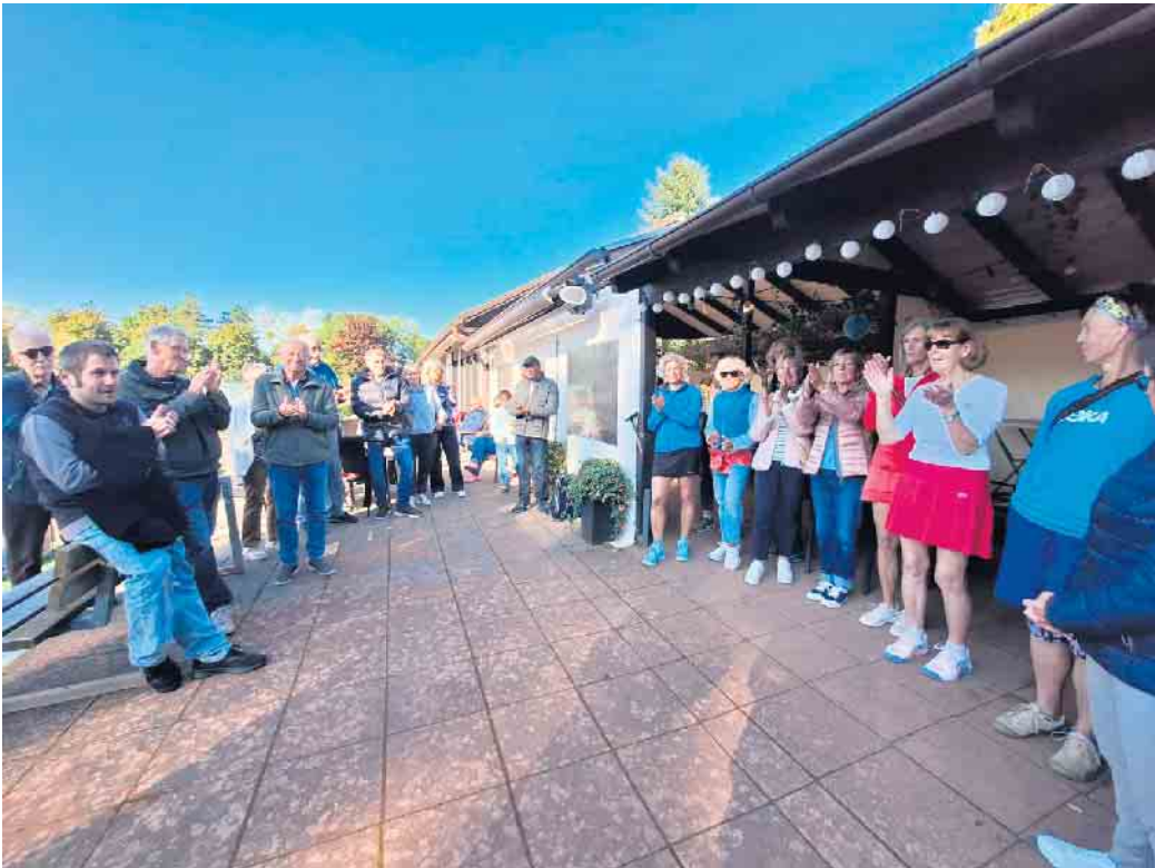
Spielerinnen und Spieler Stadtmeisterschaft.