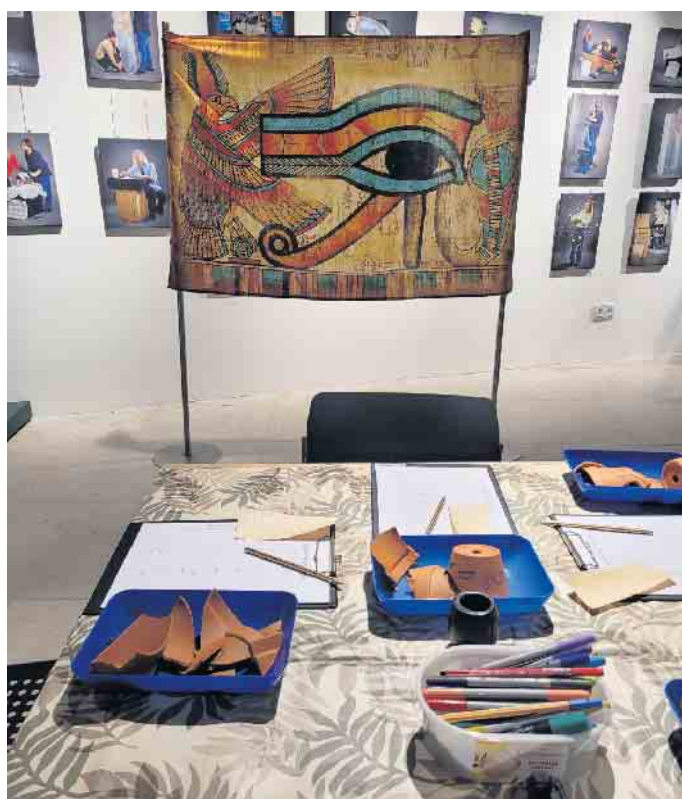
In diesem Seminarraum finden die Kurse statt.

Weiterhin gibt es das Angebot „Geburtstag im Ägyptischen Museum“. Es steht ein dekoriertes Raum für eine kleine Feier und Platz für ein mitzubringendes Büfett zur Verfügung. Ebenso gibt es einen spannenden Bastelnachmittag im Ägyptischen Museum.