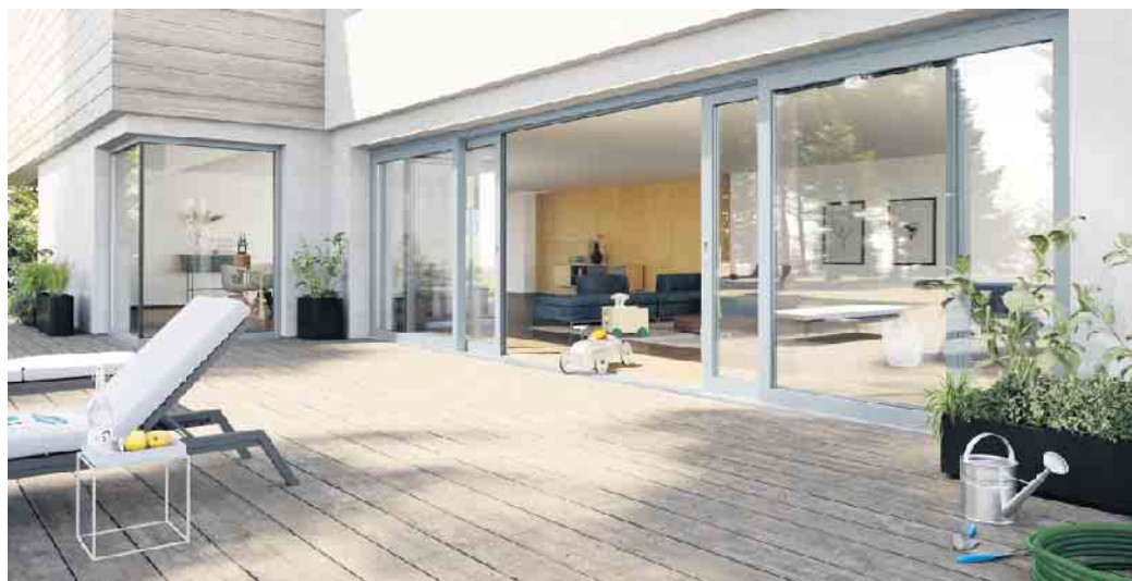
Trend 2 & 3: Der Garten wird zum erweiterten Wohnzimmer mit großen Hebe- und Schiebetüren. Die Profile sind in silbergrau gehalten.

Smart-Home-Systeme beziehen zunehmend auch die Fenster ein. Besonders automatische Lüftungssysteme setzen sich durch. Senso-