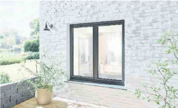
Trend 4: Schmale Profile und Flügel, die flächenbündig schließen, erlauben eine noch größere Fensterfläche. Alles in umbragrau.

ren messen Temperatur und Luftfeuchtigkeit und lüften bei Bedarf über in die Fenster integrierte, automatische Lüfter. Für den Sommer kann der Sonnenschutz über entsprechende Sensoren automatisch hoch- und runtergefahren werden und verhindert so die Überhitzung im Gebäude. Auch das Öffnen und Schließen der Fenster - etwa bei Regen - kann