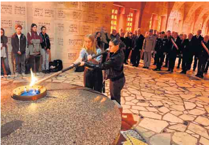
Entzünden der Flamme im Beinhaus

tag des Endes des 1. Weltkrieges die nächste Schülerfahrt statt. Die Delegation wird Teil der Feierlichkeiten in Verdun sein. Die nächste Bürgerfahrt ist schon in Planung. Im Juni 2026 geht es erneut nach Verdun und Douaumont-Vaux.