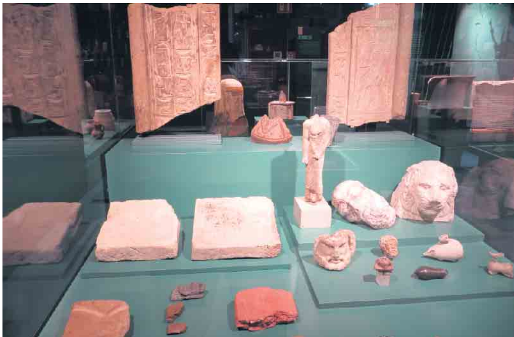
Einsicht in eine von vielen Vitinen

Aktuelles vom Förderverein des Ägyptischen Museums der Uni Bonn