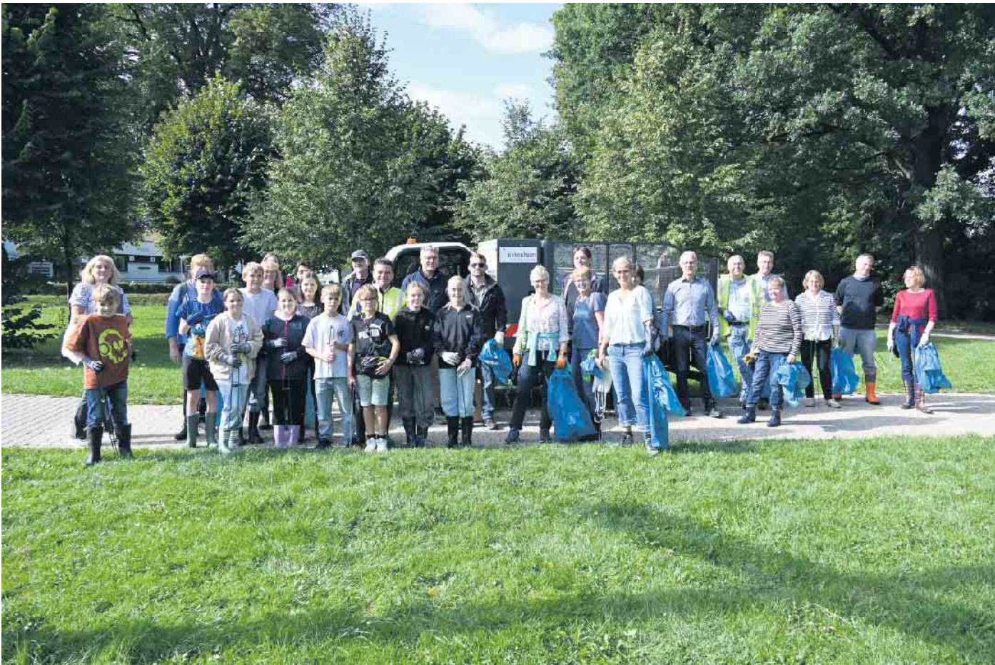
Erfolgreiche Müllsammel-Aktion in der Swistbachaue: Schülerinnen und Schüler, Lehrkräfte, Mitarbeitende der Stadtverwaltung und Bürgerinnen und Bürger sammelten Müll und demonstrierten damit ihr Umweltbewusstsein.