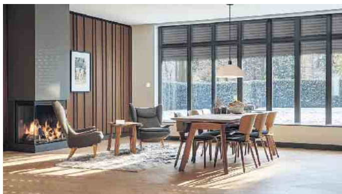
Trend 1: Große bodengebundene Fenster lassen viel Tageslicht herein. Und sparen im Winter viel Heizenergie.

Dieser Trend hält seit Jahren an: Neue Fenster werden immer größer - und vereinen Hebe-Schiebetüren sowie bodengebundene Fenster und Türen. VFF-Geschäftsführer Frank Lange erklärt: „Der Trend zu größeren Fensterflächen spiegelt den Wunsch der Menschen nach Helligkeit, Weite und Ausblick wider. Wir halten uns heutzutage viel mehr in Innenräumen auf als früher. Dementsprechend möchten die Menschen möglichst viel Tageslicht in ihre eigenen vier Wände holen. Das erzeugt ein Gefühl von Offenheit und Verbindung zur Außenwelt.“ Möglich macht dies der technische Fortschritt: Moderne Fenster sind energetisch hoch effizient, so dass selbst über größere Glasflächen nur unwesentlich an Wärme verloren geht. Scheint die Sonne darauf, erwärmen diese Fenster sogar an kalten Tagen den Innenraum - ein Beitrag zur Energie- und Kostenersparnis. Für den Sommer sind Sonnenschutzverglasungen, Markisen,