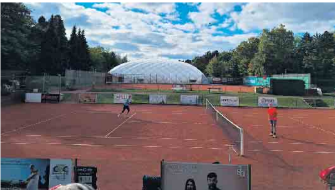
Traglufthalle TC Rheinbach, außen

persönlichen Eindruck von der Funktionalität der Halle überzeugt und eine namhafte Spende dem Verein übergeben. Rheinbacher Tennis Stadtmeisterschaft Die diesjährige Meisterschaft wurde im sogenannten Laver-Cup-Format ausgetragen, indem zwei Mannschaften in wechselnden Paarungen in drei Runden gegeneinander antreten, wobei die Runden unterschiedlich stark gewichtet werden. Damit ist Spannung bis zum Ende vorprogrammiert. Das die Mannschaft Blau gegen die Mannschaft Rot gewann, tat dem Enthusiasmus der Spielerinnen und Spieler und der allge-