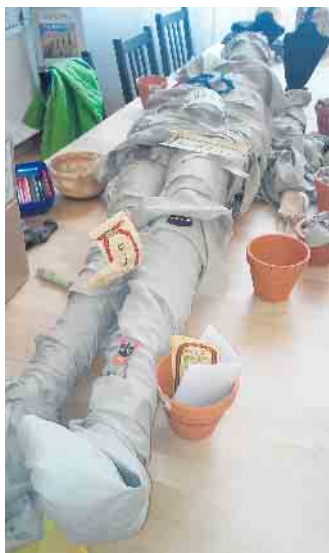
Eine Schaufensterpuppe wird zur Mumie.

Ein Keramiktopf wird vom Teilnehmer mit Hieroglyphen bemalt, z. B. dem eigenen Namen. Wird ein Hieroglyphen-Text entschlüsselt, gibt es einen schönen Preis. Termine für diesen Kurs: 11. Oktober, Start 15 Uhr, Dauer ca. 2 Stunden. Kostenbeitrag für diesen Kurs beträgt 15 Euro pro Teilnehmer.