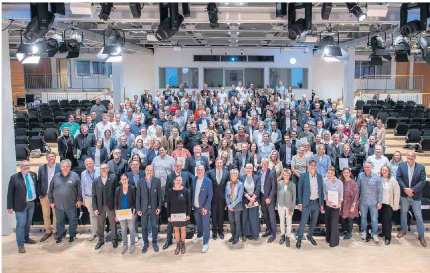
Gruppenfoto der ausgezeichneten Schulen aus NRW als „MINT-freundliche oder Digitale Schule“.

Das zdi-Netzwerk wird in Trägerschaft des Rhein-Sieg-Kreises kreisweit ausgebaut. Zu den verschiedenen Kooperationspartnern gehören insbesondere Akteure aus Wirtschaft, Verwaltung, Schule und Hochschule, das Ministerium für Kultur und Wissenschaft NRW und die Agentur für Arbeit. Die Koordination des Netzaufbaus übernimmt das Regionale Bildungsbüro im Amt für Schule, Bildung, Kultur und Sport des Rhein-Sieg-Kreises unter Leitung von Tim Bayer. Weitere Informationen im Internet: mint-rhein-sieg.de