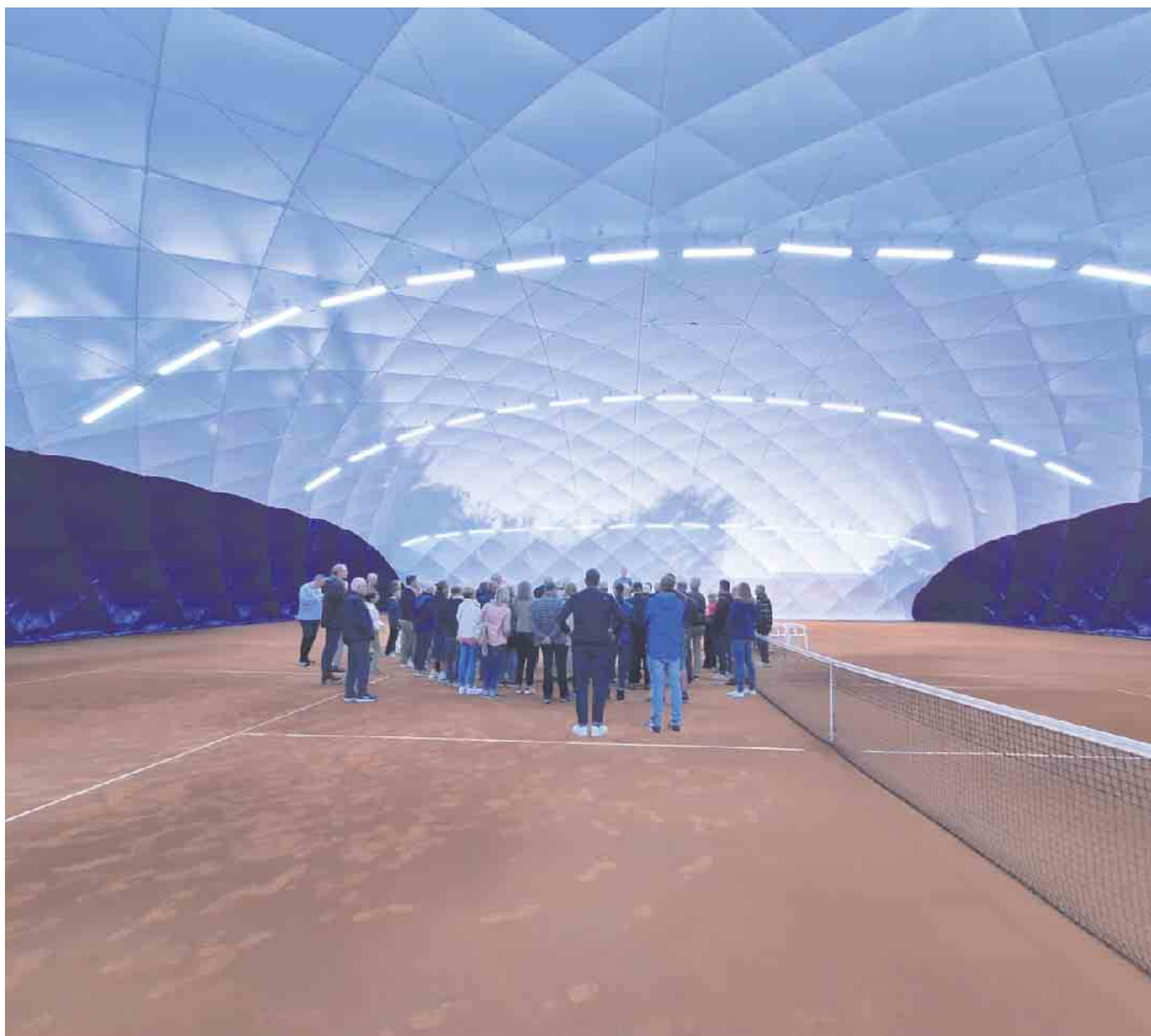
Traglufthalle TC Rheinbach, innen