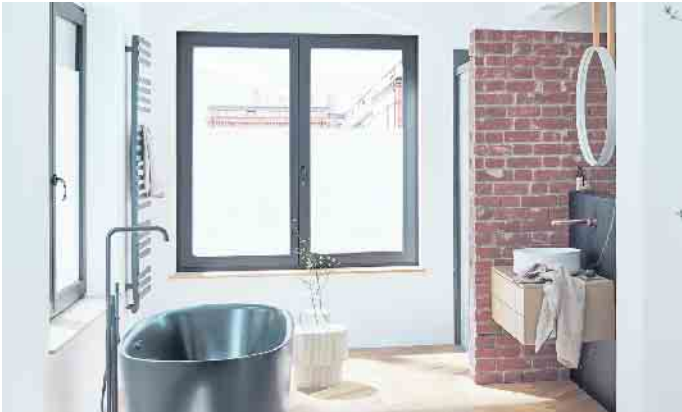
Trend 5: Automation - Im Smart Home schaltet das Fensterglas auf Wunsch milchig.

das Smart Home übernehmen. Besonders praktisch ist das beim Verlassen des Hauses. Auf Befehl per App oder automatisch beim Abschießen der Haustür, werden auch alle Fenster des Hauses verriegelt. So bleibt kein Fenster versehentlich offen - ein Plus für Sicherheit und Energieeffizienz. Ein interessanter Nebeneffekt: Bei automatisch gesteuerten Fenstern