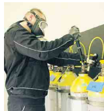
Technisches Wissen und handwerkliches Geschick sind erforderlich für die Berufe rund um die Bäderbetriebe.