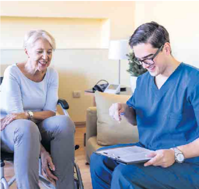
Ein Pflegeberuf bringt viel Kontakt mit anderen Menschen mit sich.

Jobs in der Pflege sind sinnvoll und gut bezahlt