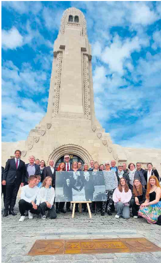
Gruppe vor dem Beinhaus