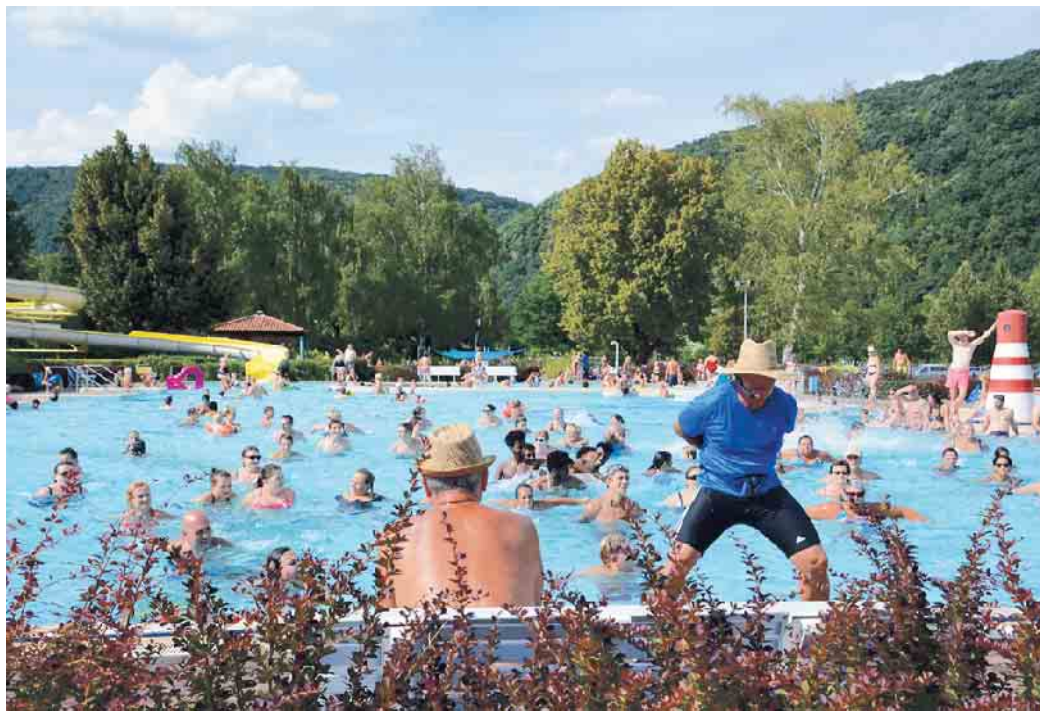
Die Bandbreite der Tätigkeitsfelder in Bäderbetrieben ist groß. Von Schwimmbadtechnik bis zum Betrieb am Becken muss alles im Blick behalten werden.

Doch nicht nur technisches Wissen und handwerkliches Geschick sind gefragt. Auch kommunikative Fähigkeiten und ein freundliches Auftreten sind unerlässlich. Schließlich haben sie oft direkten Kontakt zu den Gästen und müssen sich um deren Anliegen kümmern. Auch in Notsituationen müs-