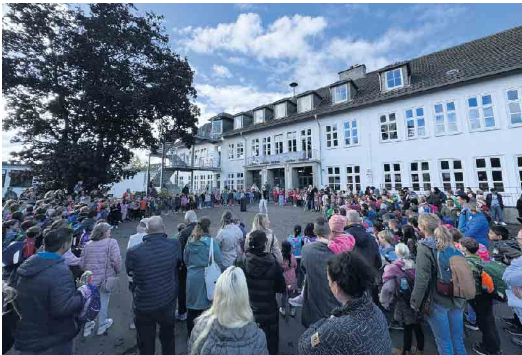
Schützlinge auf ihrem individuellen Lernweg begleitet. Hinweis: Die Anmeldung der zukünftigen Erstklässler findet vom 6. bis 8. November statt. Ab sofort können Termine zur Anmeldung unter der Telefonnummer 02225/ 836 650 vereinbart werden.

überzeugen. In Klasse 4 arbeiteten die Kinder im Zahlenraum bis eine Millionen, während die Drittklässler sich intensiv mit dem Thema „Getreide“ auseinandersetzten. Ein besonderes Highlight war der von den Viertklässlern organisierte „Sightseeing-Bus“, mit dem sie stolz ihre Schule präsentierten und den Gästen einen Einblick in das vielfältige Schulleben ermöglichen. Der Tag endete mit einem gemeinsamen Treffen aller Kinder, deren Eltern und Lehrkräfte auf dem Schulhof. Zum Abschluss wurde das Schullied „Nimm mich wie ich bin“ gesungen, das das Motto der KGS Meckenheim - die Vielfalt und Heterogenität der Kinder wertzuschätzen - auf eindrucksvolle Weise unterstrich. Der Tag der Offenen Tür hinterließ bei allen Besuchern einen positiven Eindruck und zeigte einmal mehr, wie engagiert die KGS Meckenheim ihre