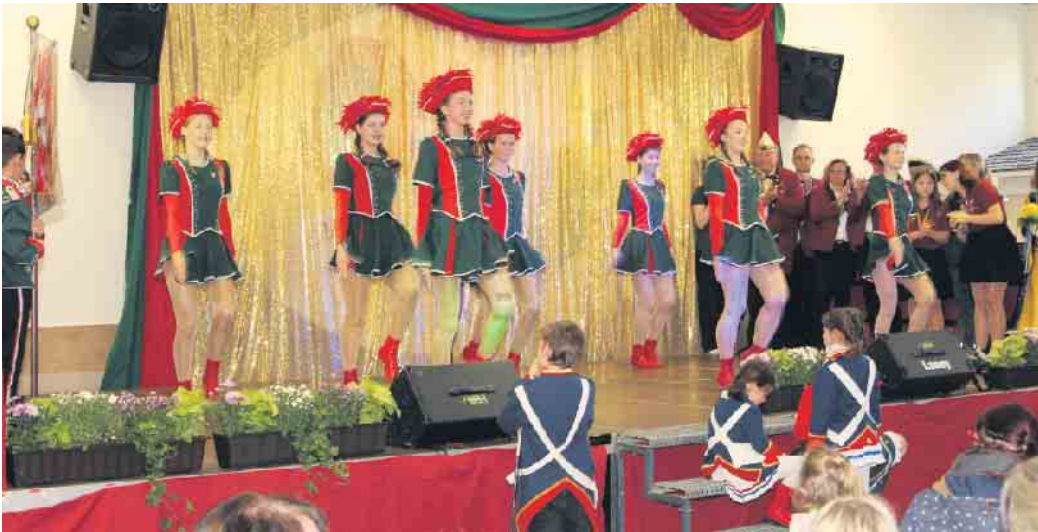
Die Große Garde der Stadt-Garde beim 1. Garde- und Showtanztreffen 2023

Die Bühnen sind bereit, die Kostüme glänzen, und die Tanzschuhe sind poliert - die Stadt-Garde Meckenheim e.V. steht in den Startlöchern, um das zweite Garde- und Showtanztreffen zu präsentieren. Dieses aufregende Event verspricht, die Herzen von Tanzbegeisterten und Zuschauern gleichermaßen höherschlagen zu lassen. Am 3. November wird Meckenheim zum Schauplatz einer unvergesslichen Tanzshow, bei der die Garde- und Showtanzgruppen aus der Region ihr Können unter Beweis stellen. Die Veranstaltung verspricht über sechs Stunden atemberaubende Darbietungen und mitreißende Energie. Das Treffen findet von 11 bis 17.30 Uhr in der Jungholzhalle Meckenheim statt und ist für alle Altersgruppen zugänglich. Bei freiem Eintritt dürfen sich die Besucher so-