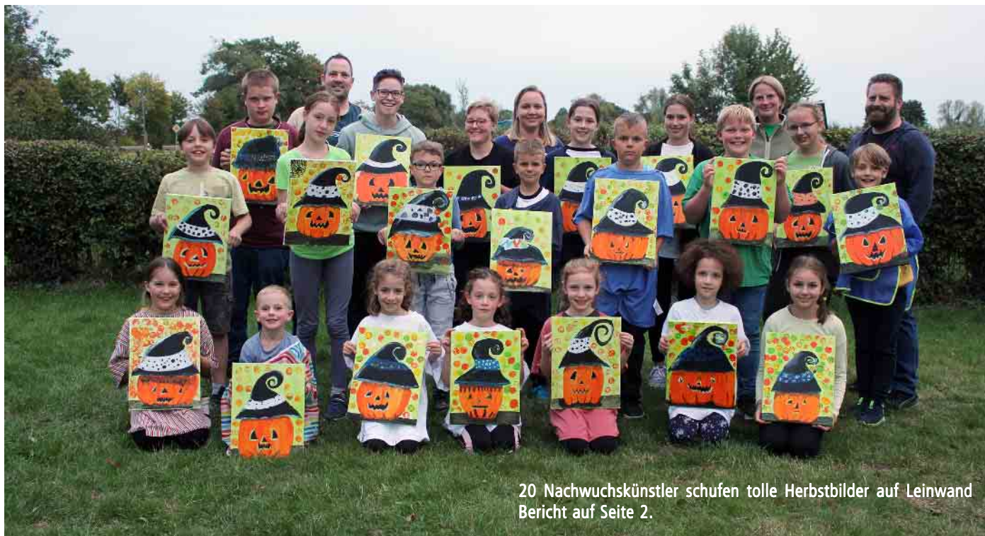
20 Nachwuchskünstler schufen tolle Herbstbilder auf Leinwand Bericht auf Seite 2.

Erfolgreicher 2. Art Afternoon der Schützenjugend