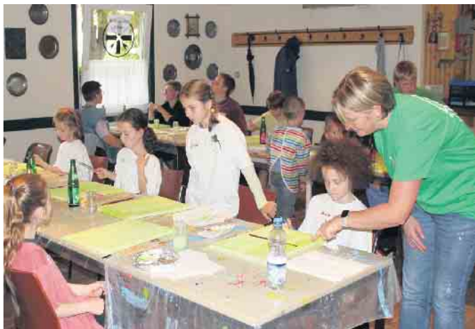
Die Kinder waren mit Spaß bei der Sache.