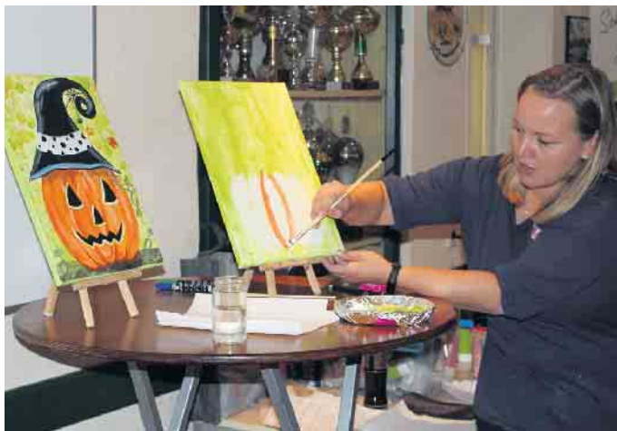
Mit Acrylfarbe wurde ein Kürbis auf Leinwand gemalt.