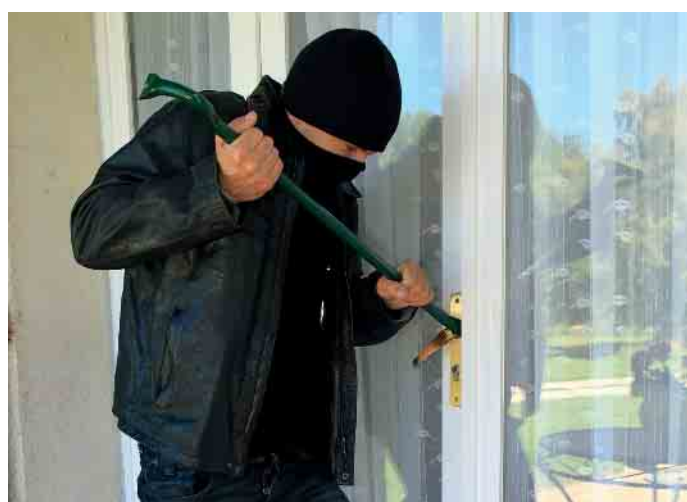
Einbrecher werden auf unbeleuchtete Häuser schnell aufmerksam. Licht täuscht Anwesenheit vor.

Tipps für den Einbruchschutz Sorglosigkeit macht es Dieben unnötig leicht: Gekippte Fenster oder nicht abgeschlossene Haustüren werden als Gefahrenquellen oftmals nicht erkannt. Das einfachste Mittel gegen Einbruch ist das Vortäuschen von Anwesenheit, etwa durch Zeitschaltuhren für Lampen. Das empfiehlt auch