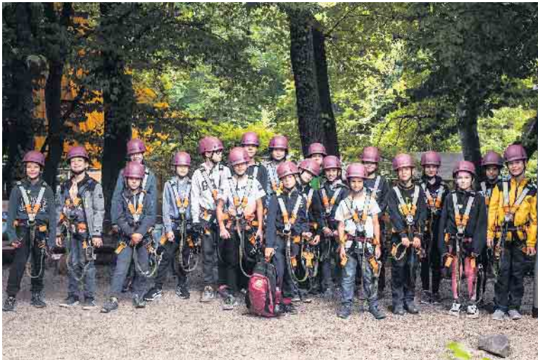
Kletterausflug des MSV