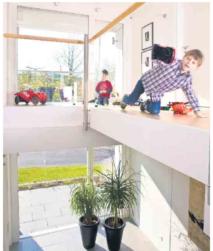
Eine gläserne Balustrade gibt dem Haus ein Gefühl der Leichtigkeit und holt viel Tageslicht in den Eingangsbereich.