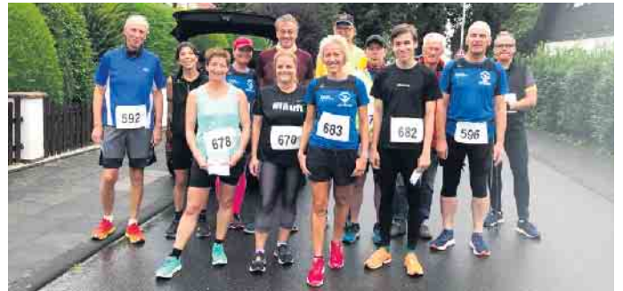
Teilnehmer vor dem Start

Altendorf-Ersdorf den 27. Obstmeilenlauf aus und hofft auf viele Teilnehmer. Informationen dazu auf www.obstmeilenlauf.de .