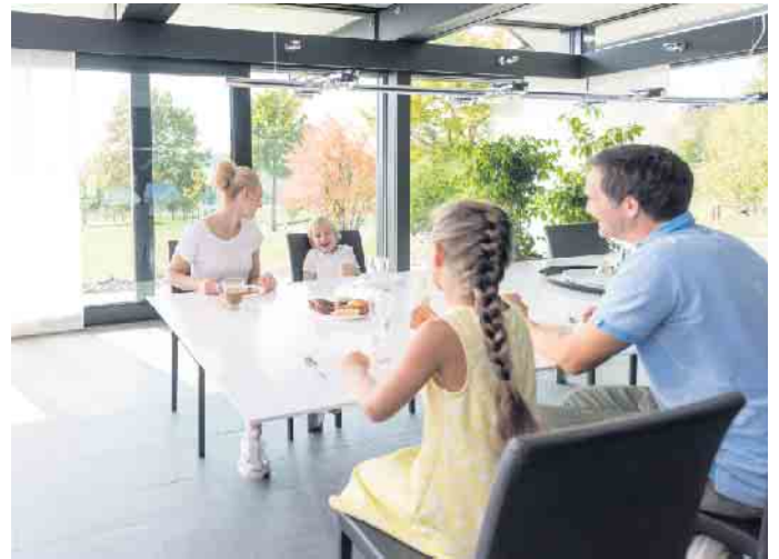
Wohnen mit Durchblick: Glas ist aus der modernen Architektur nicht wegzudenken - auch als Gestaltungsmittel im Innenausbau.

Ein klares Statement setzen Hausbesitzer mit dem Werkstoff auch im modernen Wellnessbad. Hochwertige Ganzglasduschen zum Beispiel verbinden Ästhetik mit hoher Funktionalität sowie hygienischen Vorteilen. Sie lassen sich einfach reinigen und behalten