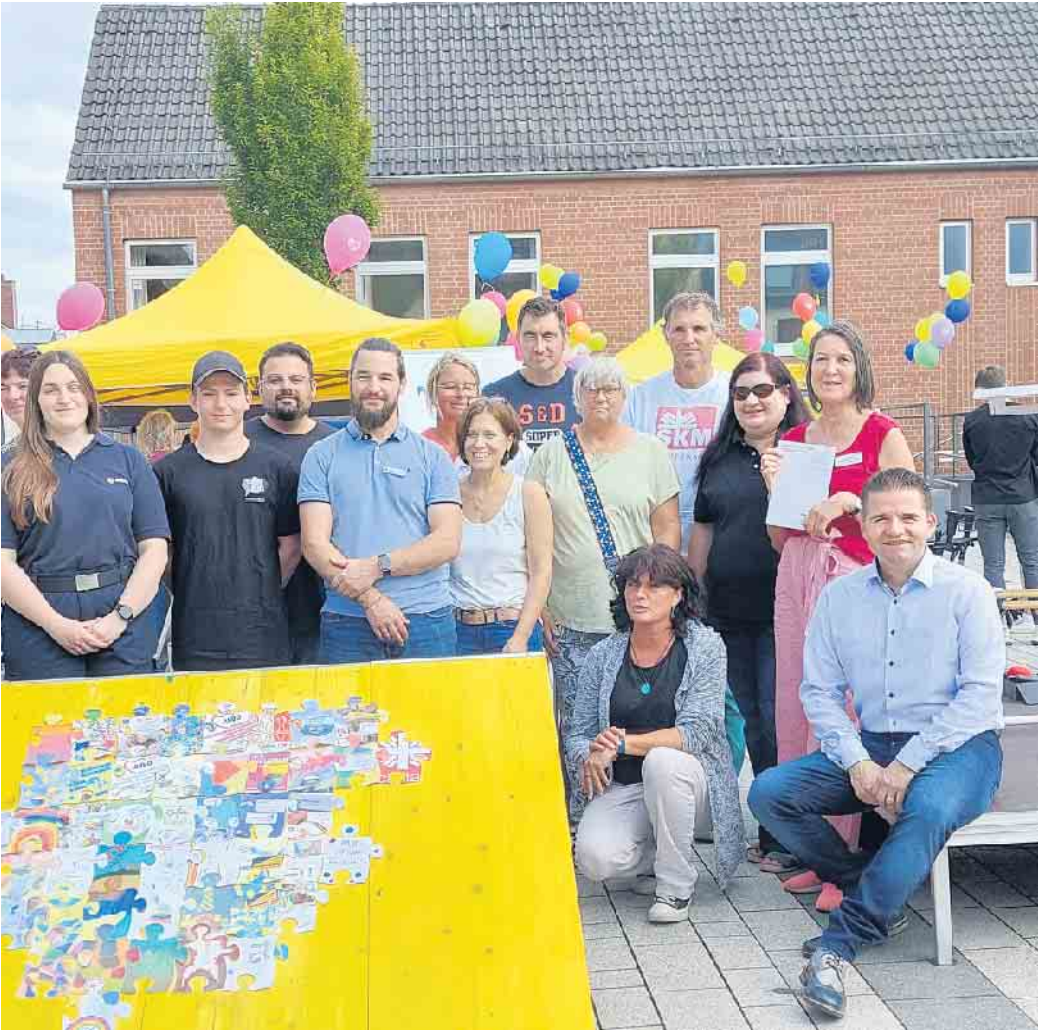
Erfolgreicher Tag der Sozialen Dienste in Meckenheim.

Unter der Koordination der Ev. Kirchengemeinde gibt es den Runden Tisch der Sozialen Dienste mittlerweile seit über 20 Jahren. Ein also 10-jähriges Jubiläum, da dieses Event alle zwei Jahre stattfindet. Das diesjährige Angebot stand unter dem Motto „Gemeinsam statt einsam“ und erschien dann auch an jedem Stand mit einem bunten Luftballon, der die Verbundenheit der sozialen Einrichtungen untereinander durch ein Herz, gefüllt mit Puzzleteilen, ausdrückte. Anders als in den letzten Jahren wurden bereits im Vorfeld Schulen, Jugendgruppen, Kindergärten durch eine Mitmach-Puzzleaktion eingebunden. Auch eine erstmals eingerichtete Webseite verhalf den Teilnehmer/innen an dieser Aktion, alle von den Einrichtungen ausgehängten Puzzleteile zu finden und zu fotografieren. Es war ein wirklich toller Tag mit vielen Informationen, Aktionen, Gesprächen unter Kolleg/innen und Kooperationspartnern. Und so wird es sicherlich auch in zwei Jahren wieder heißen: Los geht's mit der Vorbereitung des