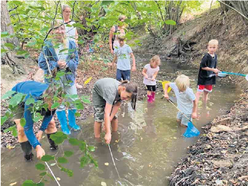
Meckikids in der Swist unterwegs

Nach der ausführlichen Beobachtung haben wir die Tiere wieder