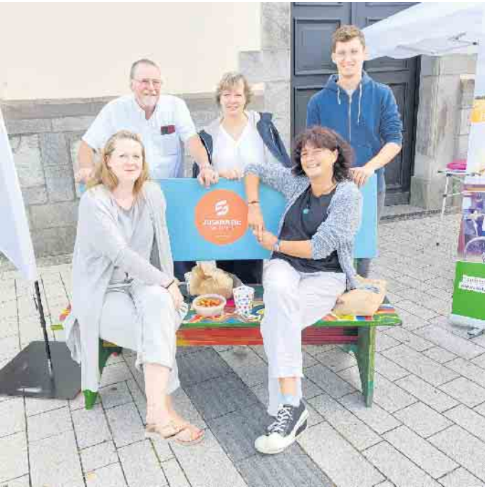
Arbeitsgruppe Tag der Sozialen Dienste