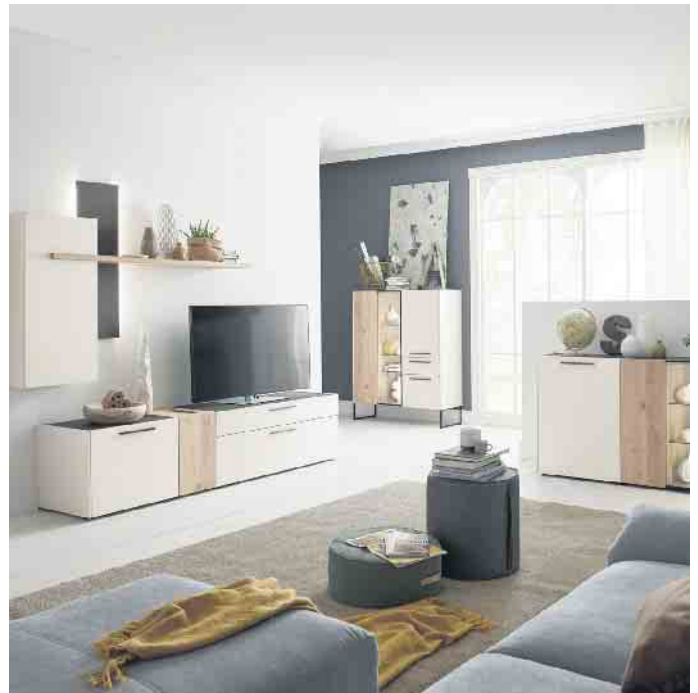
Mit Stauraum allein ist es bei Schränken nicht getan, denn sie sollen dauerhaft schön und sicher sein.