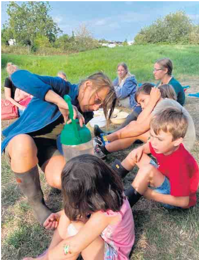
Meckikids bestaunen kleine Fische durch einen Lupenbecher