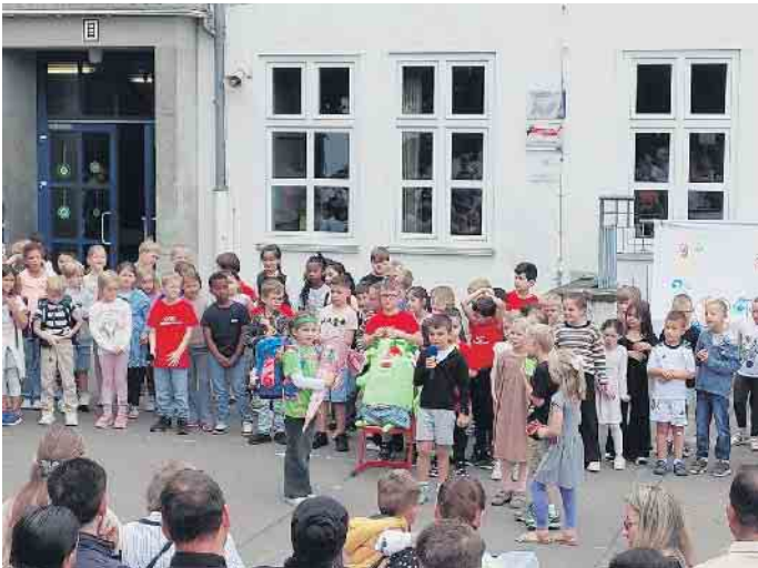
Gekonnt führen die Zweitklässler das selbstgeschriebene Singspiel - Das Große WIR - auf.

anderen Schulklassen. Auf die Frage, wie sie den Auftritt erlebt habe, sagte sie: „Ich bin selbst ein bisschen gewachsen und fand es sehr toll. Ja, ich war aufgeregt, weil ich ein bisschen Angst hatte, dass ich etwas falsch mache. Aber jetzt fühle ich mich sehr gut und bin stolz auf mich.“ Alle Kinder der Stufe 2 sangen die einstudierten Lieder textsicher und voller Freude mit. Die Kinder brillierten auf der Bühne, bewegten sich sicher und voller Ausdruck, sodass Handlung und Musik zu einer Einheit verschmolzen. Die Zuschauer staunten über das Können der Kinder und manche spürten sogar Gänsehaut. Nach der Aufführung begleiteten die Klassenlehrerinnen die Erstklässlerinnen und Erstklässler in die neuen Klassenräume, wo sie aufmerksam ihre erste Unterrichtsstunde miterlebten. Währenddessen warteten die Eltern bei Getränken auf dem Schulhof, nutzten die Gelegenheit zum Austausch und genossen die heitere Stimmung. Alle erlebten einen Tag voller Freude, Stolz und gemeinsamer Erlebnisse. Ein Schulanfang, der Kindern, Eltern und Lehrkräften noch lange in Erinnerung bleiben wird. Die sorgenfreie Grundschulzeit, die die KGS Meckenheim ihren neuen Schülerinnen und Schülern wünscht, begann damit auf eine eindrucksvolle und unvergessliche Weise.