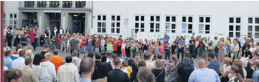
Die Kinder der Stufe 2 singen und tanzen mit Begeisterung für die neuen Erstklässler.

Neue Schulkinder feierten ihren ersten Schultag an der KGS Meckenheim