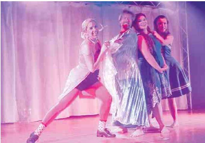
Mit viel Elan spielte sich das Ensemble des Theater am Lohmarkt in die Herzen vieler junger Theaterfreunde.