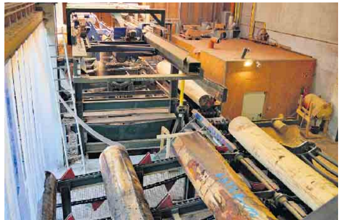
Furnierbäume bei der Verarbeitung.