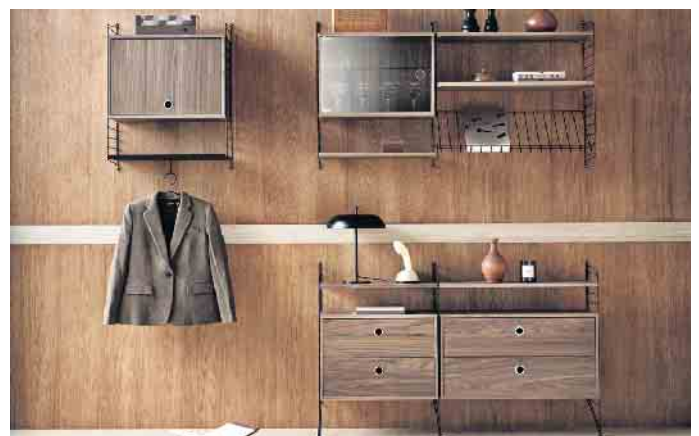
Edel und einzigartig: Furnierte Möbel.

Initiative Furnier + Natur (IFN) e.V. Weitere Infos zum Thema Furnier unter www.furnier.de oder www.furniergeschichten.de sowie auf Instagram unter #furnier_und_natur