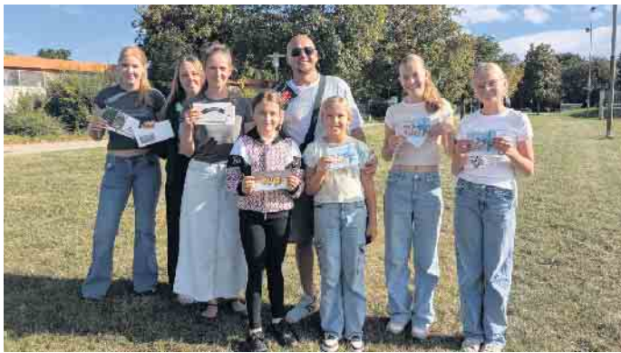
Die stolzen Gewinner des Boules-Wettbewerbs der Stadt-Garde Meckenheim.

Am letzten August-Sonntag trafen sich die Mitglieder der Stadt-Garde Meckenheim e.V. sich diesmal bei einem Boule-Turnier zu messen. In zweier-Teams wurden die bunten Kugeln mit viel Ehrgeiz und Präzision zur Zielkugel, dem „Schweinchen“ geworfen. Und das zweier-Team, was die meisten Kugeln am „Schweinchen“ hatte, gewann. Es gab je zwei Gewinner-teams bei den Kindern und bei den Erwachsenen. Doch auch alle anderen waren sehr begeistert, wieviel Spaß das Werfen von bunten Kugeln machen kann. Als Gewinn gab es Gutscheine von Meckener Restaurants und Cafés.