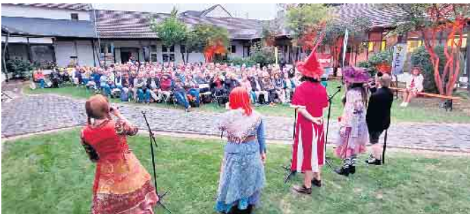
Vorprogramm mit regionalen Künstlern

Glücklich blickt das ehrenamtliche Team vom Sommerkino der Rheinbacher Bürgerstiftung auf die zu Ende gegangene Filmwoche zurück. An sechs Abenden wurden in Kooperation mit dem Drehwerk aus