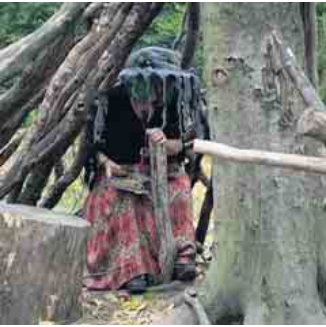
kleine Hexe wartet auf die Kinder