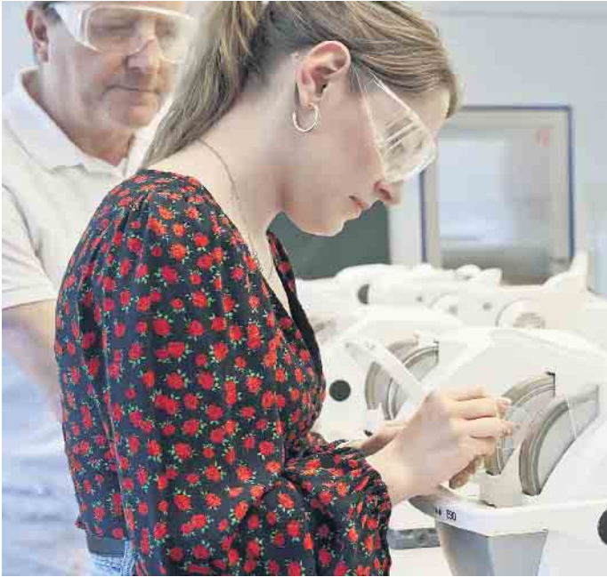
Brillenschliff, Reparatur und Anpassung - nur ein paar Dinge, die Augenoptiker-Auszubildene innerhalb von drei Jahren lernen.

Mit dem Gesellenbrief in der Tasche stehen alle Karrieretüren in der Augenoptik offen. Weitere Informationen dazu finden sich zum Beispiel unter www.be-optician.de . So können Gesellen sich berufsbegleitend oder in Vollzeit auf die Meisterprüfung vorbereiten und danach noch mehr Verantwortung im Betrieb übernehmen, eine Filiale leiten oder sich selbstständig machen - und auch selbst Azubis ausbilden. Alternativ werden an diversen Hochschulen Bachelor- und Masterstudiengänge in Augenoptik und Optometrie angeboten. (DJD)