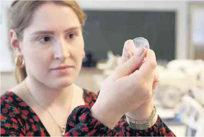
Handwerkliches Geschick und Präzision werden in der Augenoptik großgeschrieben.

Kein Tag wie der andere - warum sich der Einstieg in die Augenoptik lohnt