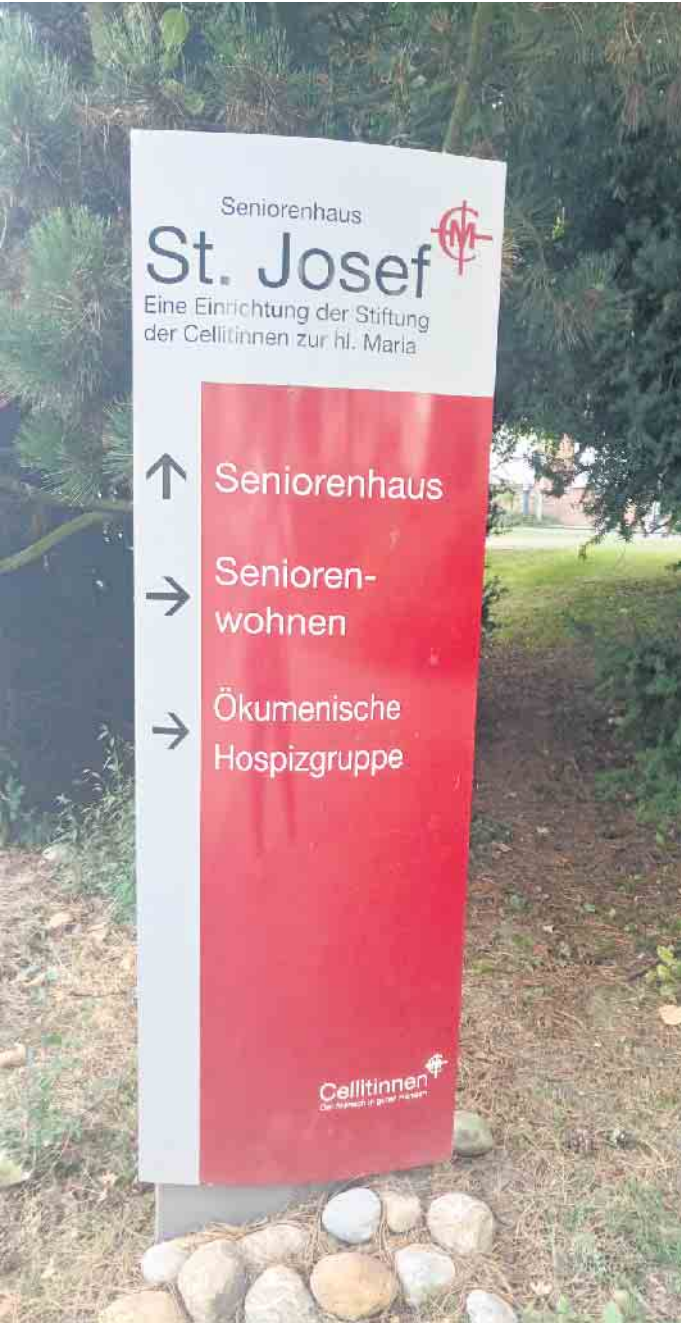
Eingang zum Gesprächscafé im Seniorenhaus St. Josef, Klosterstr. 50, 53340 Meckenheim