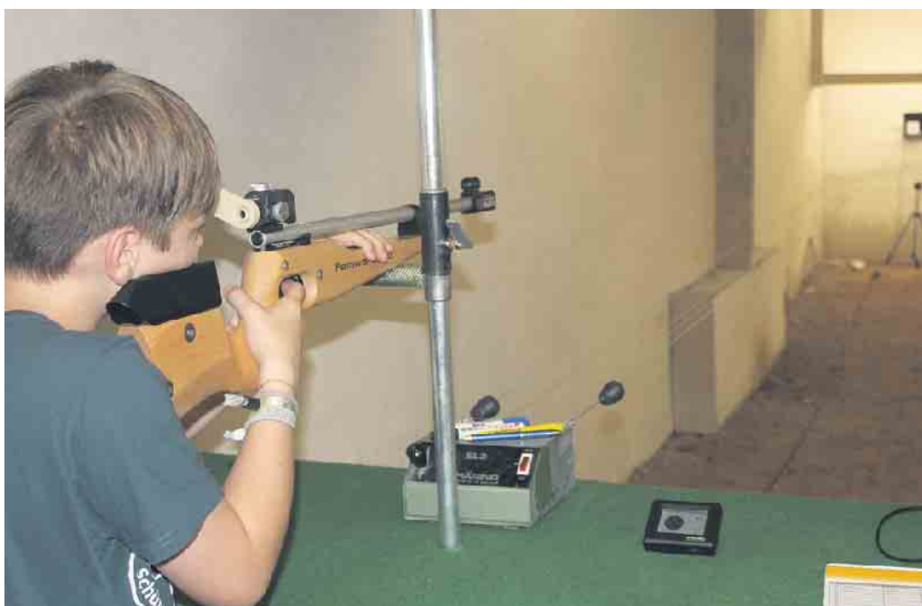
Die Gewinner der Schießtage freuten sich über Pokale, Urkunden und Sachpreise.

Wer Interesse an den Altendorfer Sebastianusschützen hat kann gerne einmal hineinschnuppern. Infos gibt es z. B. per E-Mail: info@schuetzenfamilie.de