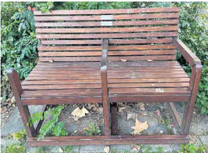
Beschädigte Bank an der Ev. Kirche

laufenden Reparaturen und auch Überholungen erfordern einen hohen finanziellen Einsatz seitens des Seniorenforums. Leider verzögern sich die Reparaturarbeiten in der Justizvollzugsanstalt Wittlich und somit auch die Wiederaufstellung durch den Bauhof der Stadt. Das Rheinbacher Seniorenforum will die Aktion bis Anfang 2024 abschließen. Dazu ist die aktive Unterstützung aller Beteiligten erforderlich. Rheinbacher Seniorenforum e. V.