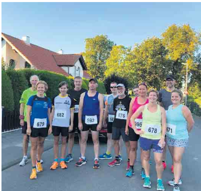
Teilnehmer vor dem Start.

Voranmeldungen sind über die Homepage, per Mail unter Anmelden@Obstmeilenlauf.de oder telefonisch möglich.