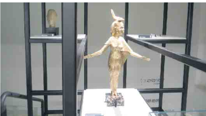
Skulptur im Treppenaufgang zum Museum

Hinweisen möchten wir noch auf das Angebot „Geburtstag im Ägyptischen Museum“. Es steht ein dekorierter Raum für eine kleine Feier und Platz für ein mitzubringendes Buffet zur Verfügung. Ebenso gibt es einen spannenden Bastelnachmittag im Ägyptischen Museum