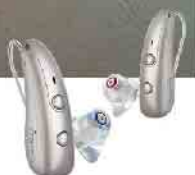
Pure Charge&Go BCT IX