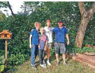
Gastfamilien schenken Austauschschüler/innen ein Zuhause auf Zeit.

Gemeinsames Abendessen und gemütliches Beisammensein: Jedes Jahr freuen sich Jugendliche aus der ganzen Welt darauf, einen Schulbesuch in Deutschland zu machen und den Alltag bei einer Familie zu erleben. Die Gastfamilien schenken ihnen ein Zuhause auf Zeit. Die Erfahrung zeigt: Einen internationalen Gast in die eigene Familie aufzunehmen, ist ein Erlebnis, das bereichert und verbindet - seien es ein paar Wochen, drei Monate oder ein ganzes Schuljahr! Nicht nur die internationalen Jugendlichen zwischen 14 und 18 Jahren gewinnen durch die Begegnung unvergessliche Eindrücke. Auch die Gastfamilien erleben inspirierende Momente und können aktiv zum interkulturellen Austausch in Deutschland beitragen. Experiment e.V., Deutschlands älteste gemeinnützige Austauschorganisation, vermittelt schon lange Gastkinder in ihre Familien auf Zeit. Seit über 90 Jahren werden weltweite Programme wie Schüleraustausche oder Ferienprogramme organisiert. Bei all diesen Programmen sind die Gastfamilien das Herzstück. Ob im Ausland oder in Deutschland: Durch die Offenheit, die eigenen Türen zu öffnen, werden Austauschträume wahr! Und es entsteht ein neues Zuhause fernab der Heimat, das in Erinnerung bleibt. Bevor sie ein Gastkind bei sich aufnehmen, machen sich viele Familien Gedanken. Kann man wirklich eine fremde Person in den Kreis der Familie aufnehmen? Wird sie sich wohlfühlen? Wie kann man Probleme ansprechen?