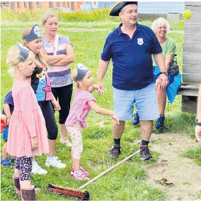
Beim Dosenwerfen zeigten die kleinen Piraten ihre Treffsicherheit

Sand gebuddelt um diese dann an der großen Schatztruhe gegen süße Naturalien eintauschen zu können. Für das leibliche Wohl war natürlich auch bestens gesorgt. Neben Hotdogs und erfrischenden Getränken gab es leckeren Kuchen und Kaffee für die Großen. Die Organisatoren des Festes zeigten sich sehr zufrieden, obwohl das Wetter sich ein klein wenig launisch zeigte. Aber echte Piraten kennen kein schlechtes Wetter und so ließen sich die kleinen und großen Gäste durch die kleinen Regenschauer nicht vertreiben und feierten bis zum Schluss fröhlich weiter. Martina Welter Pressesprecherin der 1. KG Merl