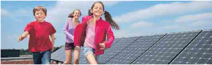
Systeme auf Flüssigkunststoff-Basis dichten Flächen unter Gründächern genauso sicher ab wie Dachdurchdringungen für Ständer von PV-Modulen. So haben auch zukünftige Generationen noch Freude am Eigenheim.

kuppeln schon länger bewährt und einige Vorteile hat: Abdichtungen auf Basis von PMMA-Flüssigkunststoff, wie sie etwa Triflex anbietet. Sie härten schnell aus, dichten sehr zuverlässig ab und haben eine zu erwartende Lebensdauer von 25 Jahren. Bei einer Sanierung punkten sie insbesondere dadurch, dass das flüssige Material in der Regel ohne Entfernen der vorhandenen Abdichtung aufgebracht werden kann und sich flexibel an die Gegebenheiten anpasst. Das geringe Gewicht beeinflusst dabei die Statik des Daches nicht. Wer sein Dach saniert, sollte auch darüber nachdenken, ob er es zusätzlich zur Energiegewinnung nutzen oder begrünen möchte. Photovoltaik-Module lassen sich mit Flüssigkunststoff sicher an die Dachfläche anbinden. Gründächer bieten nicht nur ökologische, sondern auch ökonomische Vorteile, indem sie die