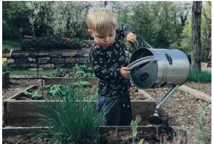
Mit der richtigen Pflege wird der Garten auch während der heißen Jahreszeit zur blühenden Oase.

Ein sattgrüner Rasen ist der Stolz eines jeden Gärtners. Im Sommer